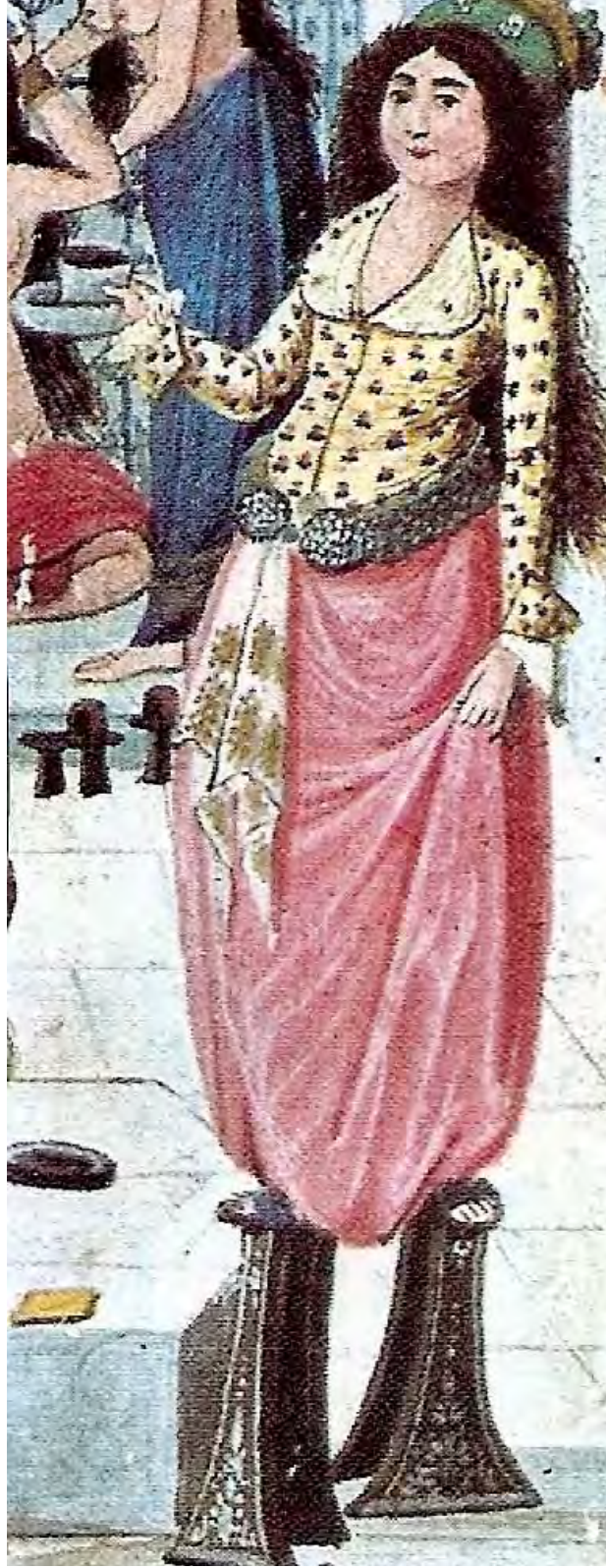
Örnek: 4- Hamam müşterilerine kahve ikram eden ana kadın ve giysileri. (Fazıl Hüseyin'in Zenannamesinden Detay) İstanbul Üniversitesi Kitaplığı.