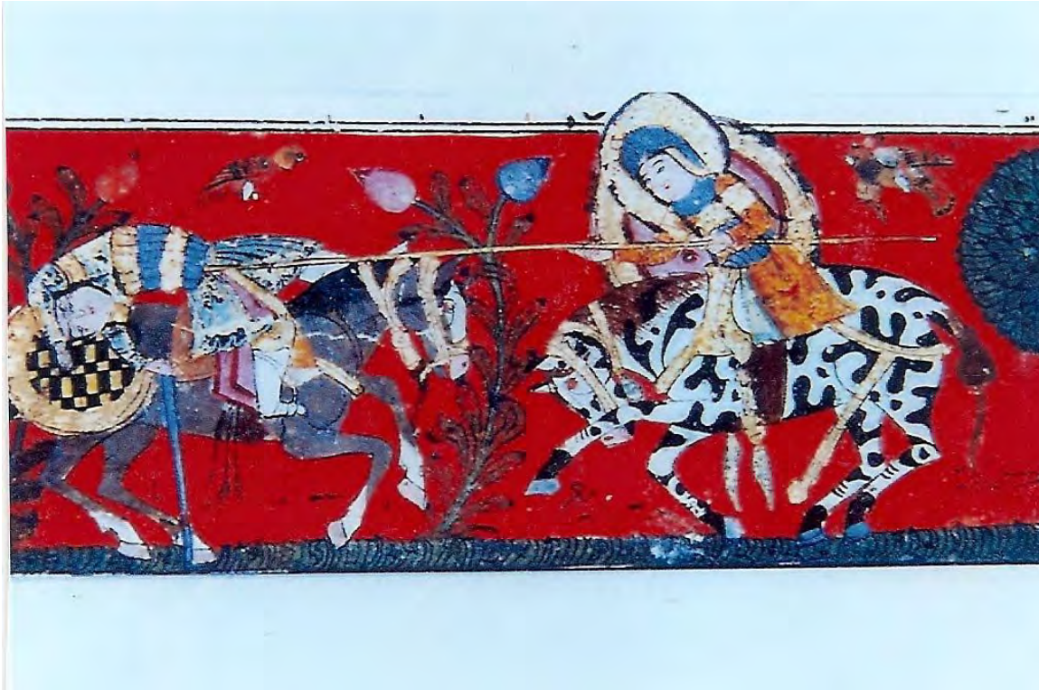
Örnek: 1-Varka ve Gülşah. XIII. Yüzyıl. T.S.M.K.H.841

(Resim: Çağlar Boyu Anadolu'da Kadın , Anıtlar ve Müzeler Genel Müdürlüğü yayınları, Ankara 1993, s. 193.)