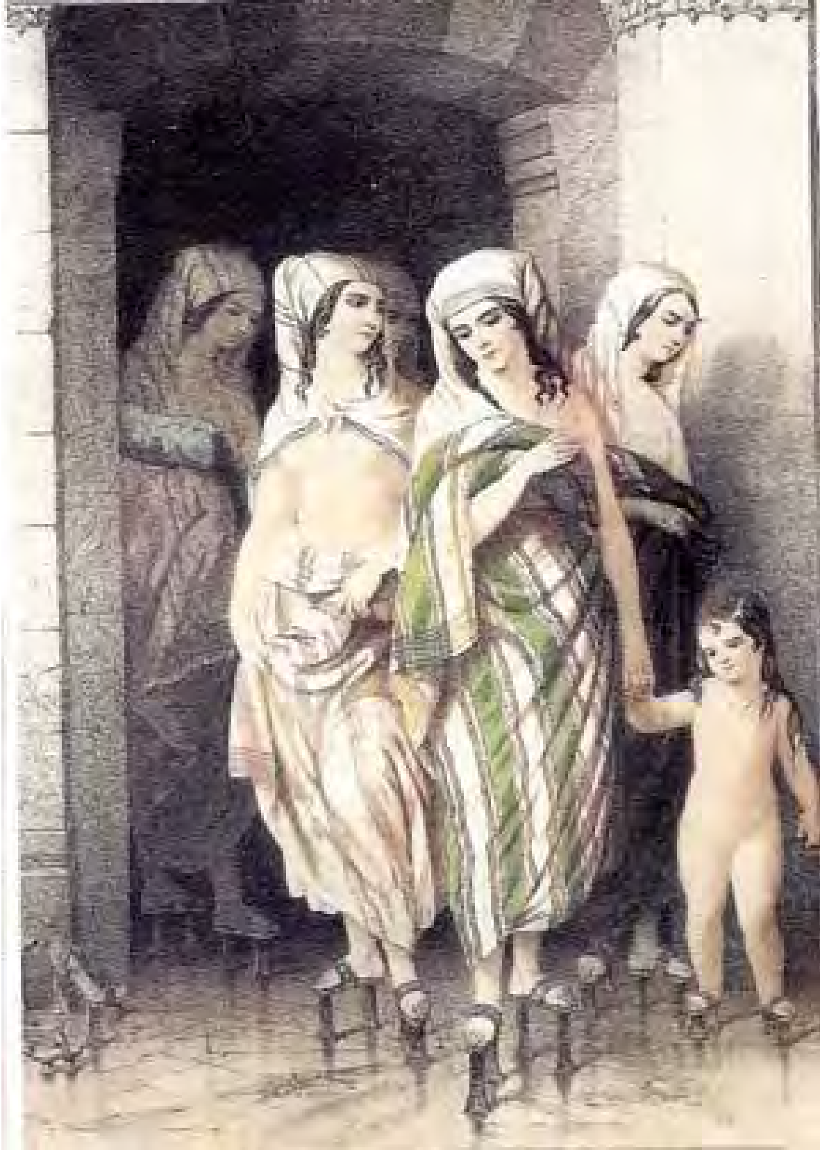
Resim 3: Topkapı'da hamam