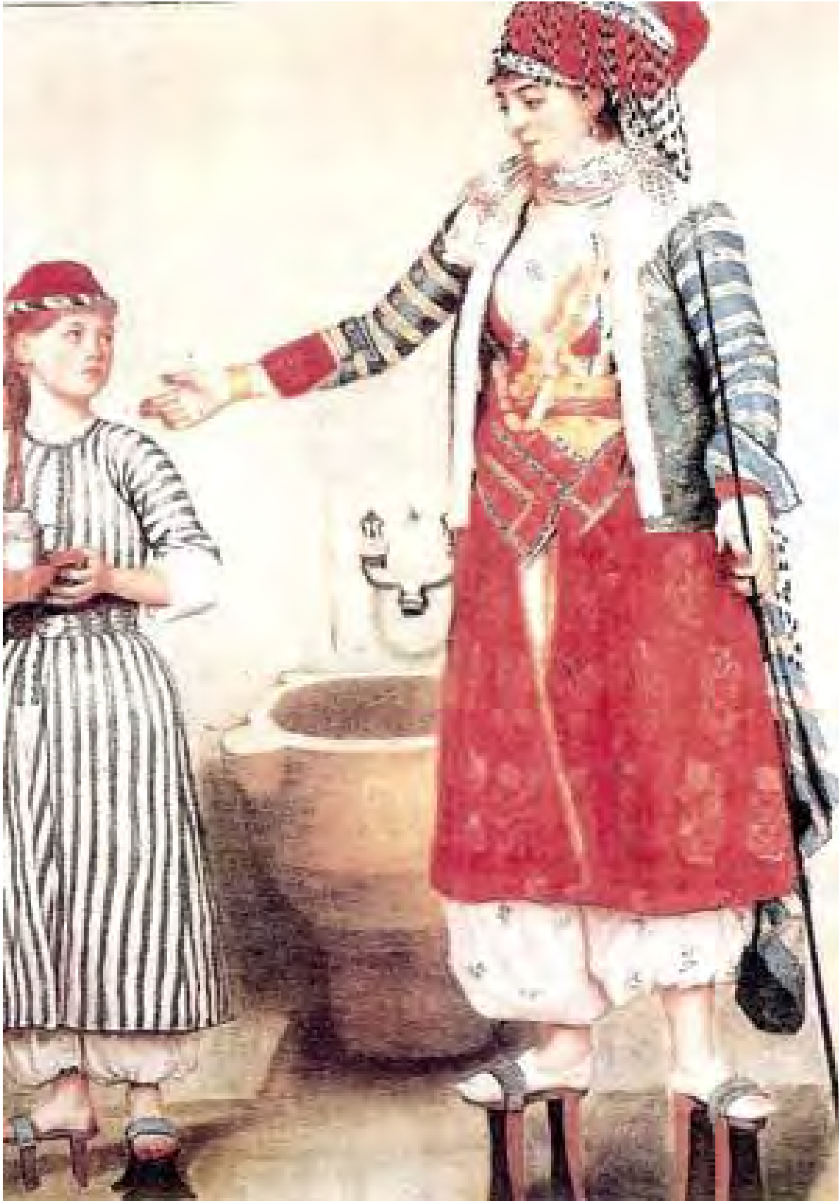
Resim 2: Hamamda kadın ve halayıđı