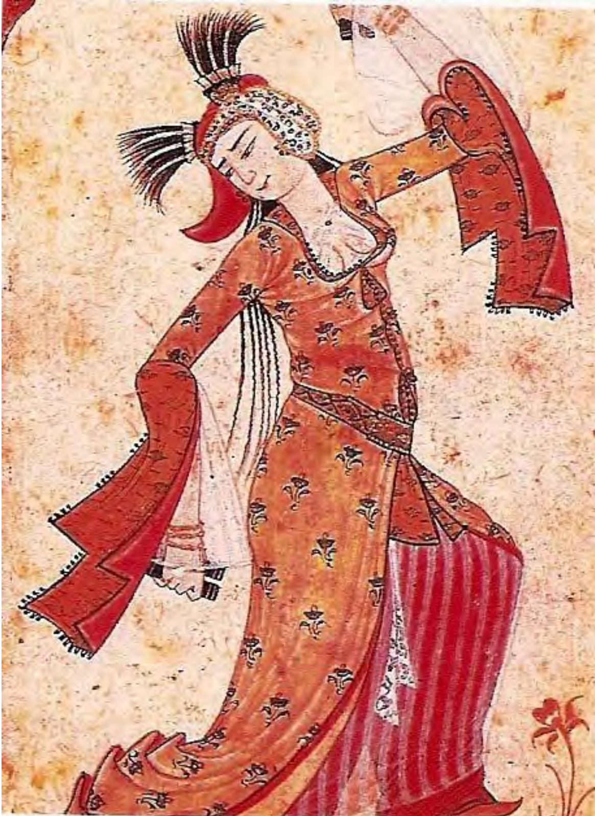
Örnek: 7- Levni. Rakseden genç kız kâğıt üzerine Sulu boya 9 cm x 14,2 cm T.S.M.K 2164 y. 18 a. (Resim Ünver, S-Levni 1957) 1720-1725.