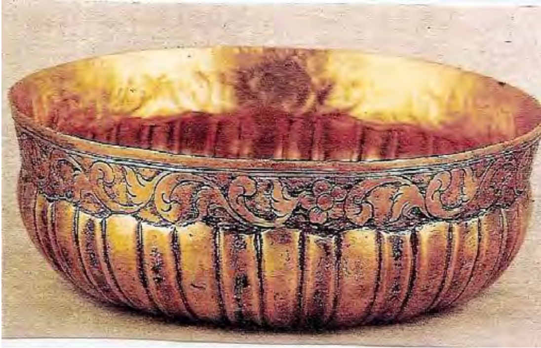
Örnek: 5- Hamam tası. (Sadberk Hanım Müzesi -İstanbul) Resim. G. Kalaycıođlu, E. Pekin, (İstanbul'da Hamamlar ve Gezmeler S. 54)