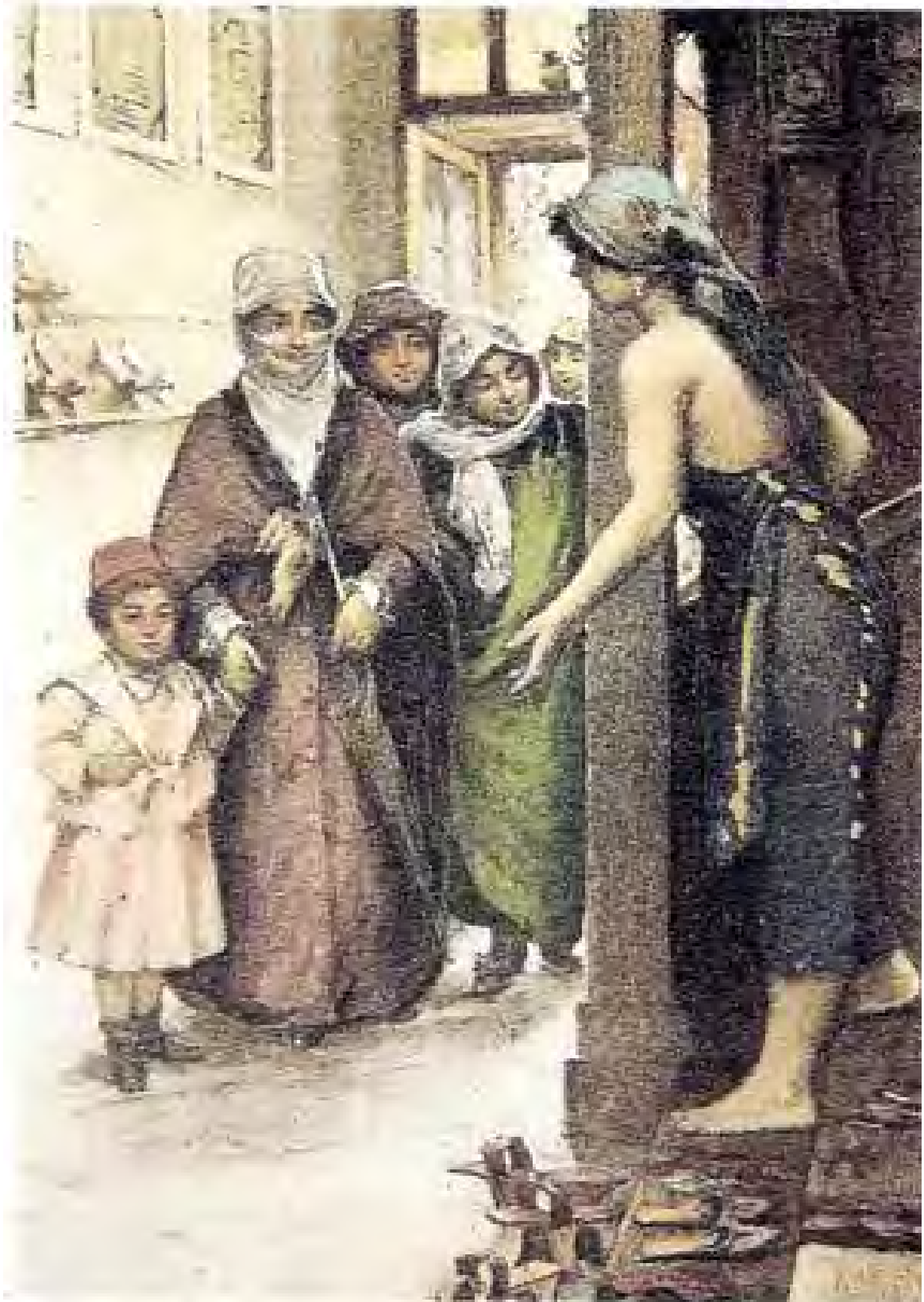
Resim 1: Hamama gelenler