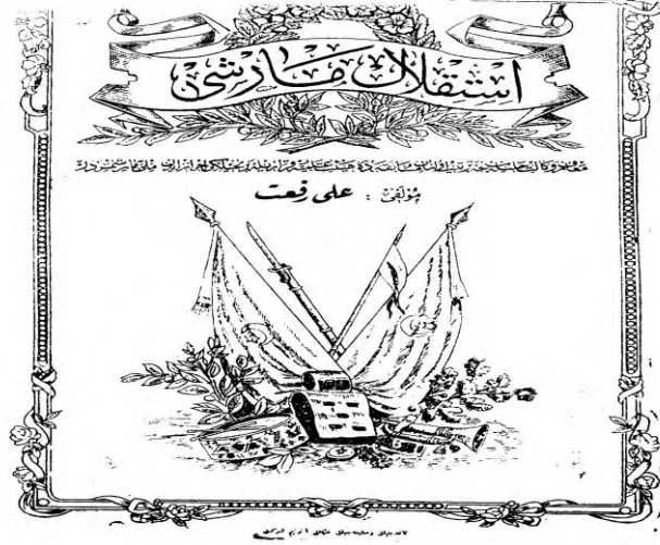
Ali Rifat Çağatay Bestesinin kapağı (1921)