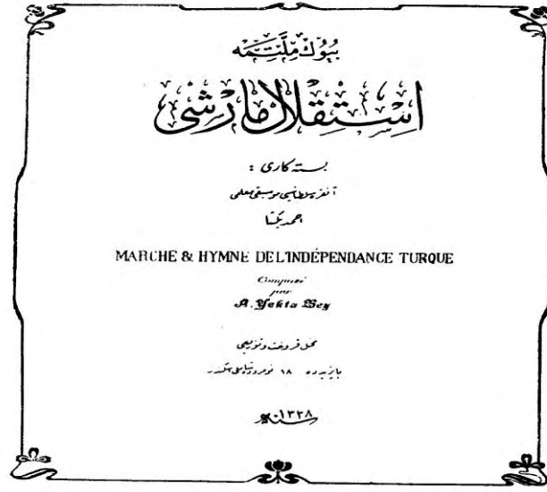
Ahmed Yekta Madran Bestesi'nin Kapağı.