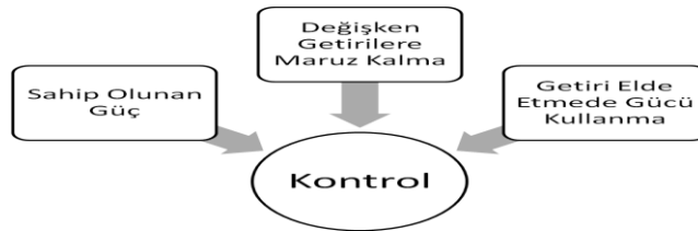
Şekil 3: Kontrolün Değerlendirilmesindeki Unsurlar

UFRS 10’un Ek B2 ve B3 maddeleri dikkate alındığında konsolidasyon işlemi için kontrol gücünün olup olmadığının belirlenmesinde Şekil 3’te gösterilen unsurlar değerlendirilir.