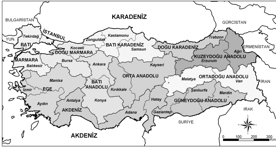
Harita: 3. Türkiye'nin İBBS Düzey 2 Bölgeleri

ve bölgesel ölçekte yapılacak planlarla giderilmeye çalışılmaktadır. Türkiye de bölgesel farklılıkların fazlaca gözleendiği bir ülke konumundadır. Özellikle ülkenin batı kesimi ile doğu kesimi arasında hem ekonomik hem de sosyal açıdan büyük farklılıklar gözlenmektedir. Kısa vadede bu farklılıkların giderilmesi mümkün olmamakla birlikte uzun vadede bölgesel ölçekte uygulanacak kalkınma planları ile mevcut farklılıklar minimum düzeye indirilebilir. Düzey 2 bölgelerinde kurulacak olan “Kalkınma Ajansları”nın, bölgeler arasındaki farklılıkların azaltılmasında önemli bir rol oynayacağı düşünülmektedir.