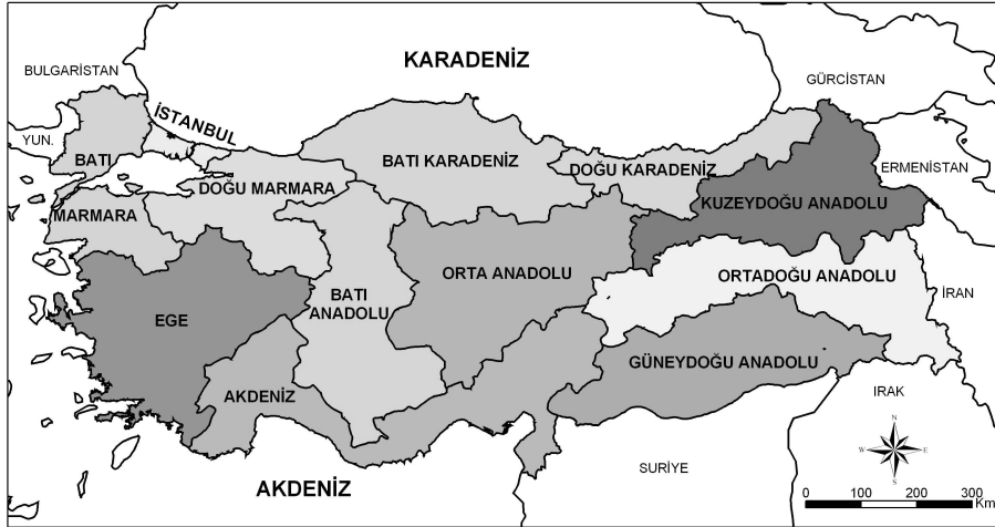
Harita: 2. Türkiye’nin İBBS Düzey 1 Bölgeleri

TBMM tarafından kabul edilen bir kanunla Türkiye’de kalkınma planları, bundan böyle İBBS bölgelerine göre yapılacaktır. Avrupa ülkelerinde olduğu gibi Düzey 2 bölgeleri, aynı zamanda planlama bölgeleri olarak karşımıza çıkacaktır. Düzey 2 bölgelerinde Kalkınma Ajansları kurulacak ve planlama çalışmaları ülkesel ölçekten bölgesel ölçüğe taşınacaktır.