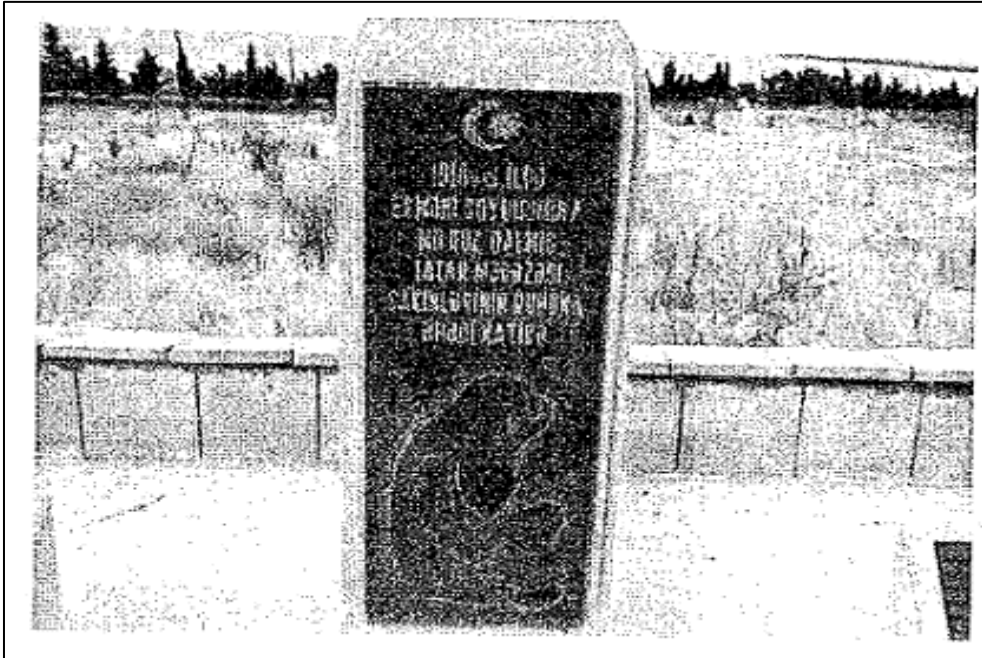
Şamahı'nın Mereze Kasabasında Türk Askerleri İçin Yapılan Anıt

Araştırmamızı noktalarken son sözü bu arada bir daha tekrar ederek diyorum ki, Tarihe karşı bu cinayetleri işleyenler, kin, nefret ve nifak besleyenler ve böylece tarihin akışını değiştirenler kendilerine gelmelidir. Kin, nefret, nifak, yalan, iftira ve düşmanlıkla bir yere varılmayacağı apaçık ortada. Mesele bilgi ve belgelere dayanılarak, tarihçiler ve araştırmacılar tarafından tarafsız ve adil bir biçimde, arşiv ve tanıklara dayanılarak çözüme kavuşturulmalıdır.