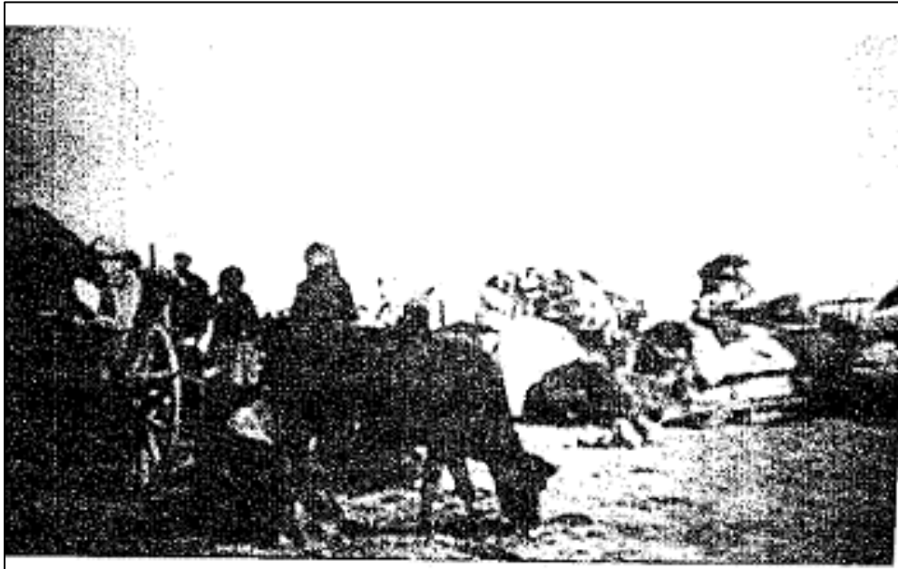
Ermeni ve Malakan Mezaliminden Kurtulan Şamahı Göçmenleri (1918)