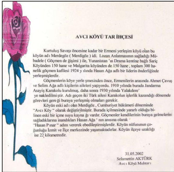
Figür 2. Avcıköyü Tarihçesi

Bu tip fotoğraf ve panolar, mübadiller tarafından ortak hafızanın devamlılığı açısından önemli bulunmaktadır. Özellikle de genç kuşaklar için ayrı bir anlam taşıyan bu semboller, geçmişle gelecek arasında kurulmaya çalışılan bağların en basit somut örneklerindedir.