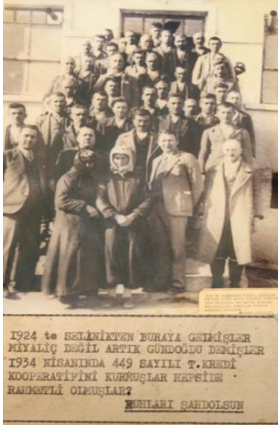
Figür 1. Gündoğdu köyüne yerleşen mübadiller