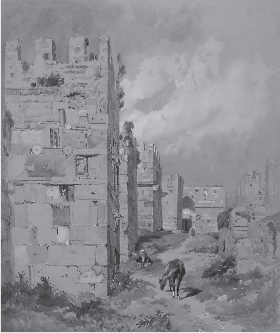
Resim 2: Jules Laurens, Sinop

( http://www.inha.fr/spip.php?article352&id_document=626 )