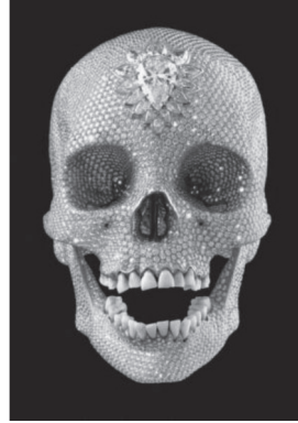
Resim:2 Tanrı Aşkına,2007 (For the Love of God)

For the Love of God için “Lüksün en yüksek sembolüyle ölümün en yüksek sembolünü kaplayıp cehenneme ölümle cevap vererek yalnızca yaşamı kutlamak istiyorum”(http://www.guardian.co.uk/uk/2006/may/21/arts.artsnews) açıklamasını yapan sanatçı, çalışmasını White Cube galerisinde loş bir ortamda sunmakla ampirik tecrübelerimize bağlı haz ve hoşlanma duygularımızla çalışmanın niteliklerinin kesiştiği yerde çatışan bir değer yargısı yakalar. Bu kesişme noktasında, onun niteliğinin sanat eseri mi yoksa mücevher mi olduğu konusunda bir şaşkınlığa düşebiliriz. Arkeolojik olgunun ve kıymetli bir nesnenin birleşmesindeki deneyimden ulaşılan estetik deneyim bağlamında amaçlanan marketin göz ardı edilmemesi gerekir. Şüphesiz her sanatçı sanatsal bir değer maddi değer üzerinden önemini saptamaya çalışır. Bu da ancak satıldığında ve alıcısına gittiğinde keşfedilebilir. Fakat doğrudan bir satış endişesi üzerine tasarlandığının enerjisini fazlaca hissettiğimiz ve büyük bir riskin de göze alındığını Hirst'ün kafatasında açıkça görüyoruz.