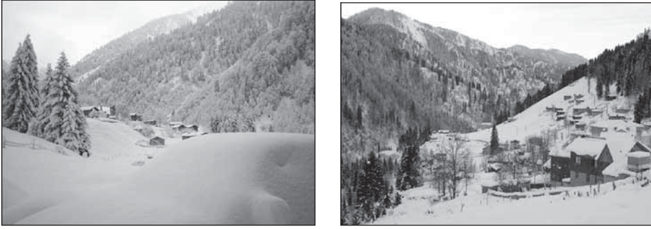
Fotoğraf 2. Heliski tutkunlarına konaklama imkânı sunan Ayder Yaylası.

Heliski, ülkemizde henüz pek fazla bilinmeyen bir spor dalı olarak dikkat çekmektedir. Türkiye'de bu spor, Kaçkar Dağları'nın Rize sınırları içinde kalan Çamlıhemşin ve 2009 yılı itibarıyla de İkizdere vadisi ve Trabzon Uzungöl 'de gerçekleştirilmiştir. Türkiye'de bu sporun yapıldığı ilk yer olan Kaçkar Dağları'nın Rize'nin Çamlıhemşin ilçesinde kalan bölümü, Ayder Yaylası'ndaki konaklama imkânı nedeniyle heliski tutkunlarının giderek yoğun ilgisini çekmektedir (Fotoğraf 2).