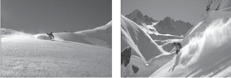
Fotoğraf 4. Heliski çoğunlukla orman sınırının üzerinde ve yerleşme alanlarından uzakta yapılmaktadır.

Kaçkarlardaki heliski turlarının ücretlendirilmesi iki şekilde yapılmaktadır. Bu uygulamaların birincisi, irtifa kaybına dayalı olan paket turlardır. Bu organizasyonda belirtilen irtifa kaybı, kayakçının helikopterden indiği nokta ile kaydığı ve helikopterin onu geri götürmek için alacağı nokta arasındaki yükseklik farkı olarak tanımlanmaktadır. Bu uygulama ile haftalık 20 bin metre garanti, 30 bin metre irtifa kaybı, paketin içerisine dâhil edilmektedir. Bu irtifa kaybının, 20 bin metrenin altında kalması durumunda ödenen ücretin bir kısmı kayakçılara iade edilmektedir. 30 bin metreye kadar başka bir ödeme yapılmamaktadır. Böylece bir günde bir müşteri 3 - 4 bin metre irtifa kaybı ile kayak yapabilme imkânına sahip olmaktadır. Başka bir ifadeyle heliski tutkunları, 1 haftada yaklaşık 30 kilometre heliski yaptıktan sonra ülkelerine dönmektedirler.