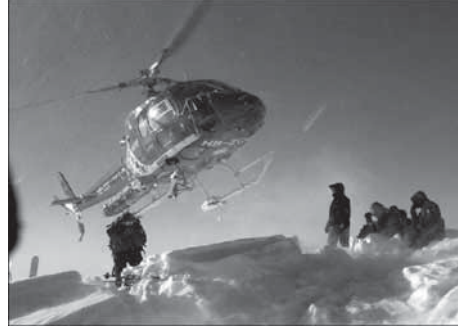
Fotoğraf 3. Kayarak vadilere inen kayakçılar, helikopterlerle tekrar zirvelere taşınmaktadır.

sislerinin bulunduğu Ayder Yaylası'na taşınmaktadır. Aynı durum İkizdere ve Uzungöl'de konaklayan kayakçılar için de söz konusudur.