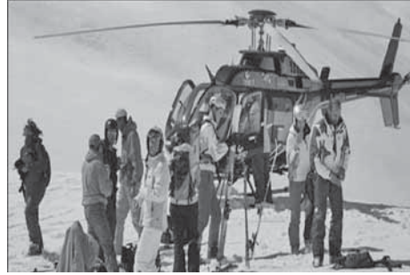
Fotoğraf 7. Kaçkar Dağları Uzun Devreli Gelişim Planı'nın sağladığı izinle, heliski helikopterleri zirvelere iniş gerçekleştirebilmektedir.