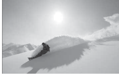
Fotoğraf 5. Kaçkarlara düşen kar örtüsünün yüksekliği evlerin çatılarından anlaşılmalıdır. Bu kar örtüsü, kristalize özelliği ile heliski için oldukça uygundur.

rünen odur ki, Kaçkar Dağları doğa sevenlerin vazgeçilmezi olmuştur. Bu özellikleriyle Kaçkarlar, yabancı turistler tarafından Keşfedilmemiş Cennet olarak tanımlanmaktadır. Hiç şüphesiz bu tür organizasyonlar, hem Türkiye'nin ve hem de Doğu Karadeniz'in Avrupa'ya tanıtımında büyük katkı sağlamaktadır. Kış sporları ile tanıtımlar sayesinde Doğu Karadeniz'in çehresi değişmeye başlamış ve böylece turizmin yılın tamamına yayılması konusunda büyük aşama kaydedilmiştir.