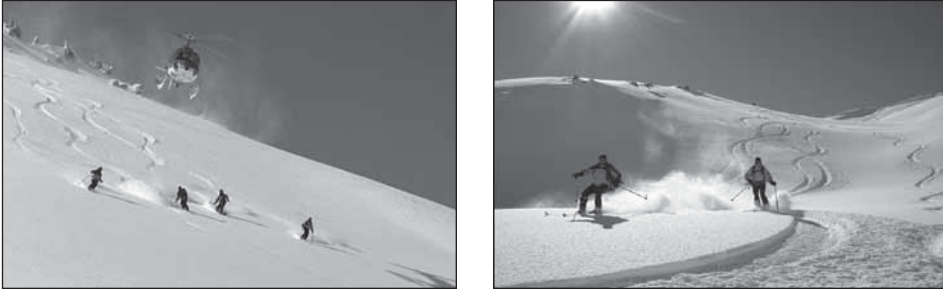
Fotoğraf 1. Türkiye’de heliski ilk kez Kaçkar Dağları’nda gerçekleştirilmiştir. Bu dağlar, heliski için oldukça elverişli şartlara sahiptir.

Heliski, sporcu ve kayakçıların helikopterle zirvelere ve yükseklerle çıkarılarak gerçekleştirilen dağ kayağıdır. Başka bir anlatımla; heliski, uzman rehberler eşliğinde profesyonel kayakçılar tarafından kar kalınlığının çok yüksek olduğu zirvelerde yapılan bir adrenalin sporudur. Tutku, adrenalin, maceraperestlik heliski sporunu en iyi tarif edebilecek kelimeler olarak kabul edilmektedir. Halen dünyanın en tehlikeli ve elit sporlarından biri olarak görülmektedir. Heliski; kayakla ilgili hiçbir altyapısı olmayan yerlerde kayak yapmak için, kayakçıların konakladıkları yerlerden helikopterle alınıp, kayak yapılacak yüksek zirvelere bırakılması ve ardından da kayakçıların kayarak indikleri yerlerden helikopterle tekrar alınarak, konaklama yerlerine geri götürülmeleri ile gerçekleştirilmektedir. Bu sporun en önemli özelliği, kayak merkezinden ve kayak pistinden uzakta, yüksek dağlık alanlarda, tabiatla iç içe, bol karın üstünde yapılmasıdır (Fotoğraf 1).