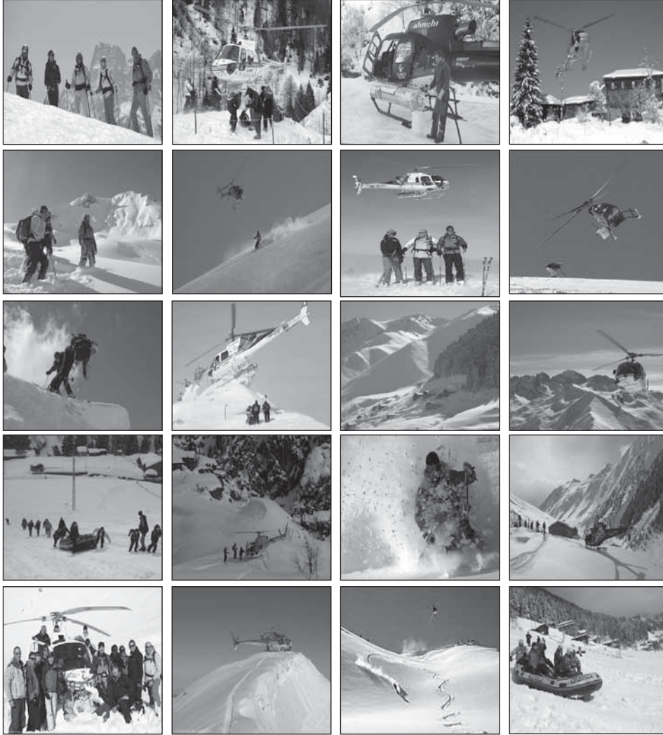
Fotoğraf. 6. Kaçkarlardaki heliski sporu etkinliklerinden görüntüler.

gösterilerek, korumaya yönelik gerekli çalışmalar yapılmaktadır. Helikopter uçuşları ve kayak faaliyeti sırasında yaban hayatının etkilenmemesi için gerekli önlemler alınmakta ve sporcuların çevre konusunda son derece duyarlı olmaları istenmektedir. 10 kişilik gruplar halinde yüksek kesimlerde kayan sporcuların, kesinlikle daha önceden belirlenmiş rotanın dışına çıkmalarına izin verilmemektedir. Bu alanların da orman sınırının üzerinde, yaban hayatının ve endemik bitkinin olmadığı ya da çok az olduğu yerler olması, fauna ve floranın etkilenmemesi açısından önemlidir.