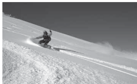
Fotoğraf 8. Kaçkar Dağları ve çevresinde kış sporlarından kar motoru, lastik botla kayma ve snowcat ski gibi faaliyetler de yapılabilmektedir.