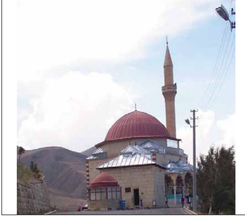
Ek I: Abdurrahman Gazi Cami ve Türbesi