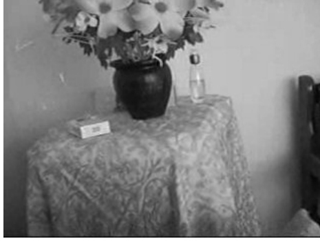
Fotoğraf 8. Eski Dönemlerde Ferace ile Çeyizlere Konulan Başörtüsü Bugün Masa Örtüsü Olarak Kullanılıyor.

Balıkesir yöresindeki kullanılan feracelerin ortak özelliklerinden biri de üzerlerinde desen ve süsün bulunmamasıdır. Düz, siyah biçimlerine rastlanılan feracenin modelleri ise köyden köye farklılıklar göstermektedir. Kurtdere ve Aslantepecik köyünde düz, bol biçimde olan feracelerin Bigadiç gibi bu köylere yakın bölgelerde önden bağlamalı şekilde dikildiği kadınlar tarafından bildirilmiştir. Bazı köylerde çıtçıtlar kullanılarak manto biçiminde, bazılarında ise bedene oturtulmuş olarak yandan bağlamalı dikilen feracelerin boyu ise ferace giyen kadının isteğine bağlı olarak değişmektedir. Bütün köylerde var olan ortak özellik ise boylarının dizkapağının altında olma şartıdır.