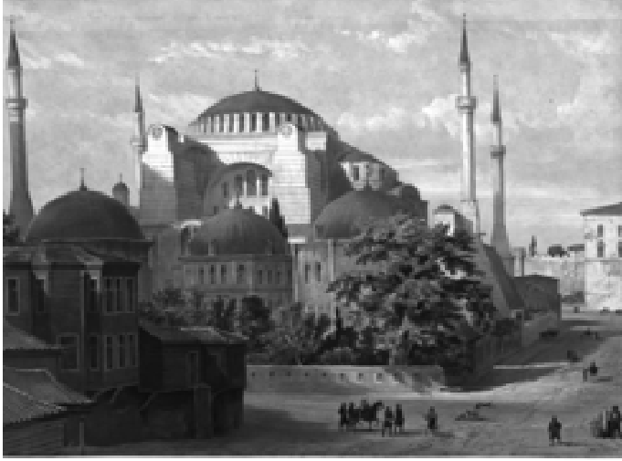
Resim 6: Litografi Albümü, Levha 19 (İstanbul Üniversitesi Kütüphanesi)

Mango 1962: 16). Minare, güneydoğu payandanın üzerinde, kireç taşından yapılmış bir kare prizma kaide üzerinde, 16 köşeli tuğla gövdenin ve şerefenin üst bölümünde incelerek yükselmekteydi. Gaspare Fossati, minarenin konik külahını kaldırır, girland (çelenk) bezemeli bir friz ekleyerek külahı tekrar yerleştirir. Böylece minare, öteki üçü ile aynı yüksekliğe ulaşır. Bu bezemelerdeki antik sanatın izlerini taşıyan girland kabartmalar, 19. yüzyılda Batı etkisindeki Osmanlı sanatına örnek oluşturur (Emerson 1950: 29-30). 5