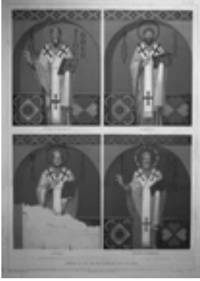
Resim 12: Gregorios Theologos, Dionysios,