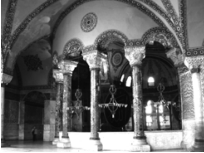
Resim 4: Galeri, kuzeydoğu eksedra

18. yüzyıl sonundaki depremlerde, özellikle 1766 yılında kubbede oluşan çatlaklar, onarımlar sırasında doldurulmuştur. Kubbeyi sağlamlaştırmak amacıyla kasmağa dıştan iki madeni halka bağlanır; bunların üzeri alçıdan bezemeli bir kornişle örtülür (Mango 1962: 13, Tanyeli vd. 2004: 23-58). 2