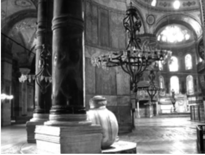
Resim 10: Kandil avizeler

çemindedir. Üzerlerindeki palmetler, Türk ve Batı bezemelerinin karışımı olarak değerlendirilir (Resim 10). Gaspare Fossati'nin, Türk ustalarca bronzdan döküldüklerini belirtmesine karşın, kandillerin ahşap oldukları ve üzerlerinin altın yaldızla boyandıkları saptanmıştır (Lethaby - Swainson 1894: 120, Mango 1962: 15). 17