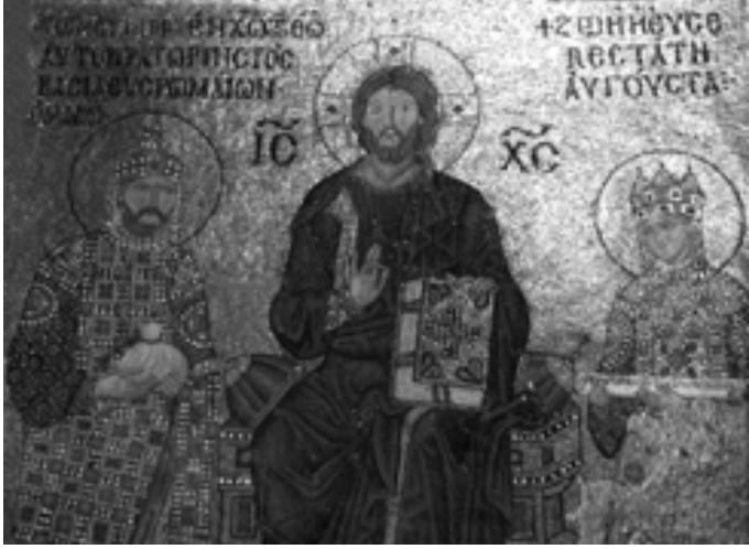
Resim 2: İsa, IX. Konstantinos Monomakhos ve İmparatoriçe Zoe mozaiği

Mozaik ilk yapıldığında Zoe'nin önceki Paphlagonya'lı eşlerinden biri yer alırken, daha sonra 1041'de, IX. Konstantinos'un yüzü eklenerek 1042'de tamamlanır. İmparator elinde para kesesi, imparatoriçe ise rulo taşır. Sahne olasılıkla imparatorluğun kiliseye bağışını anlatır (Resim 2).