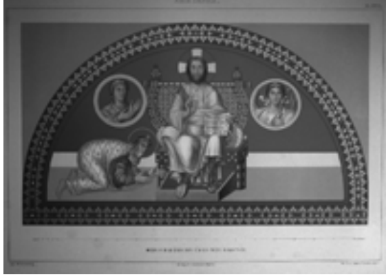
Resim 13: İmparator Kapısı mozaiği, İsa, Nikolaos, Gregorios Armenios İmparator VI. Leo, Meryem, (Salzenberg 1854) Başmelek Gabriel (Salzenberg 1854)