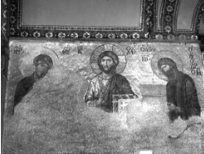
Resim 3: Deesis mozaiği

Mozaik ilk yapıldığında Zoe'nin önceki Paphlagonya'lı eşlerinden biri yer alırken, daha sonra 1041'de, IX. Konstantinos'un yüzü eklenerek 1042'de tamamlanır. İmparator elinde para kesesi, imparatoriçe ise rulo taşır. Sahne olasılıkla imparatorluğun kiliseye bağışını anlatır (Resim 2).