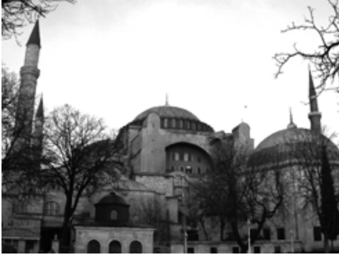
Resim 1: Ayasofya'nın gney cepheden grnm

Dođuda ite dairesel, dıřta  cepheli apsis , batıda kemerlerle dokuz blme ayrılan esonarteks ve eksonarteks (i ve dıř giriř meknları) yer alır. Dıř narteks 5,75 m, i narteks 9,55 m'dir (Eyice 1984: 13).