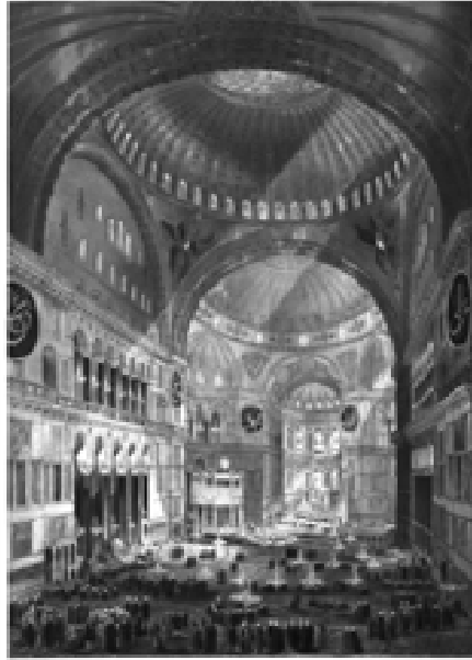
Resim 5: Litografi Albümü, Levha 3

su mermeri, porfir gibi farklı mermer panolarla kaplıydı. Onarımlarda eski mermer parçaların yanında stucco lustro (mermer taklidi boyama) tekniđi ile kaplamaların biçim ve rengine benzer boyalı alçı kullanılmıştır (Schlüther 2000: 181). Çalışmanın sonuna dođru, süslemeler üzerindeki kirler temizlenerek parlatılmıştır. İç narteksin batı duvarındaki özgün mermer kaplamaların bir bölümü bugün yerinde yoktur. Bunlar, Fossati'lerin onarımı sırasında da var olmadıklarından mermer benzeri boyanmıştır. Bu çalışma İtalyan ressam Antonio Fornari'nin danışmanlığında yapılmıştır (Dirimtekin 1960: 27, Mango 1962: 13-14, Kinross 1972: 118).