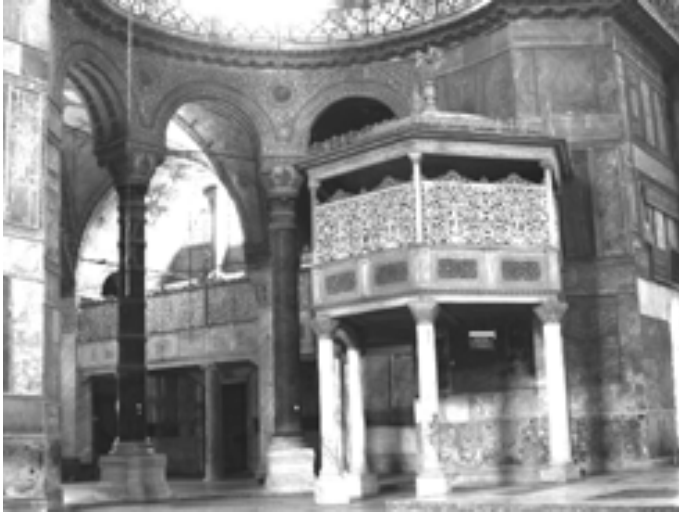
Resim 7: Hnkr Mahfil (S. Dođan Arřivi)

Hnkr mahfilinin bir geit ile kilisenin kuzeydođusundaki dikdrtgen planlı bir salona bađlanmasıyla da burada bir hnkr dairesi oluřturulmuřtur. Bu blme yapının dođusundan girilir. Giriřte bir n mekn, buraya aılan bir kapıdan geilen kk bir oda, gnmzde bir kahve ocađı ve tuvalet olarak kullanılmaktadır. Buradaki kk oda, sultanın camiye geldiđi zaman kısa sreli dinlenmesi ve bazı kabuller iin hazırlanmıřtır. Fossati'nin, bu odada kullanılmak zere yaptırdığı masanın bugn nerede olduđu bilinmemektedir. Giriř holnden geniř bir dehlizle, penceresi olmayan ana salona girilir ki, hnkr mahfile bu salondan geilmektedir.