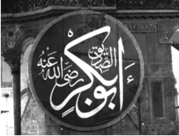
Resim 9: Halife Ebubekir yazılı levha

Kaligrafi levhalarıyla aynı zamanda kubbenin merkezine de bir madalyon içinde Kur'an'dan bir ayet yazılmıştır. Yeşil bir zemin üzerinde Mustafa İzzet Efendi'nin altın yaldızlı yazısı, Kuran'ın 24. Âyeti'nin 35. Sûresi'ni içerir (Akgündüz vd. 2005: 505). 15