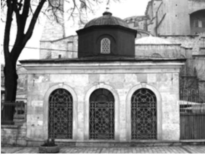
Resim 8: Muvakkithane, güney cephe

Bugün Ayasofya Külliyesine ait I. Mahmud Kütüphanesi okuma salonunda iki saat ile Kütüphane'nin kitap hazinesinde bir saat bulunmaktadır. Bu saatlerin Muvakkithane'ye ait olup olmadıkları tespit edilememiştir (Akgündüz vd. 2005: 772, 774).