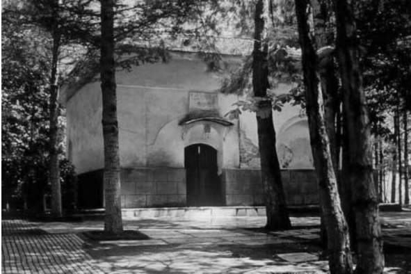
Fotoğraf:10 Türbenin 1980'li yıllarda onarım öncesi durumu.