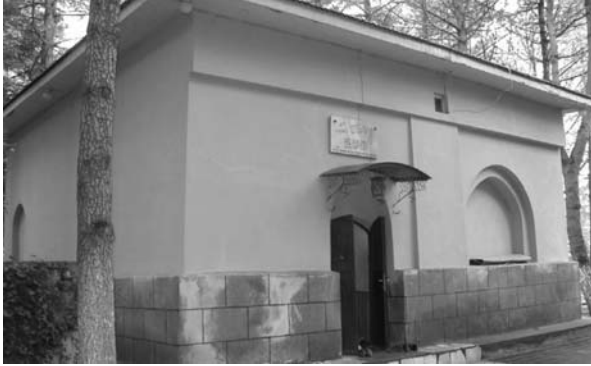
Fotoğraf: 3 Emir Karatekin Türbesi'nin batı cephesi Photograph: 3 Western facade of the Emir Karatekin Tomb