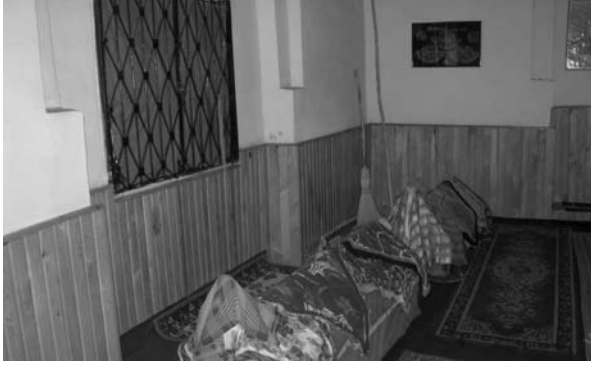
Fotoğraf:11 Emir Karatekin Türbesi'nde güney duvarındaki niş. Photograph:11 Niche on the southern wall of the Tomb.