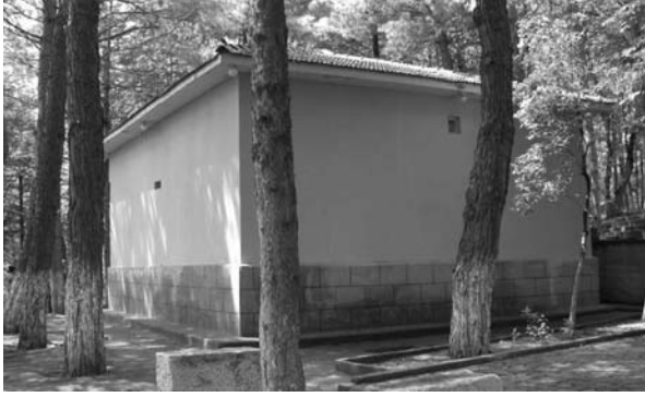
Fotoğraf: 2 Emir Karatekin Türbesi'nin doğu ve güney cepheleri Photograph: 2 Eastern and southern facades of the Emir Karatekin Tomb