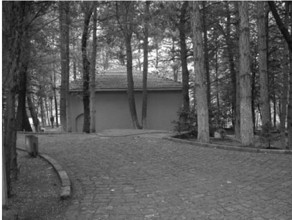
Fotoğraf:1 Emir Karatekin Türbesi'nin kuzey cephesi Photograph :1 Northern facade of the Emir Karatekin Tomb