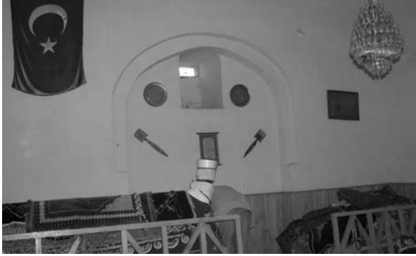
Fotoğraf:6 Türbenin güney duvarı. Photograph:6 Southern wall of the Tomb.

Photograph: 5 Cistern within the Tomb in its northwest part, inside view of the western door and the adjacent niche.