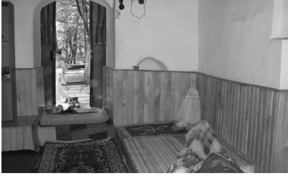
Fotoğraf: 5 Türbenin içinde kuzey –batısındaki sarnıç, batı kapısının ve yanındaki nişin içerden görünüşü.

Photograph: 5 Cistern within the Tomb in its northwest part, inside view of the western door and the adjacent niche.