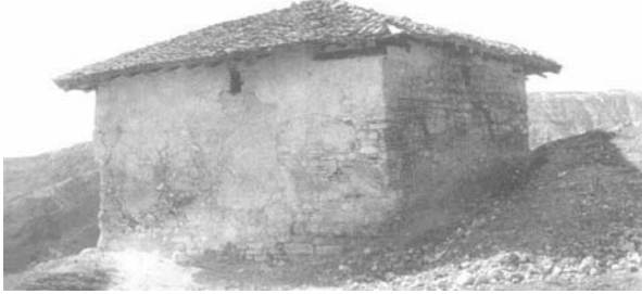
Fotoğraf: 9 Türbenin kuzey ve doğu cepheleri. (Vakıflar Genel Müdürlüğü Arşivi'nden) Photograph: 9 Northern and eastern facade of the Tomb. (From the Archive of the General Directorate of Foundations)