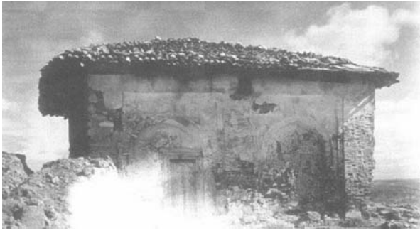
Fotoğraf:7 Türbenin batı cephesi. Photograph:7 Western facade of the Tomb.