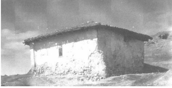
Fotoğraf:8 Türbenin güney cephesi. Photograph:8 Southern facade of the Tomb.