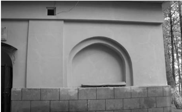
Fotoğraf: 4 Türbenin batı cephesindeki niş. Photograph: 4 Niche on the western facade of the Tomb.