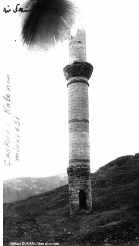
Fotoğraf:12 Çankırı Kalesi'ndeki Sultan Selim Camii'nin minaresi Photograph:12 Minaret of the Sultan Selim Mosque in the Castle of Çankırı