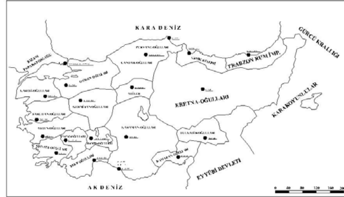
Harita 8. ANADOLU'DA SELÇUKLU DÖNEMİ SONUNDA ÇOK PARÇALI SİYASAL EGEMENLİK DÖNEMİNDE ORTAYA ÇIKAN YENİ DEĞİM-BAĞLANTI MERKEZLERİ (1277-1308)

Harita 7. ANADOLU'DA İLHANLI DÖNEMİ SELÇUKLU İDARİ BİRİMLERİ (1237-1277)