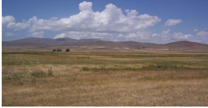
Ek 5: Mormoc Ovası