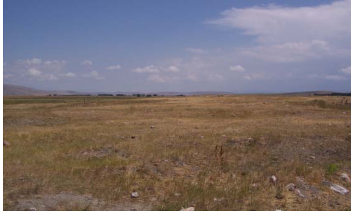
Ek 6: Mormoc