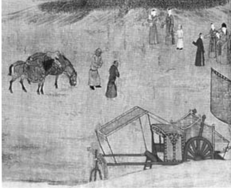
Wen-chi [pauklar] ve hizmet[ileriyle] gezinirken