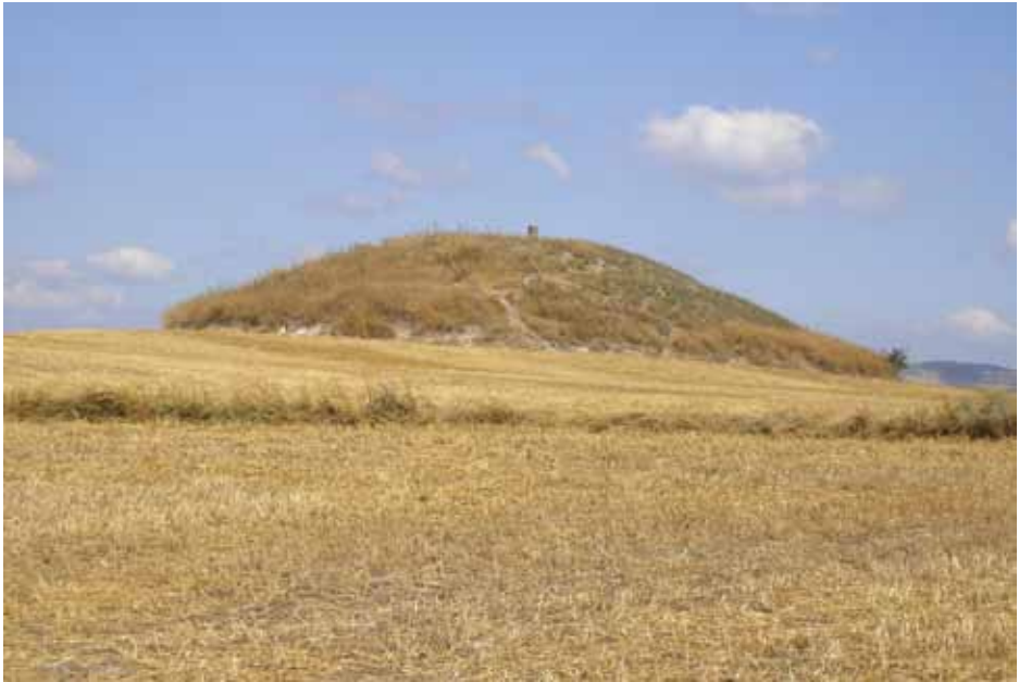
Figür 4: Troas bölgesinde bulunan çok sayıda tümülüstten biri.