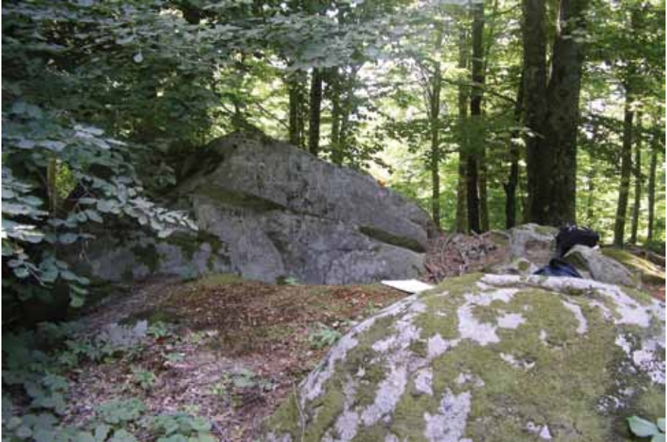
Figür 2: Pannukomme arazisinin batı sınırını gösteren sınır taşı yazıtı.