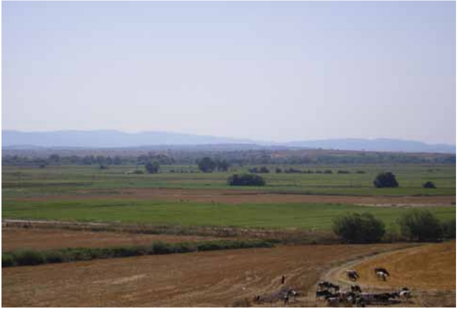
Figür 3: Granikos savaş alanının doğu yönden (Perslerin gözünden) görünümü.