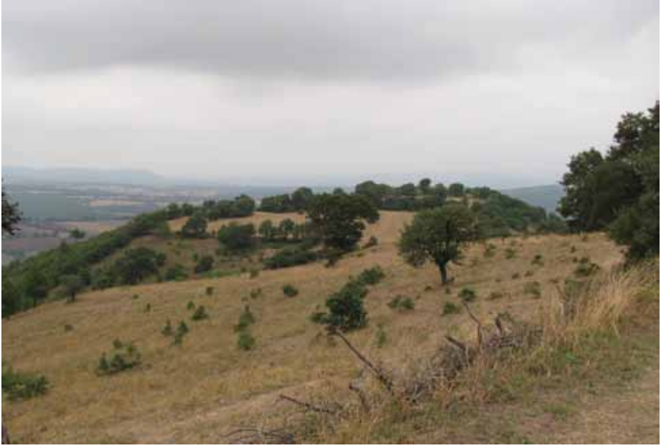
Figür 1: Pers hakimiyeti zamanında Troas'da tespit edilen küçük yerleşim yerlerinden biri.