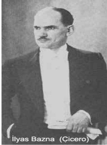
İlyas Bazna (Çicero)