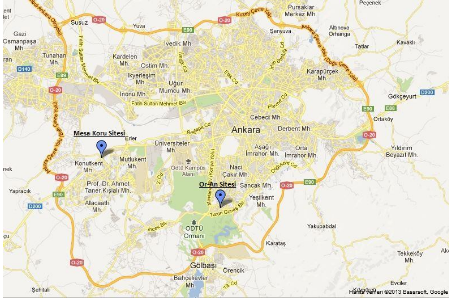
Harita 1: Mesa Koru Sitesi ve Or-An Sitesi'nin Konumu