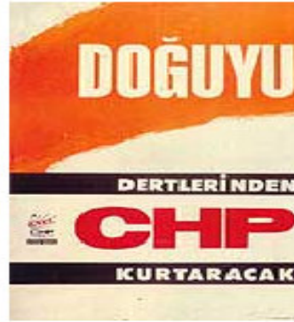
Resim 1: 1965 Seçimlerinde kullanılan afiş örnekleri