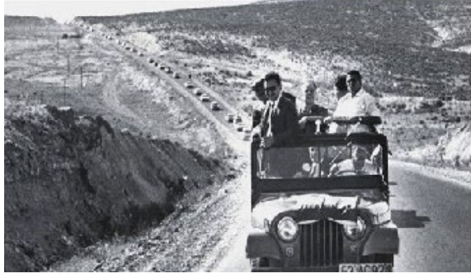
Resim 2: Yurt Gezileri (Tarihleri kesin olmamakla birlikte 1973 yılından sonra olması muhtemeldir.)

Ortanın Solu ekibi seçimler esnasında ve sonrasında verdikleri mücadelenin karşılığını 18. kurultay'da alır. Kurultay kararlarıyla Ortanın Solu, parti politikası olur. 18. kurultay'da Bülent Ecevit'in Ortanın Solu kitabı delegelere dağıtılır. Ayrıca, Ortanın Solu kitabı kadın kolları tarafından özetlenip parti