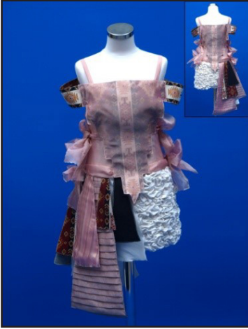
Resim 9. Vasfiye'nin gelinlik tasarımı

Kullandığım göçebe kültürüne ait kültürel temanın giyim özelliklerini çıkış noktası olarak