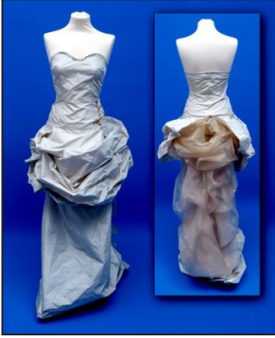
Resim 15. Elvin'in gelinlik tasarımı