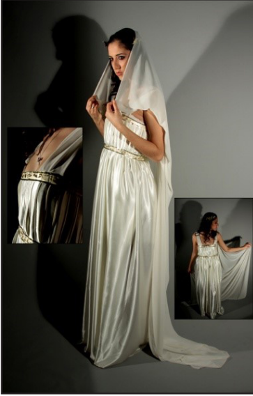
Resim 14. Özüm'ün gelinlik tasarımı