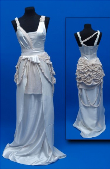
Resim 2. Jülide’nin gelinlik tasarımı

Şekil 3’te öğrencilerin kültürel algılarını tasarımlarına yansıtmaya biçimleri ana temasına dayalı alt temaları “Kültürel değerleri hatırlama”, “Kültürel değerleri yeniden yorumlama”, “Anadolu kültürüne dayalı yorumlama”, “Osmanlı kültürüne ait öğeleri yorumlama”, “Farklı kültürlerle dayalı yorumlama”, “Modern kültür öğelerini yorumlama”, “Kültürel farklılıkları organize ederek yorumlama” ve “Sosyo-kültürel yansımaları yorumlama” alt temaları ve alt temalara ilişkin boyutlar görülmektedir.