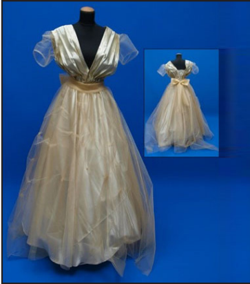
Resim 12. Nurgül'ün gelinlik tasarımı