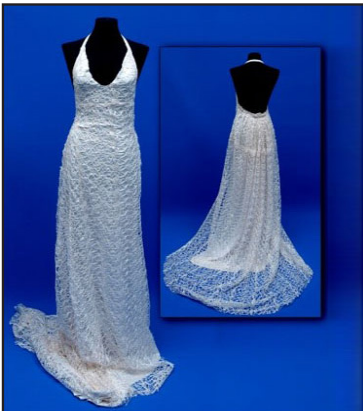
Resim 13. Özgü'nün gelinlik tasarımı

Yine aynı alt tema ile tasarımını ilişkilendiren öğrencilerden Nurgül, “Osmanlı zamanında kabarık gelinlik kullanılmıştı. Kollar da kabarık idi. Renk beyaz değildi. Osmanlı kültüründeki kıyafetlerden esinlenerek gelinliğin eteğini ve omuzlardaki kol kalıbını kabarttım” demektedir (Resim 12).