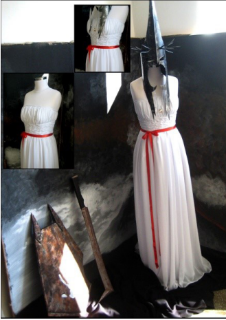
Resim 4. Jurata'nın gelinlik tasarımı

farkında olmadığım kültürel etkileri uyguladım. Kurgulamadığım tasarımları kurguladım. Bu tasarım, eski kültürel ve estetik değerleri tekrar inceleyip yeni çıkarımlar yapmamı sağladı (Resim 2).