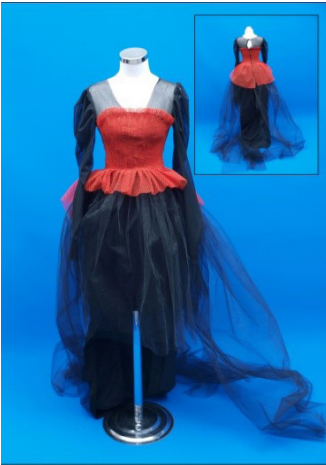
Resim 6. Aylin'in gelinlik tasarımı

kullanmaya karar verdim ve bu şekilde oluşturduğum dokuyu öne çıkardım. Tasarım sürecinde kültürün kaynak olarak kullanılması yeni fikirler vermekte ve ilham kaynağı olarak kullanılmaktadır. Kültürden bir ayrıntıyı tasarımımıza uyarlamak oldukça ilginç bir deneyimdi. Çünkü bu yaklaşım tasarımınıza yeni bir bakış açısı kazandırmanızı ve daha yaratıcı olmanızı sağlıyor (Resim 5).