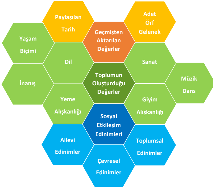
Şekil 1. Öğrencilerin kültür kavramına ilişkin görüşleri

Öğrencilerin kültür kavramını algılama biçimlerini anlamak amacı ile ‘Kültür kavramı sizin için ne ifade etmektedir?’ sorusu ile görüşlerini belirtmeleri istenmiştir. Öğrencilerin kültür kavramına ilişkin görüşleri Şekil 1’de gösterilmiştir. Şekil üzerinde üç ana tema şeklin ortasındaki koyu renkli beşgenler ile vurgulanmış ve bu ana temaları besleyen ve birbiri ile ilişkili olan alt temalar ise ana temaların açık tonu olan renklerle vurgulanmıştır. Kültür algısına ilişkin temaların kesin ayrımlar ile temalaştırılması yerine birbiri ile ilişkili bir biçimde temalaştırılması kavramsal kültür algısının daha iyi anlaşılması amacıyla hizmet etmektedir.