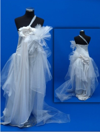
Resim 3. Ceren'in gelinlik tasarımı