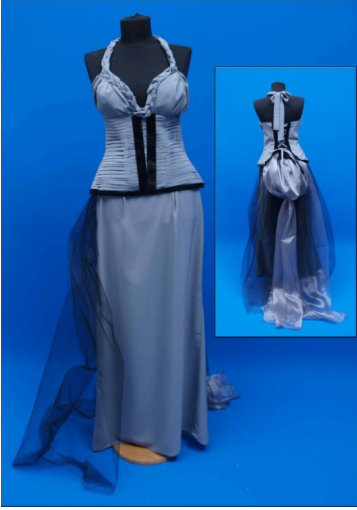
Resim 1. Görkem'in gelinlik tasarımı

aile ve çevresel etmenlerin önemine vurgu yapmaktadır.