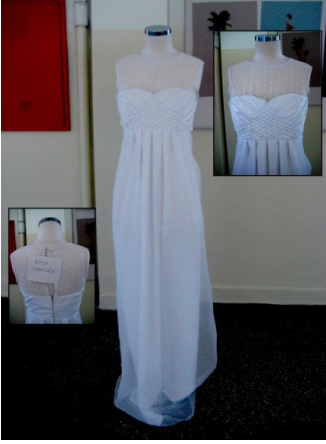
Resim 5. Roze'nin gelinlik tasarımı