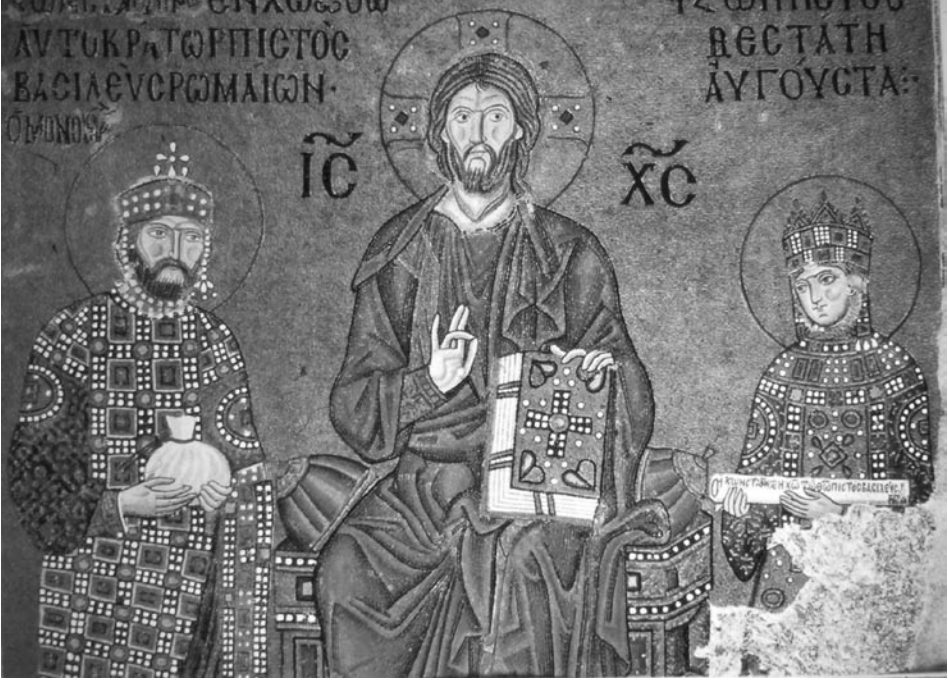
Foto. 21: İstanbul Ayasofya, Güney Galeri Mozaiklerinden İmparator IX. Konstantin ve Zoe