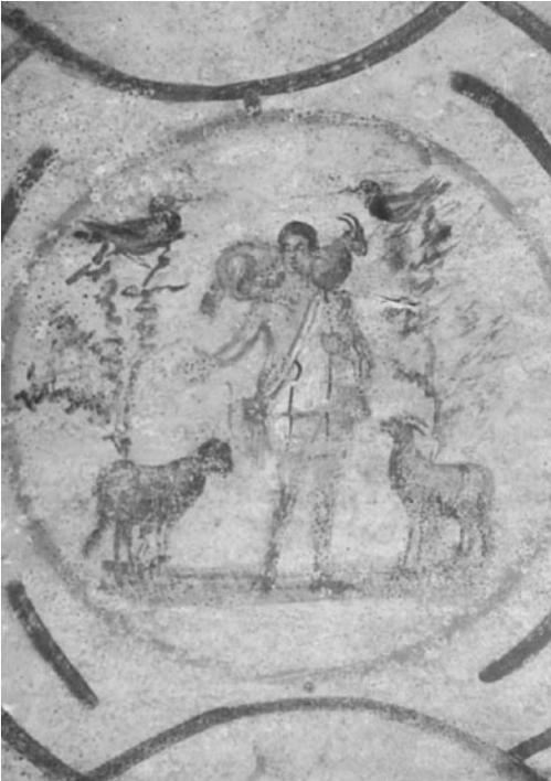
Foto. 4: Roma St. Priscilla Katakombu “Velatio” Kubbesi, İsa İyi Çoban