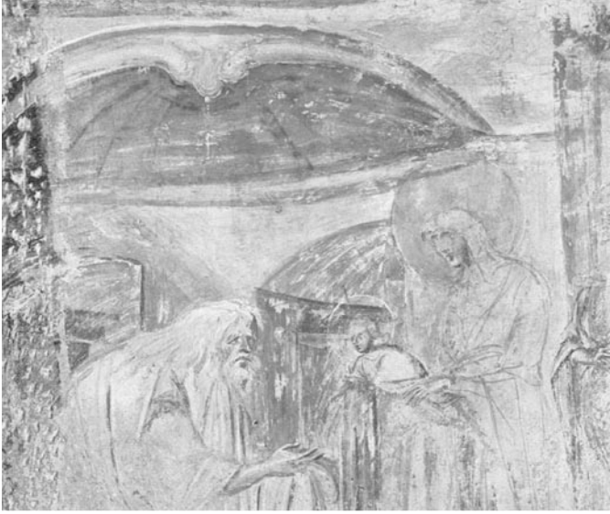
Foto. 9: Castelseprio Arındırma (Purification) 6.yy.öncesi (Grabar'dan)