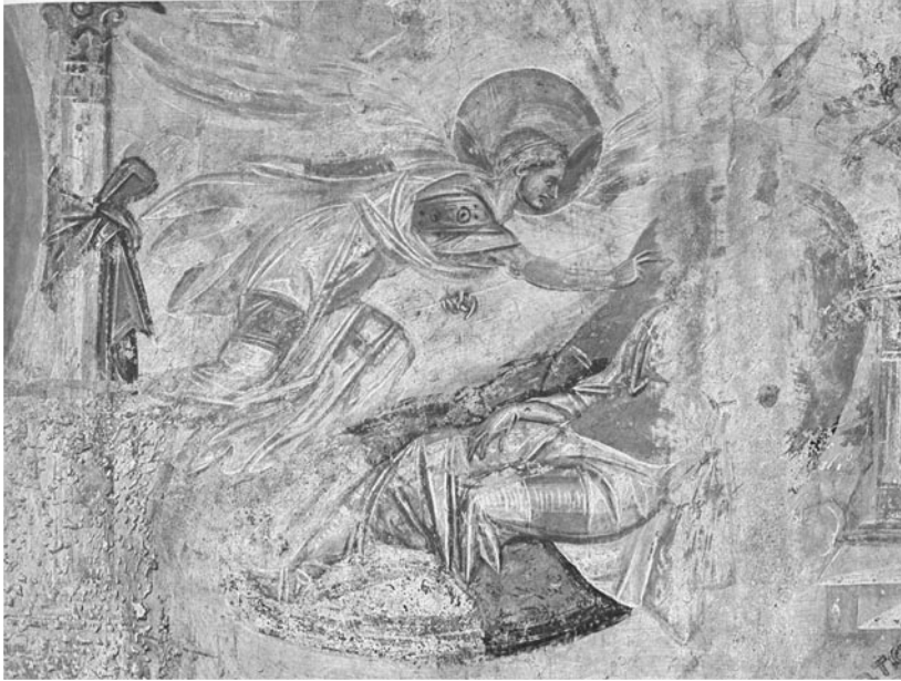
Foto. 8: Castelseprio Müjde (Annunciation) 6.yy.öncesi (Grabar'dan)