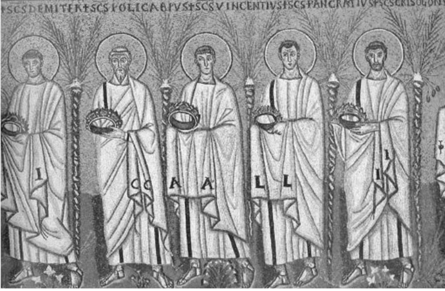
Foto. 17: Ravenna St. Apollinaire Nuovo Mozaiklerinden Martirler Tasviri (Grabar'dan)