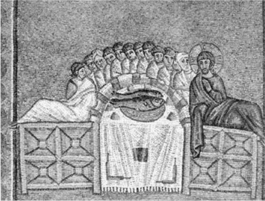
Foto. 12: Ravenna St.Apollinaire Nuovo Kilisesi Mozaiklerinden Son Akşam Yemeği (Grabar'dan)