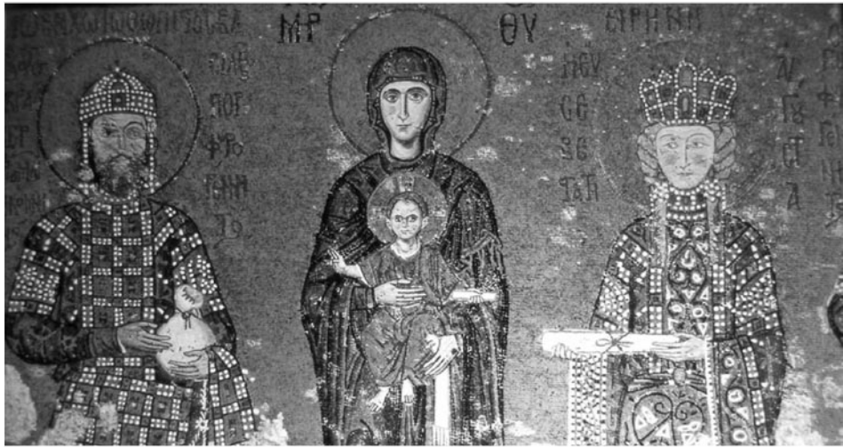
Foto. 20: İstanbul Ayasofya, Güney Galeri Mozaiklerinden İmparator John Komnenos ve Prenses Irene