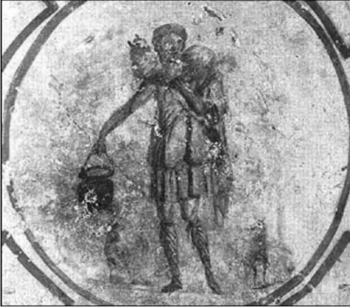
Foto. 5: Roma St. Callixtus Katakombu Lucina Kriptası İsa İyi Çoban