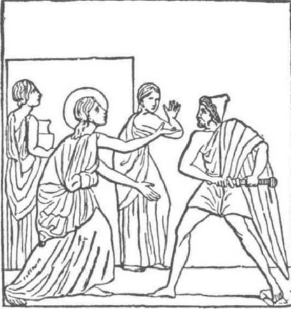
Foto. 1: Circe ve Odysseus (Ulysseus) M.Ö. 79 öncesi (Mazois'den)