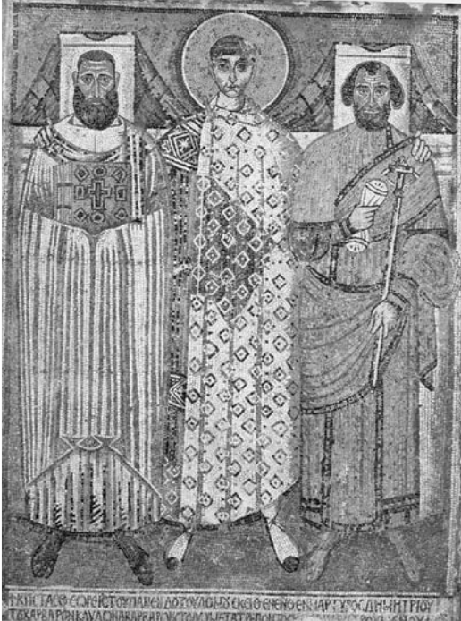
Foto. 18: Selanik Hagios Demetrios Basilikası, St.Demetrios ve Bağışçılar Mozaiği