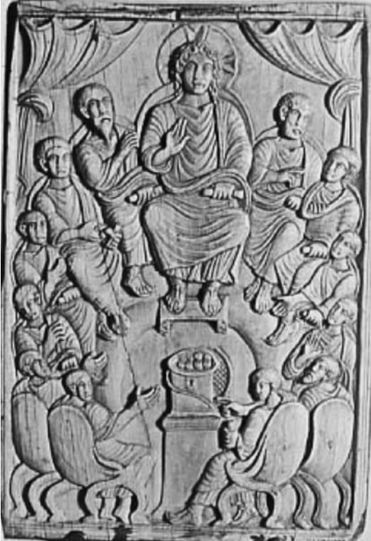
Foto. 10: İsa ve Havarilerin Komünyonu” Fildişi Levha, (Dijon Museum)