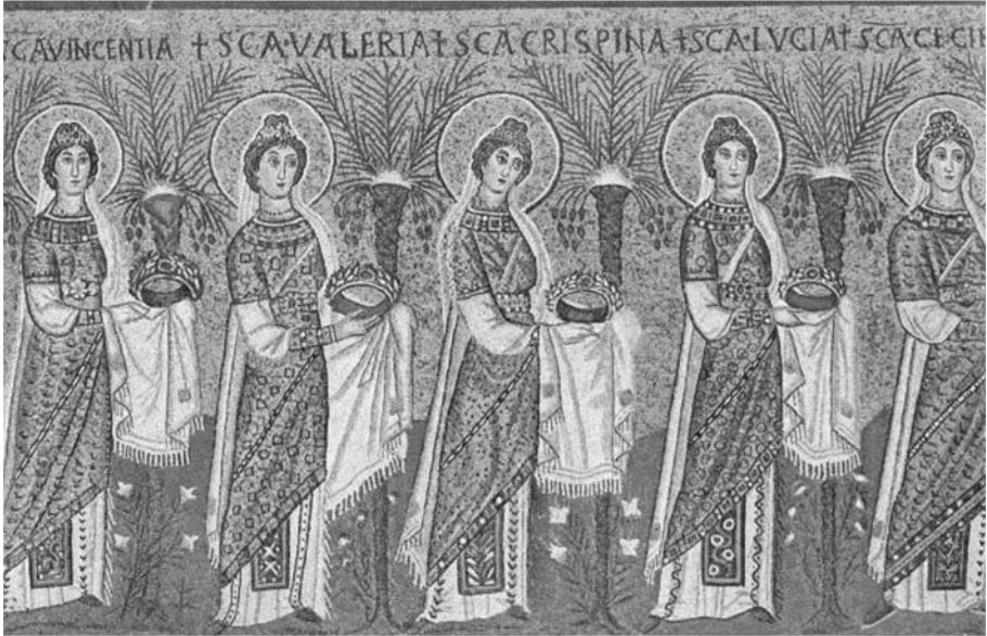
Foto. 16: Ravenna St. Apollinaire Nuovo Mozaiklerinden Kutsal Bakireler Tasviri (Grabar'dan)