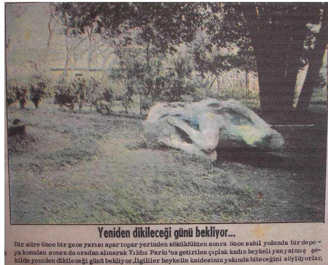
(Res.3) Heykel Yıldız Parkı'na dikilmeden önce gazetelerde bu şekilde yer almıştır.