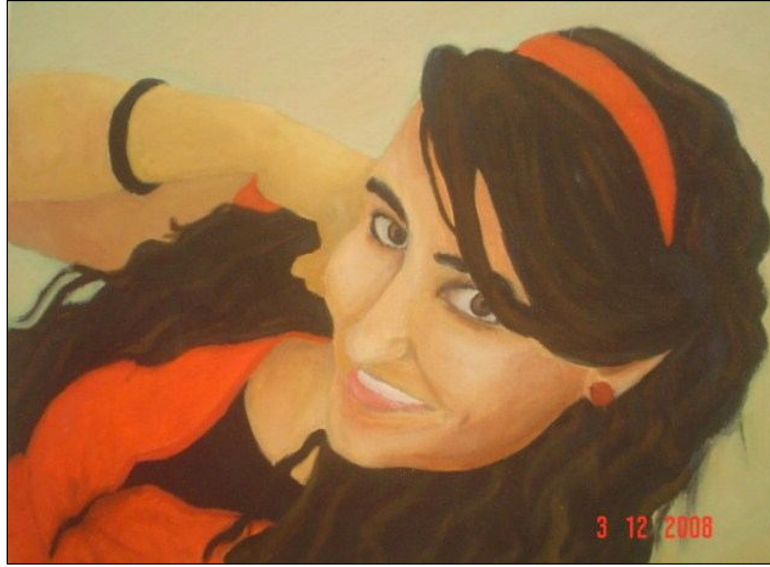
Resim 1- Öğrenci (A)'nın Çalışması

Öğrenci (A): Öğrencin Resim 1 'deki çalışması ve ilgili formdaki cevapları incelendiğinde, çalışmasını doğru bir ifade ile betimlediği görülmüştür. Cevaplarından yapmış olduğu çalışmanın “oto portre” olduğu, tuval üzerine yağlı boyayla çalıştığı, ayrıca palet, fırça, tiner, boya gibi malzemeler de kullandığı anlaşılmaktadır.