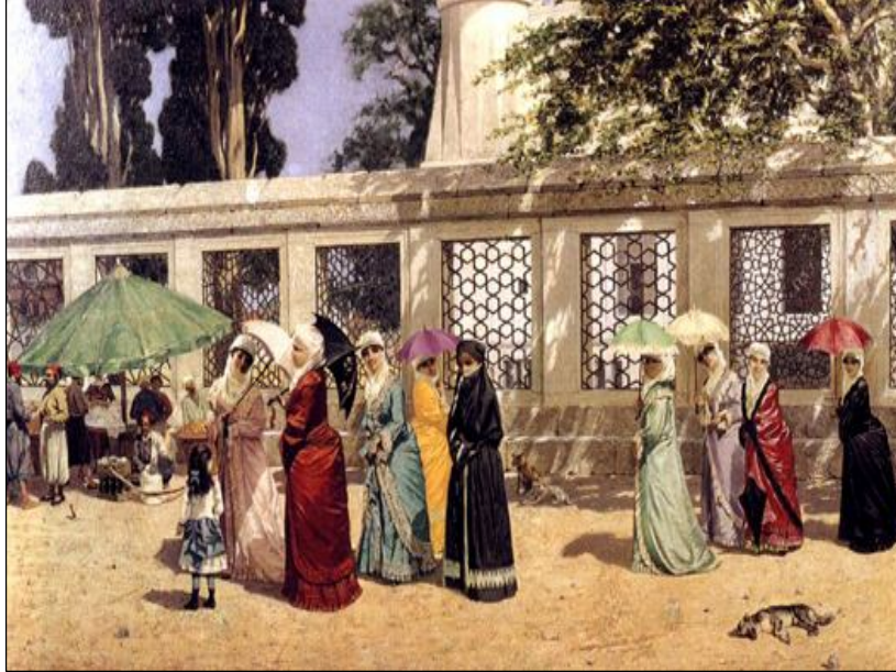
Resim 3- Osman Hamdi, "Gezintide Kadınlar"