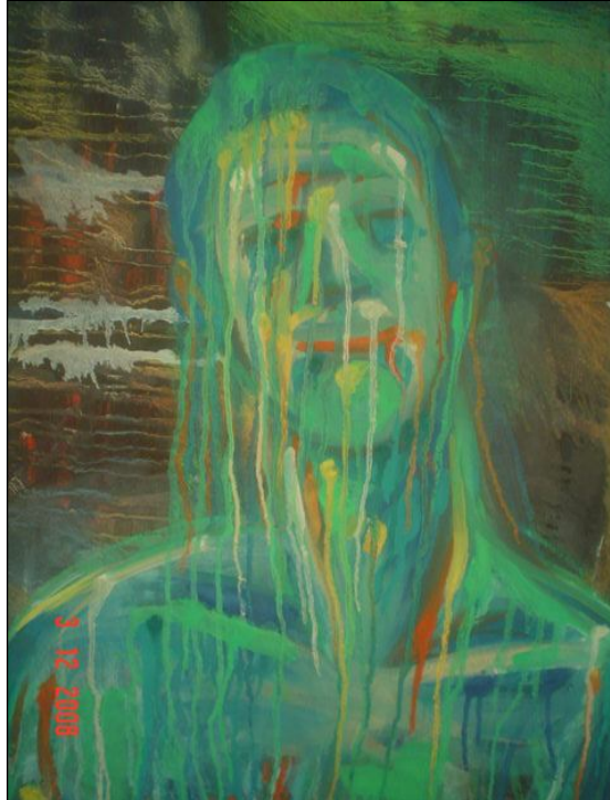
Resim 2- Öğrenci (B)’nin Çalışması

Öğrenci (B): Öğrencinin Resim 2 ’deki çalışması ve ilgili formdaki cevapları incelendiğinde; tanımlama aşamasında öğrenci resminin tuval üzerine yağlı boyayla yapılmış