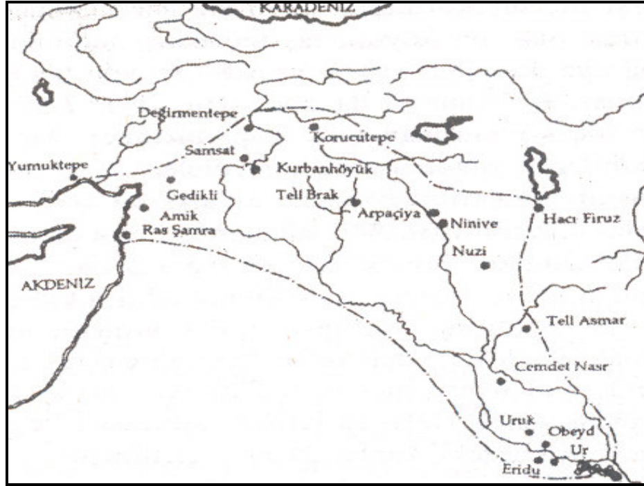
Harita 2: Ubayd Kültürünün Yayılım Alanı (Veli Sevin, Anadolu Arkeolojisi , İstanbul, 2003, s.96)