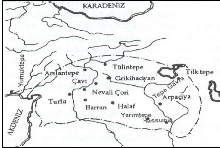
Harita 1: Halaf Kültürünün Yayılım Alanı (Veli Sevin, Anadolu Arkeolojisi , İstanbul, 2003, s.89)