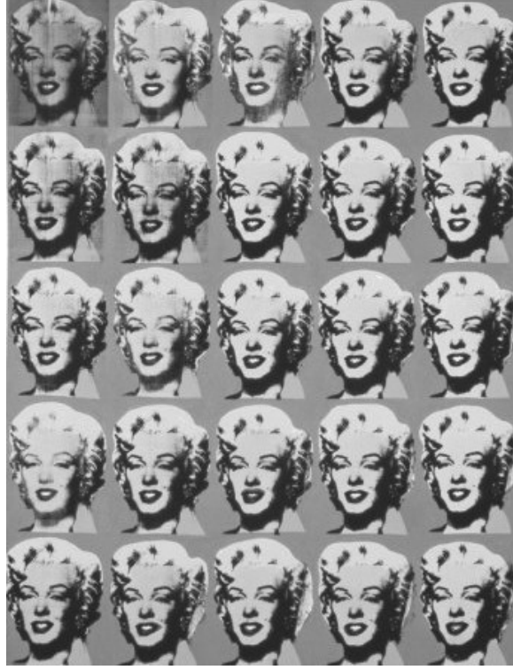
Andy Warhol, Yirmibeş- Renkli Marilyn, Tuval Üzerine Akrilik, 1962, 209x170 cm, Fort Worth Modern Sanat Müzesi.