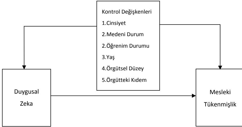
řekil 2. Arařtırma Deđiřkenleri

Bu çalıřma ile iřletme yöneticilerinin yařadıkları tükendişlik ile duygusal zeka olgusu arasındaki iliřkiyi incelemek amaçlanmıştır. Bunun yanı sıra, tükendişlik ve duygusal zeka arasındaki iliřki bazı demografik deđiřkenler ađısından da incelenmiştir.