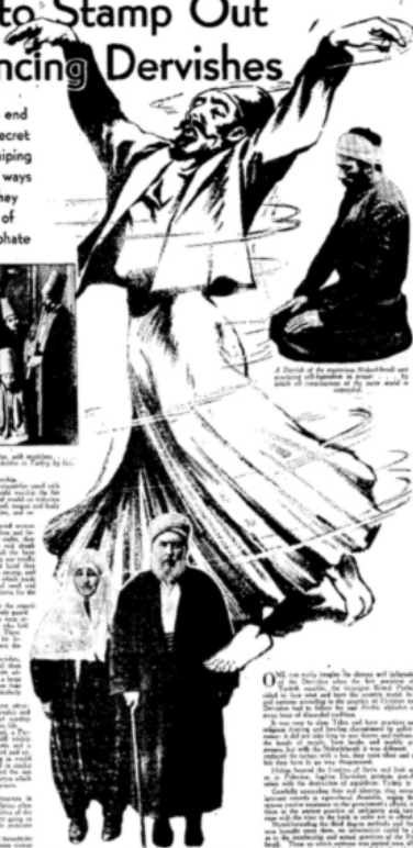
A Dervish of the sect known as the Whirling Dervishes, with several other members of the sect in the foreground.

They are a sect of fanatics who practice a form of self-hypnotism and fire-worshiping. They are now being persecuted by the new Turkish republic, though they work for its overthrow and the return of the old rule of the Mohammedan caliphate.