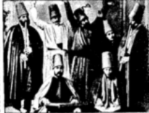
A group of dancing Dervishes in their ceremonial robes, with one in the center performing a ritual.

T HE DANCING DERVISHES, known as the Whirling Dervishes, are a sect of fanatics who practice a form of self-hypnotism and fire-worshiping. They are now being persecuted by the new Turkish republic, though they work for its overthrow and the return of the old rule of the Mohammedan caliphate.