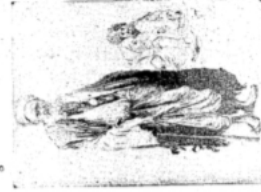
A Hindu deity. Author by W. S. Robinson.

THE HINDU GODS ARE, in the opinion of the author of this article, the most powerful and most numerous of the gods of the world. They are the most powerful because they are the most numerous, and they are the most numerous because they are the most powerful. They are the most powerful because they are the most numerous, and they are the most numerous because they are the most powerful.