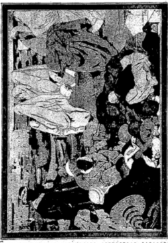
The Hindu deity. Author by W. S. Robinson.

THE HINDU GODS ARE, in the opinion of the author of this article, the most powerful and most numerous of the gods of the world. They are the most powerful because they are the most numerous, and they are the most numerous because they are the most powerful. They are the most powerful because they are the most numerous, and they are the most numerous because they are the most powerful.