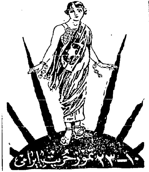
Resim 4- Cumhuriyet , 23 Temmuz 1928, NO:1510

Resim 4'te ise yine alt fonda "10-23 Temmuz Hürriyet Bayramı" ibaresi yer almakta, güneşle birlikte doğan Türk milletini temsil eden bir kadın resmedilmiştir. Bu kadının da ellerindeki zincirin kırık, ayaklarındakilerin ise hala bağlı olduğu görülmektedir. Buradan şu mesaj verilmektedir: Meşrutiyet Türk milletine kısmi hürriyet vermiştir.