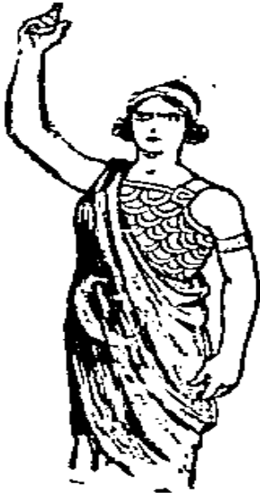
Resim 12- Cumhuriyet , 23 Temmuz 1935, No:4018

Resim 11’de, elindeki meşale ile milleti aydınlatmaya geleceğe daha hür bakmaya yönelten Meşrutiyet sembolize edilmiştir.