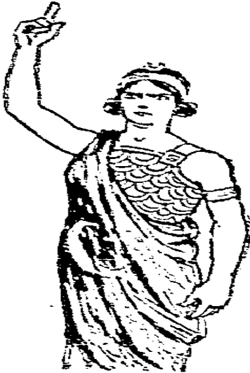
Resim 9- Cumhuriyet , 23 Temmuz 1933, No: 3308

Resim 8’de ise bu defa, Türklük ve İslam’ın sembolü olan ay-yıldız içerisinde zincirlerini kırmayı başaran kuvvetli yetişkin bir erkek figürüyle Meşrutiyet sembolize edilmiştir.