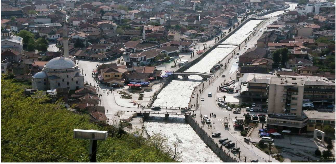
Fotoğraf 2: Prizren Kalesi'nden Sinan Paşa Camii ve Bistritsa Nehri

Prizren Sancağı doğuda Tuna nehri, kuzeyde Sırbistan ve Bosna, batıda Karadağ ve İşkodra, güneyde Yanya ve Selanik Vilayetleri'yle sınırları olan takriben 19.900 kilometrekarelik bir mahalden ibaretti. 1 Şehir, Beli Drim'in bir kolu olan küçük Bistritsa akarsuyunun Duvska Klisura boğazından ovaya açıldığı yerde verimli Metohiya ovasının güney kenarında bulunmaktadır. Prizren, Şar dağlarının kuzey yamaçları ile kısmen ova üzerinde kurulmuştur. Bursa ve Manisa gibi yamaçta kurulması bakımından diğer Osmanlı şehirlerine benzer. Nüfus bakımından Edirne ve Selanik'ten sonra Balkanların en büyük üçüncü şehri olan Prizren'in ismi bazı Osmanlı kaynaklarında ve kitabelerde değişik şekillerde kaydedildiği görülmektedir. 2 Bunlar arasında en yaygın kullanılanları: Prizdriyan, Prizdriyana, Prizrendi, Porzerin, Perserin, Prizrin, Prezrin, Perserin Pürzeyn, Perzerrin, Prisren, Pürzen, Zerrin, Prisrend, Prisrendi, Perzerin'dir. Tüm bu adların anlamında " altından yapılmış, altın gibi parlak ve zenginlik dolu şehir " anlamının çıktığını vurgulamak gerekir. 3