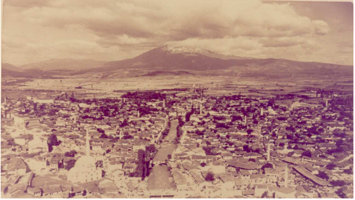
Fotoğraf 1: Koritnik Dağı ve Bistrica Nehri

Prizren, XVII. yüzyılın son çeyreğindeki Osmanlı-Avusturya Savaşları sırasında büyük bir sarsıntı ve yıkım yaşamıştır. Şehir, bu sarsıntıdan ancak XVIII. yüzyılın ikinci yarısının sonlarında kurtulmuş ve XIX. yüzyılda eski ihtişamına kavuşmuştur. Bu dönemde ticaret ve zanaat bir hayli gelişmiştir. Ancak Berlin Kongresi sonrasında başlayan huzursuzluk Balkan Savaşları'na kadar devam etmiştir. Arnavutlar kendi iskân bölgelerinin Sırbistan, Yunanistan ve Karadağ'a verilmesini kabul etmeyerek Prizren'de İttihat Cemiyeti'ni kurmuşlardır. Cemiyet, kuruluş amacından saparak daha sonra Arnavut ulusçuluğunun lokomotifine haline gelerek Arnavutlar arasında güç kazanmıştır. Hâlbuki başlangıçta cemiyetin ulusçu bir hareket noktasından yola çıkmadığı aksine Osmanlı Devleti'nden ayrılmak gibi bir niyetle kurulmadığı bilinmektedir. İngiltere, Rusya, Avusturya-Macaristan ve İtalya gibi büyük devletler, bu dönemde olayları yakından takip etmek için Prizren'de konsolosluklar açmışlardır. Neticede Prizren İttihat Cemiyeti'nin, 1913'te kurulacak olan Arnavut Devleti'nin çekirdeğini oluşturmuştur. Zaten Balkan Savaşları sonunda 31 Ekim 1912'de de şehir Sırp kontrolüne geçmiş ve Prizren'deki Osmanlı idaresi de sona ermiştir.