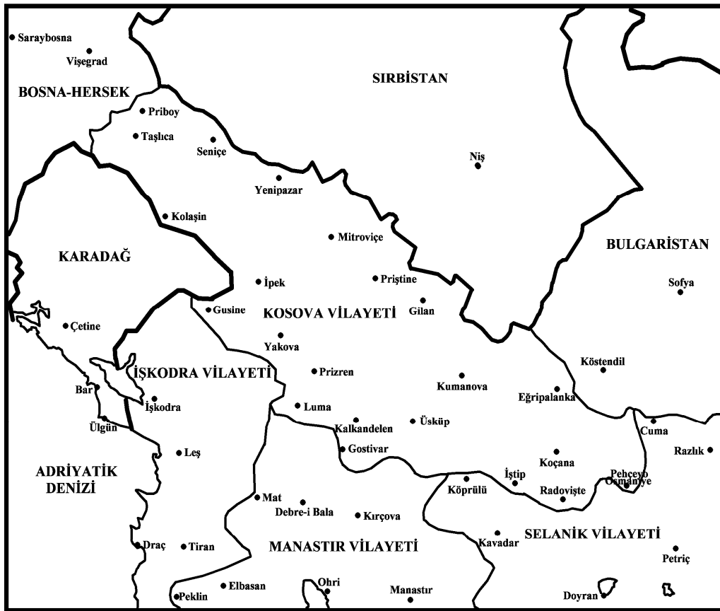
Harita 2: Kosova Vilayeti Mülkî Haritası (Osmanlı Arşiv Belgelerine Göre Kosova Vilayeti Kitabı'ndan)

başlanmıştır. Gazete, Türkçe ve Sırpça olmak üzere iki dilde yayınlanmıştır. Daha sonra vilayet merkezi mevcut şartlar değerlendirilerek kısa bir süre sonra Priştine'ye taşınmıştır. Dolayısıyla vilayet merkezinde yapılan değişiklikler bazı araştırmacılar tarafından yanlış algılanarak Kosova ve Prizren Vilayetleri'nin birbirine karıştırılmasına sebep olmuştur. Hâlbuki Kosova Vilayeti'nin kuruluşu daha sonraya denk gelmektedir. Özellikle Balkanlar'daki toprak kayıplarının artmasıyla eldeki mevcut mülkî yapı dikkate alınarak yeniden düzenlemeler yapmak mecburiyetini doğurmuştu.