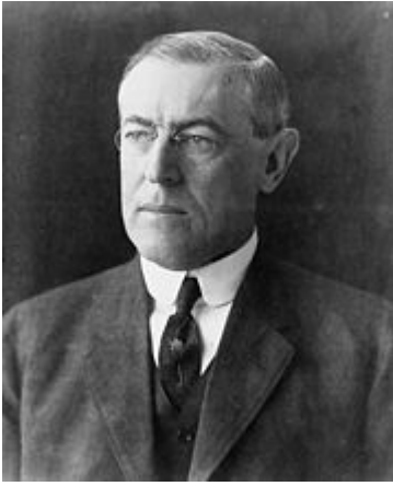
Thomas Woodrow Willson (1856-1924)

Manda, yönetim biçimi olarak tartışmaların başladığı 1919 yılına kadar uluslararası diplomaside ve literatürde kullanılmayan bir terimdi. Manda yönetimi, sömürge yönetimlerinden farklı bir tanım olarak ilk defa Güney Afrikalı General Jean Christian Smuts tarafından ortaya atıldı. Smuts, bu konu ile ilgili önerisini bir teklif olarak konferansın toplanması öncesi 16 Aralık 1918'te komisyona sundu. 2