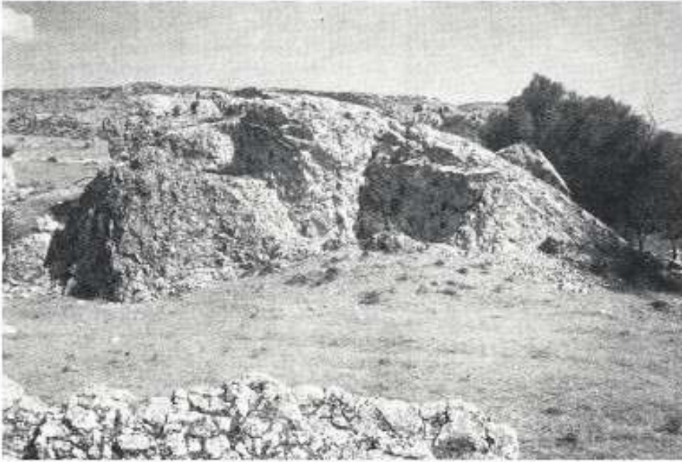
Figür 1: Osmankayası Mezarlığı (Kaynak: Seeher, 1993a: abb. 20).

Anadolu'da M.Ö. II. bine ait münferit halde ele geçen bazı örnekler hariç, kremasyon mezarlarının genellikle inhumasyon mezarlarıyla bir arada bulunduğu ve inhumasyon mezarlarının kremasyon mezarlarına göre daha yoğun olduğu dikkati çekmektedir. K. Bittel, Osmankayası Mezarlığı'nda olduğu gibi (Figür 1) aynı alanda iki farklı gömme geleneğinin görülüyor olmasını, öteki dünya inançları farklı olan iki topluluğun aynı mezarlık alanını kullanıyor olması ile açıklamaktadır (Bittel ve diğ., 1958: 24).