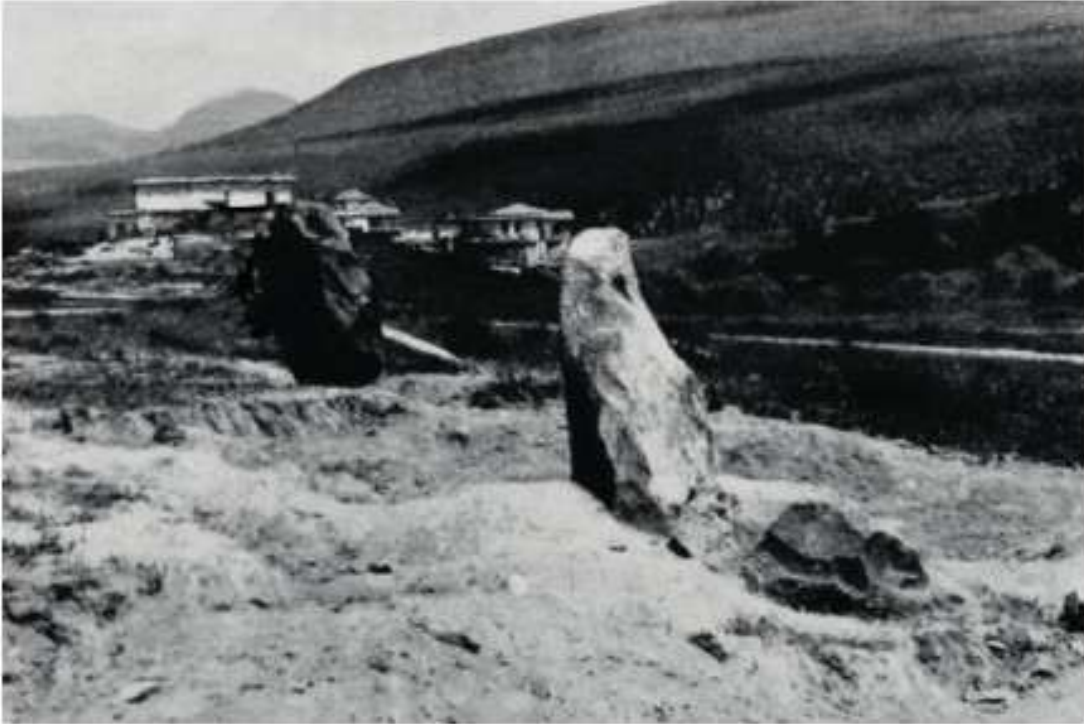
Figür 4: Ilica Mezarlığı ve dikili taşlar.

Mezarların etrafında çeşitli düzenlemelerin ve bazı dikkat çekici hususların olduğu görülmektedir. Özellikle, Ilica Mezarlığı'nda bulunan ve mezarların yerini işaret ettiği Orthmann tarafından belirtilen dikili taşların/stellerin (Figür 4) varlığı, diğer mezarlıklarda görülmeyen ayırt edici bir özelliktir (Orthmann, 1967: 7). Orthmann'a göre bu dikili taşların bir aile mezarını da temsil etme ihtimali yüksektir (Orthmann, 1967: 38). H. Müller-Karpe, Ilica Mezarlığı'nda urnelerin etrafında bulunan dikili taşların-stellerin ölü kültü ile ilişkilendirilmesi kanaatindedir (Müller-Karpe, 1980: 680). Akyurt ise, bunların aile mezarları olup olmadığının anlaşılmasının zor olduğunu ve söz konusu stellerin ölüyü mezarı başında anabilmek, en azından mezarın bulunmasını kolaylaştırmak amacıyla mezarlık alanına konmuş olabileceği üzerinde durmaktadır (Akyurt, 1998: 46, 155).