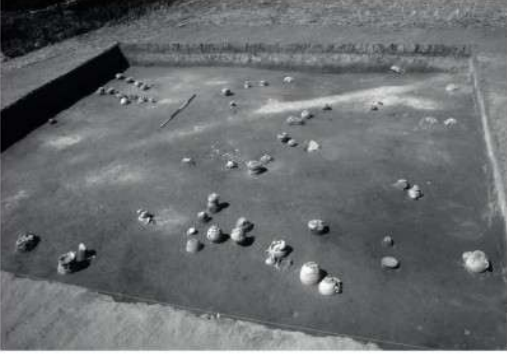
Figür 5: Arıbaş Mezarlığı.

Arıbaş Mezarlığı'nda mezarların dağılımlarına bakıldığında birçoğunun belirli gruplar halinde dizildiği görülmektedir (Figür 5). Öztan'a göre, grup halinde bulunan ve genellikle kuzeydoğu-güneybatı yönünde dizilmiş kremasyon mezarlar aile mezarlıklarını simgeliyor olabilirler (Öztan, 1998: 169).