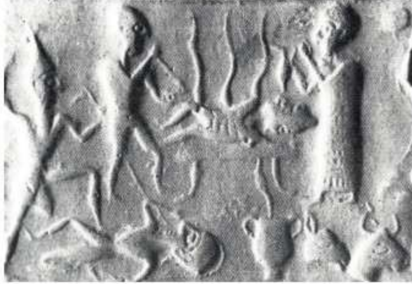
Figür 6: Tyskiewicz mührünün baskısı. (Kaynak: Akyurt, 1998: Lev. 47-b).

mitolojik bir sahnenin işlendiğini ve eğer bu sahne bir yakma töreni ise bu konuda Anadolu'da bilinen en eski ve tek tasvirin bu eser olduğunu belirtmektedir (Akyurt, 1998: 153-154). S. Alp de yakma töreni olarak değerlendirdiği bu mühürdeki sahnede, ölünün ayakucunda bulunan kişinin elinde tuttuğu ok ucuna benzer nesnenin körük olabileceğini belirtmiştir (Alp, 1999: 44-45).