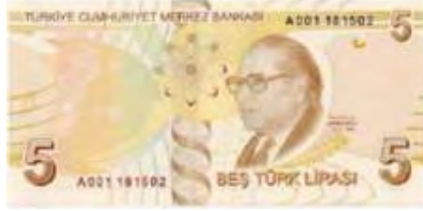
Resim-34: Dokuzuncu Emisyon Beş Türk lirasının Arka Yüzü