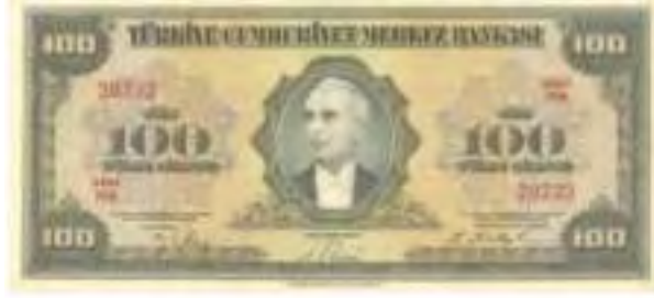
Resim-15: Dördüncü Emisyon Yüz Liranın Ön Yüzü