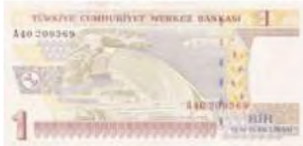
Resim-30: Sekizinci Emisyon Bir Yeni Türk Lirasının Arka Yüzü