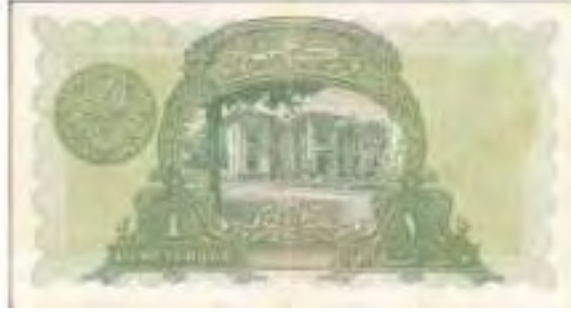
Resim-2: Birinci Emisyon Bir Liranın Arka Yüzü