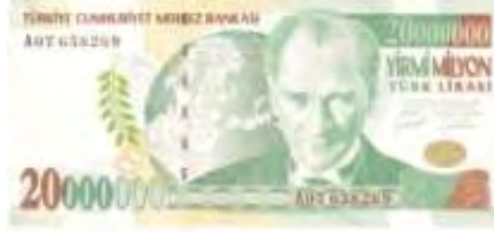
Resim-27: Yedinci Emisyon Yirmi Milyon Liranın Ön Yüzü