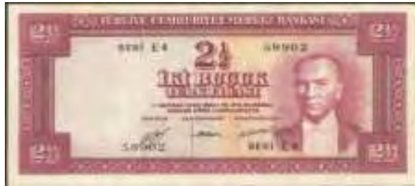
Resim-17: Beşinci Emisyon İki Buçuk Liranın Ön Yüzü