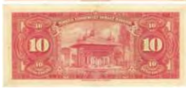
Resim-14: Dördüncü Emisyon On Liranın Arka Yüzü