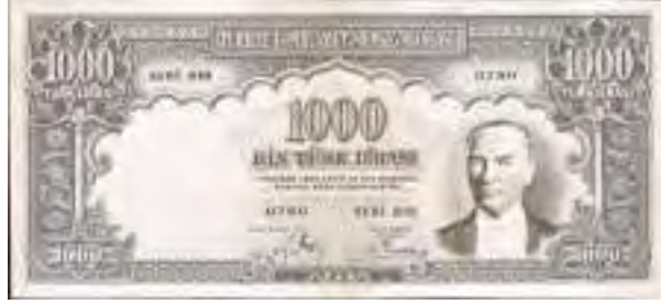
Resim-7: İkinci Emisyon Bin Liranın Ön Yüzü