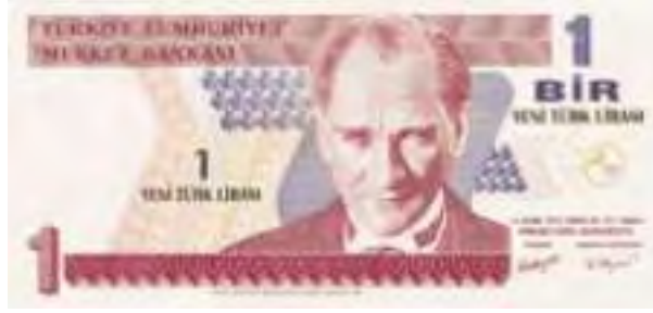
Resim-29: Sekizinci Emisyon Bir Yeni Türk Lirasının Ön Yüzü