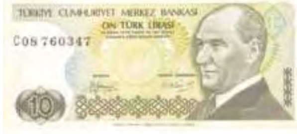
Resim -25: Yedinci Emisyon On Liranın Ön Yüzü