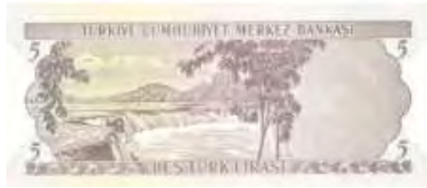
Resim-22: Altıncı Emisyon Beş Liranın Arka Yüzü