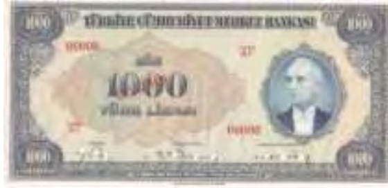
Resim-11: Üçüncü Emisyon Bin Liranın Ön Yüzü