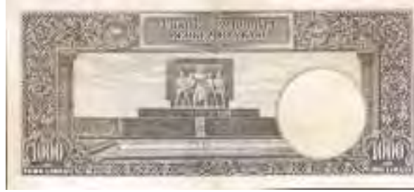
Resim-8: İkinci Emisyon Bin Liranın Arka Yüzü