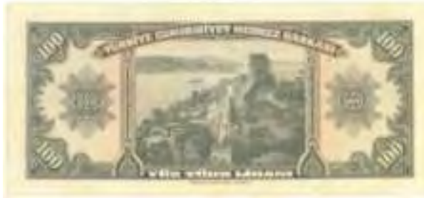
Resim-16: Dördüncü Emisyon Yüz Liranın Arka Yüzü