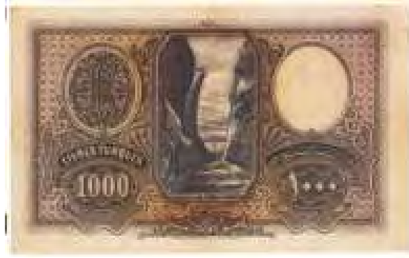
Resim-4: Birinci Emisyon Bin Liranın Arka Yüzü