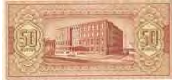
Resim-6: İkinci Emisyon Elli Kuruşun Arka Yüzü