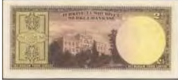
Resim-10: Üçüncü Emisyon İki Buçuk Liranın Arka Yüzü