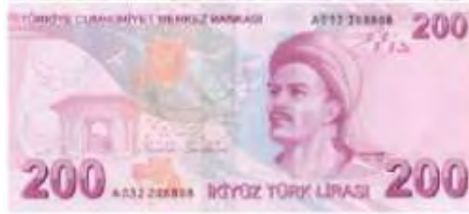
Resim-36: Dokuzuncu Emisyon İki Yüz Türk Lirasının Ön Yüzü