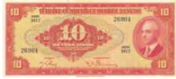
Resim-13: Dördüncü Emisyon On Liranın Ön Yüzü