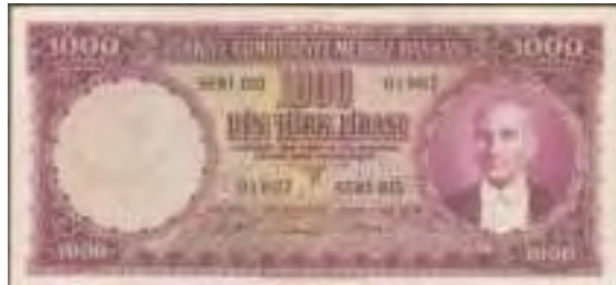
Resim-19: Beşinci Emisyon Bin Liranın Ön Yüzü