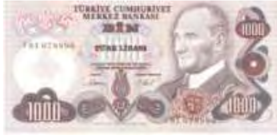
Resim-23: Altıncı Emisyon Bin liranın Ön Yüzü