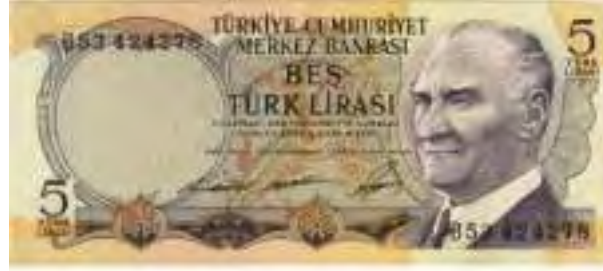
Resim-21: Altıncı Emisyon Beş Liranın Ön Yüzü