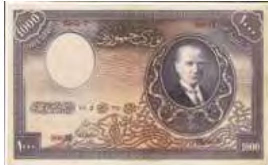
Resim-3: Birinci Emisyon Bin Liranın Ön Yüzü