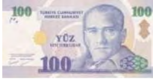
Resim-31: Sekizinci Emisyon Yüz Yeni Türk Lirasının Ön Yüzü