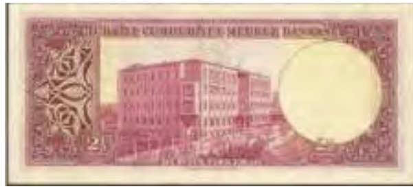
Resim-18: Beşinci Emisyon İki Buçuk Liranın Arka Yüzü