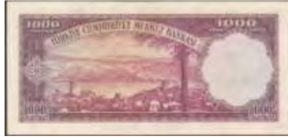
Resim-20: Beşinci Emisyon Bin Liranın Arka Yüzü