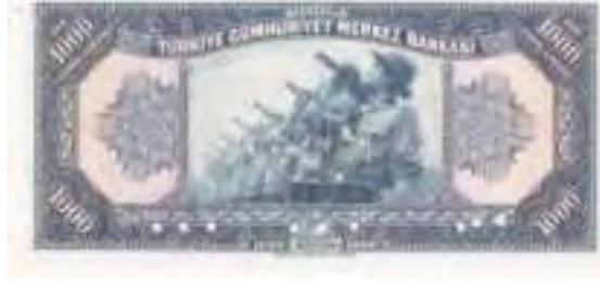
Resim-12 Üçüncü Emisyon Bin Liranın Arka Yüzü