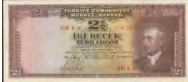
Resim-9: Üçüncü Emisyon İki Buçuk Liranın Ön Yüzü