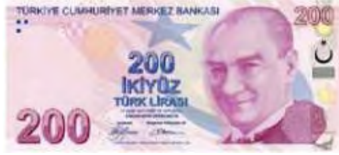
Resim-35: Dokuzuncu Emisyon İki Yüz Türk lirasının Ön Yüzü