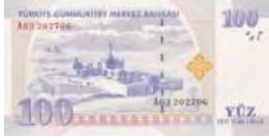
Resim-32: Sekizinci Emisyon Yüz Yeni Türk Lirasının Arka Yüzü