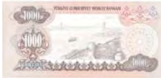
Resim-24: Altıncı Emisyon Bin liranın Arka Yüzü