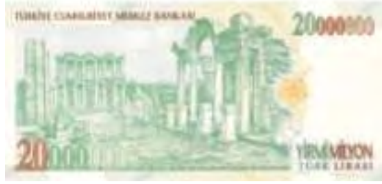
Resim-28: Yedinci Emisyon Yirmi Milyon Liranın Arka Yüzü