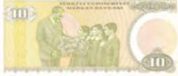
Resim -26: Yedinci Emisyon On Liranın Arka Yüzü