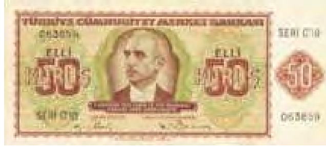
Resim-5: İkinci Emisyon Elli Kuruşun Ön Yüzü