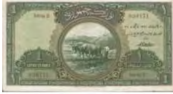
Resim-1: Birinci Emisyon Bir Liranın Ön Yüzü