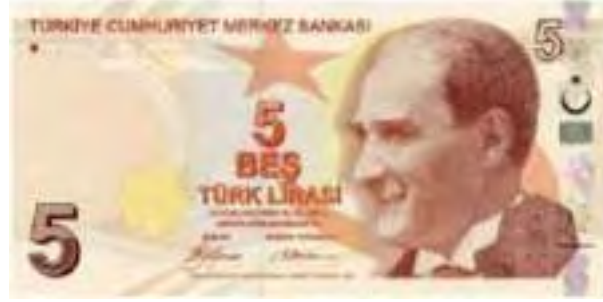
Resim-33: Dokuzuncu Emisyon beş Türk lirasının Ön Yüzü