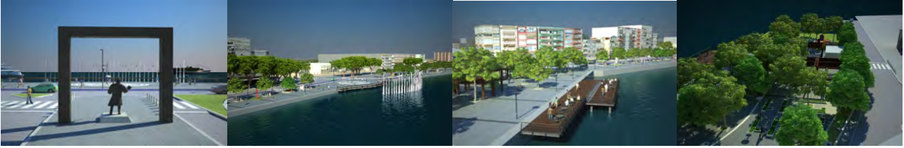
Şekil 5. Atatürk Meydanı (Çanakkale Belediyesi, 2011).

Atatürk Meydanı: “Çanakkale Kordonboyu Çevre Düzenlemesi ve Kentsel Tasarım Projesi”nin dördüncü ve son bölümü olan Atatürk Meydanı; Kayserili Ahmet Paşa Caddesi ile Balıkesir Caddesi’nin kesiştiği noktada bulunmaktadır. Bu alandaki en dikkat çekici unsur Atatürk Heykeli’nin yer aldığı küçük bir meydandır. Burası aynı zamandaki denizdeki fiskiyeli alanın da tam karşısına denk gelmektedir. Projede planlanan fakat henüz yapımına başlanmamış olan fiskiyeler ise ahşap seyir iskeleleri ile birlikte bu alandaki diğer dikkat çekici unsurlardır. Yine bu alanda da oturma bankları yer almakta, bisiklet ve yürüyüş yolları devam etmektedir. Alanın son kısmında bulunan Golf Çay Bahçesi ise proje kapsamındaki en önemli oturma mekânlarından biri olup, yan tarafındaki çocuk bahçesi ve çevresindeki donatı elemanları ile birlikte yeniden düzenlenip halkın kullanımına açılmıştır (Şekil 5).