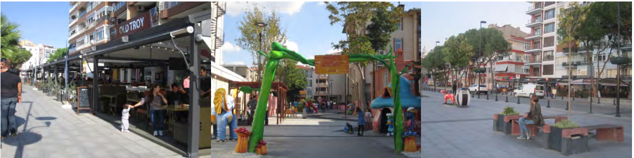
Şekil 14. Kafeler-Çocuk Sokağı-Bitki Kasası Bitkisel Tasarımı (Orijinal, 2012).

Bu alandaki en önemli noktalardan birisi de alandaki yeme-içme ve dinlenme merkezleri olarak tanımlanabilecek kafelerin bulunduğu güzergâhtır. Bu alanlar son derece estetik bir görünüme kavuşturulmuş olmalarının yanı sıra kıyıda oldukça uzakta olmaları sebebiyle kıyıya yakın olarak farklı oturma alanı düzenlemelerine ihtiyaç bulunmaktadır. Bu alanda yapılan “Çocuk Sokağı” özellikle alandaki çocuk oyun alanı eksikliği/yetersizliği düşünüldüğünde önemli oranda bir kullanıcı grubunun ihtiyacını karşılamaktadır. Alandaki diğer uygulamalara bakıldığında; yine bitkisel materyal (bitki kasalarının durumu, bitkisel gölgeleme elemanının yetersiz olması, vb.) olarak çok büyük eksiklikler göze çarpmakla birlikte çöp kutusu oturma bankı gibi donatı elemanlarının proje geneliyle uyumlu ve yeterli düzeyde olduğu görülmektedir (Şekil 14).