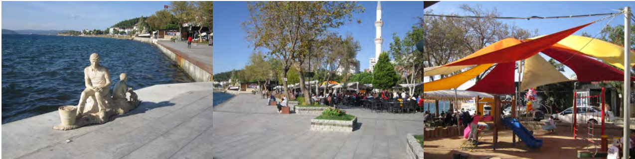
Şekil 16. Golf Çay Bahçesi ve Çevresi-Çocuk Oyun Alanı (Orijinal, 2012).

Bu alandaki en önemli oturma-dinlenme mekânı olan Golf Çay Bahçesi bitişiğindeki çocuk oyun alanı ile birlikte alandaki oyun alanı eksikliğini büyük ölçüde gidermektedir. Burası da daha önceden var olan ve yoğun olarak kullanılan bir alan olmanın yanı sıra, proje bütünü içerisinde yeniden revize edilerek kullanıma açılmıştır. Alanda özgün plastik objelerin yanı sıra oturma bankı, bitki kasası, çöp kutusu gibi çeşitli donatı elemanlarına da yeterli düzeyde yer verilmiştir. Burada dikkati çeken en önemli tasarım eksikliği/yanlışı çay bahçesi ve çocuk oyun alanındaki gölgeleme elemanlarının ahşap malzeme yerine plastik malzemeden yapılmış olmasıdır (Şekil 16).