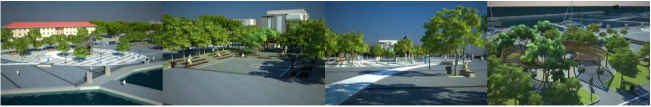
Şekil 3. Morabbin Parkı ve Truva Meydanı (Çanakkale Belediyesi, 2011).

Morabbin Parkı ve Truva Meydanı: “Çanakkale Kordonboyu Çevre Düzenlemesi ve Kentsel Tasarım Projesi”nin ikinci bölümü olan Morabbin Parkı ve Truva Meydanı; projenin önemli alanlarından olmakla birlikte alanın odak noktası olması sebebiyle de özel bir önem taşımaktadır. Bu alanda dikkati çeken unsurlar; Truva Atı, güneş saati, Troia Kenti Maketi gibi Çanakkale’yi temsil eden simgesel objelerdir. Kentin odak noktası olan bu mekânda, aynı zamanda kent tarihine ilişkin bilgi veren ve önceden de bu alanda bulunan söz konusu objeler proje kapsamında korunmuş ve geliştirilmiştir. Truva Atı ve çevresi bir meydan olarak düzenlenmiş ve kullanıma açılmıştır. Bunun yanı sıra Morabbin Parkı'nın küçük bir spor alanı olarak düzenlemesi yapılmış ve parkın yanında daha önceleri el işi ve takı tezgâhları bulunan alan yine aynı işlevde kullanılmak üzere revize edilmiştir (Şekil 3). Bunun yanı sıra alanda yürüyüş yolları ve bisiklet yolu düzenlemeleri yapılmıştır.