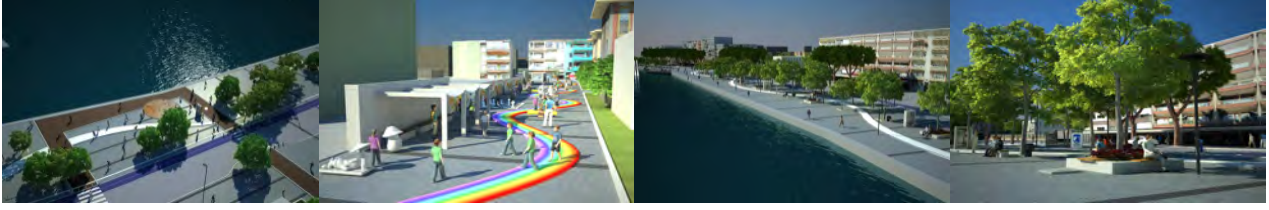
Şekil 4. Piri Reis Meydanı ve Çocuk Sokağı (Çanakkale Belediyesi, 2011).

Atatürk Meydanı: “Çanakkale Kordonboyu Çevre Düzenlemesi ve Kentsel Tasarım Projesi”nin dördüncü ve son bölümü olan Atatürk Meydanı; Kayserili Ahmet Paşa Caddesi ile Balıkesir Caddesi’nin kesiştiği noktada bulunmaktadır. Bu alandaki en dikkat çekici unsur Atatürk Heykeli’nin yer aldığı küçük bir meydandır. Burası aynı zamandaki denizdeki fiskiyeli alanın da tam karşısına denk gelmektedir. Projede planlanan fakat henüz yapımına başlanmamış olan fiskiyeler ise ahşap seyir iskeleleri ile birlikte bu alandaki diğer dikkat çekici unsurlardır. Yine bu alanda da oturma bankları yer almakta, bisiklet ve yürüyüş yolları devam etmektedir. Alanın son kısmında bulunan Golf Çay Bahçesi ise proje kapsamındaki en önemli oturma mekânlarından biri olup, yan tarafındaki çocuk bahçesi ve çevresindeki donatı elemanları ile birlikte yeniden düzenlenip halkın kullanımına açılmıştır (Şekil 5).