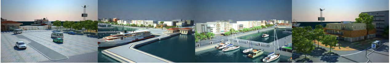
Şekil 2. İskele Meydanı (Çanakkale Belediyesi, 2011).

İskele Meydanı: Bu kapsamda öncelikle yapımına başlanan alan GESTAŞ Binası ve çevresidir. Burası özellikle kentin odak noktası olarak tanımlanabilecek önemli alanlardan biri ve geçiş noktası niteliğinde olduğu için; GESTAŞ Binası'nın proje kapsamında oldukça modern bir görünüme kavuşturulmasının yanı sıra fonksiyonel özellikte olması da hedeflenen ana unsurlardan birisi olmuştur. Bunun devamında marina alanı da revize edilerek yine kentin yeni görünümüne yakışır bir hale getirilmiştir. Yine bu alanda yer alan bankamatikler, hediyelik eşya dükkânları ve yeme-içme büfeleri de proje kapsamında kaldırılmış ve burasının yepyeni bir görünüme kavuşturulması için gereken çalışmalar başlatılmıştır. Bankamatikler yenilenirken, büfelerin ve dükkânların olduğu yerde ise “Çanakkale Evi” adıyla bir yaşam alanı yapılması planlanmıştır (Şekil 2).