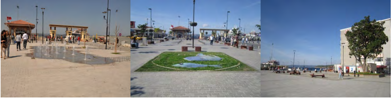
Şekil 9. İskele Meydanı’ndan Görünümler (Orijinal, 2012).