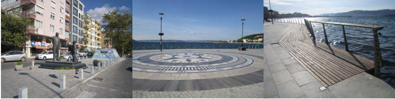
Şekil 15. Atatürk Heykeli-Atatürk Meydanı-Ahşap Seyir İskelesi (Orijinal, 2012).

“Çanakkale Kordonboyu Çevre Düzenlemesi ve Kentsel Tasarım Projesi”nin dördüncü ve son bölümü olan “Atatürk Meydanı”; yine gezinti, yürüyüş ve dinlenme mekânı olarak tasarlanan alanlardan bir tanesidir. Kayserili Ahmet Paşa Caddesi ile Balıkesir Caddesi'nin kesiştiği noktada küçük bir meydanın oluşturulduğu ve burada bir Atatürk Heykeli bulunan alan, farklı zemin malzemeleri ile yine bitkisel malzemeden yoksun sert zeminlerin ağırlıkta olduğu bir mekân olarak dikkati çekmektedir. Nitelikli oturma birimlerinin eksik olması alandaki dikkati çeken bir diğer unsurdur. Kıyıda bulunan ahşap seyir iskelesi farklı bir tasarım olmakla birlikte yapımındaki çeşitli eksik/yanlış uygulamalar nedeniyle yeterli düzeyde kullanılamamaktadır. Özellikle demir parmaklıklar ile ahşap zemin arasında bulunan boşluklar çocuklar için tehlikeli bir kullanım oluşturmaktadır (Şekil 15).