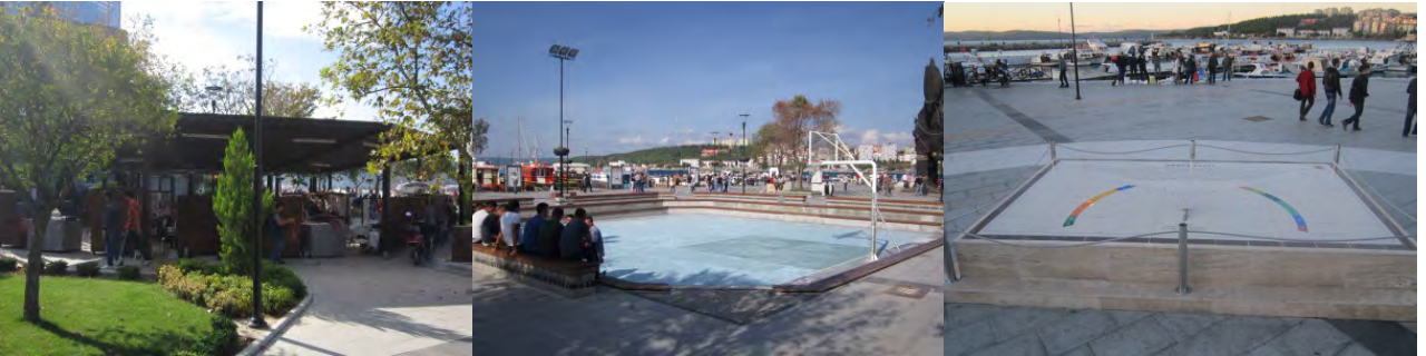
Şekil 12. Takı ve El İş Standları-Morabbin Parkı Mini Spor Alanı (Orijinal, 2012).

Bu alandaki takı ve el işi satış alanı olarak kullanılan kısım; yapısal gölgeleme elemanı eklenerek ve bitkisel tasarımında düzenlemeler yapılarak görsel açıdan daha modern bir görünümle halkın kullanımına açılmıştır. Morabbin Parkı'nın ise mini spor alanı olarak düzenlemesi yapılmış ve bu şekilde kullanımına devam edilmektedir. Fakat bu spor alanının çanak şeklinde olması, özellikle yağışlı havalarda alanın kullanımında çeşitli sorunlara yol açmaktadır. Yine bu alanda yer alan Güneş Saati ise; kentle özdeşleşmiş farklı bir tasarım olarak dikkati çekmektedir (Şekil 12).