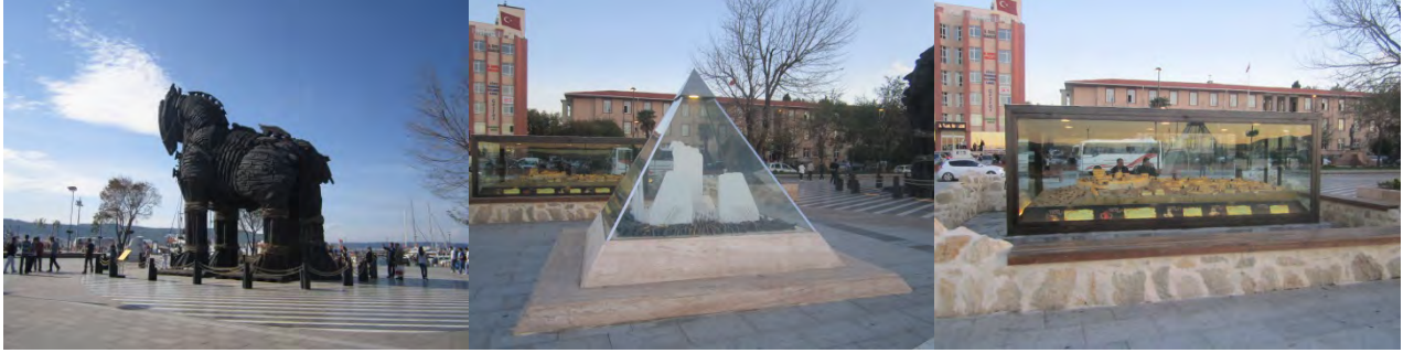
Şekil 11. Truva Meydanı ve Açık Hava Müzesi (Orijinal, 2012).

Projenin ikinci bölümü olan “Truva Meydanı ve Morabbin Parkı” ise estetik olmanın yanı sıra tanıtıcı yönüyle de kent kimliğine katkı sağlaması düşünülen çeşitli tasarımlar içermektedir. Kentin tarihi mirasına bir gönderme yapan Truva filminde kullanılan Truva Atı Maketi ile aynı zamanda tanıtıcı bilgilerin de yer aldığı Troia Savaşlarını anlatan açık hava müzesi bu meydanın en dikkat çekici unsurlarındandır. Fakat Çanakkale kentini tanıtan farklı objelere bu alanda yer verilmemiş olmaması da bir eksiklik olarak göze çarpmaktadır. Oysaki Çanakkale kenti tarihini simgeleyen çeşitli objelere bu mekânda yer verilmesinin; odak noktası olma özelliğini arttırmanın yanı sıra kentin tanıtımına da önemli ölçüde katkı sağlayan bir yaklaşım olacağı düşünülmektedir (Şekil 11).