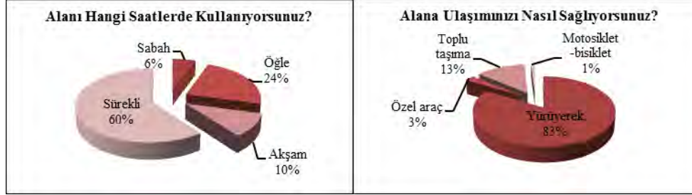
Şekil 7. Alanı Kullanma Saatleri-Alana Ulaşım.

Ankete katılanlara alanı hangi saatlerde kullandıkları sorulduğunda ise katılımcıların; % 6'sı sabah, % 24'ü öğlen, % 10'u akşam, % 60'ı ise alanı sürekli kullandığını belirtmiştir. Ankete katılanlara alana nasıl ulaştıkları sorulduğunda ise; %83'ü yürüyerek, %3'ü özel araç kullanarak, %13'ü toplu taşıma, %1'i motosiklet-bisiklet kullanarak alana ulaşımı sağladıklarını belirtmişlerdir (Şekil 7).