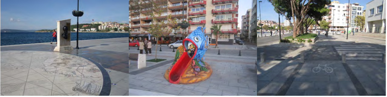
Şekil 13. Piri Reis Meydanı-Plastik Obje-Bisiklet Yolu (Orijinal, 2012).

Bu alanda görülen en büyük eksikliklerden biri ise; alanın son derece tekdüze bir görünümde olmasıdır. Alanda farklılık yaratmak adına yalnızca zeminde farklı döşeme malzemeleri kullanılmıştır. Alanın çok fazla sert zemin içeriyor olması ve herhangi bir su ögesi ve bitkisel alan ile desteklenmiş olmaması kullanıcıların da en fazla dikkatini çeken hatalı/eksik tasarımlardan biri olarak dikkati çekmektedir.