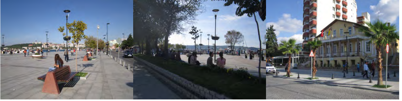
Şekil 10. Oturma elemanları-Bitkilendirme (Orijinal, 2012).

Projenin ikinci bölümü olan “Truva Meydanı ve Morabbin Parkı” ise estetik olmanın yanı sıra tanıtıcı yönüyle de kent kimliğine katkı sağlaması düşünülen çeşitli tasarımlar içermektedir. Kentin tarihi mirasına bir gönderme yapan Truva filminde kullanılan Truva Atı Maketi ile aynı zamanda tanıtıcı bilgilerin de yer aldığı Troia Savaşlarını anlatan açık hava müzesi bu meydanın en dikkat çekici unsurlarındandır. Fakat Çanakkale kentini tanıtan farklı objelere bu alanda yer verilmemiş olmaması da bir eksiklik olarak göze çarpmaktadır. Oysaki Çanakkale kenti tarihini simgeleyen çeşitli objelere bu mekânda yer verilmesinin; odak noktası olma özelliğini arttırmanın yanı sıra kentin tanıtımına da önemli ölçüde katkı sağlayan bir yaklaşım olacağı düşünülmektedir (Şekil 11).