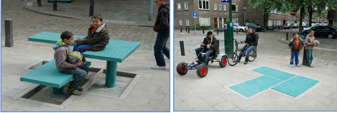
Şekil 11. Yer döşemesi görünümünde oturma elemanı tasarımı (URL-24, 2012).

Beğenide görsel algının önemi büyüktür. Elemanların birer tasarım ürünü olmaları kullanıcılar tarafından beğenilmelerine, daha bilinçli kullanılmalarına ve korunmalarına yardımcı olmaktadır. Bu nedenle kullanıcıların görsel algılarını kolaylaştıracak nitelikte donatıların tasarlanması oldukça önemlidir. Donatılar aracılığı ile kullanıcılara biçim, renk, doku, malzeme vb. öğeler ile belirli işaretler gönderilmektedir. Bu işaretlerin anlaşılabilirliği algılamayı kolaylaştırmaktadır (Şekil 11) (Öztürk, 1991).