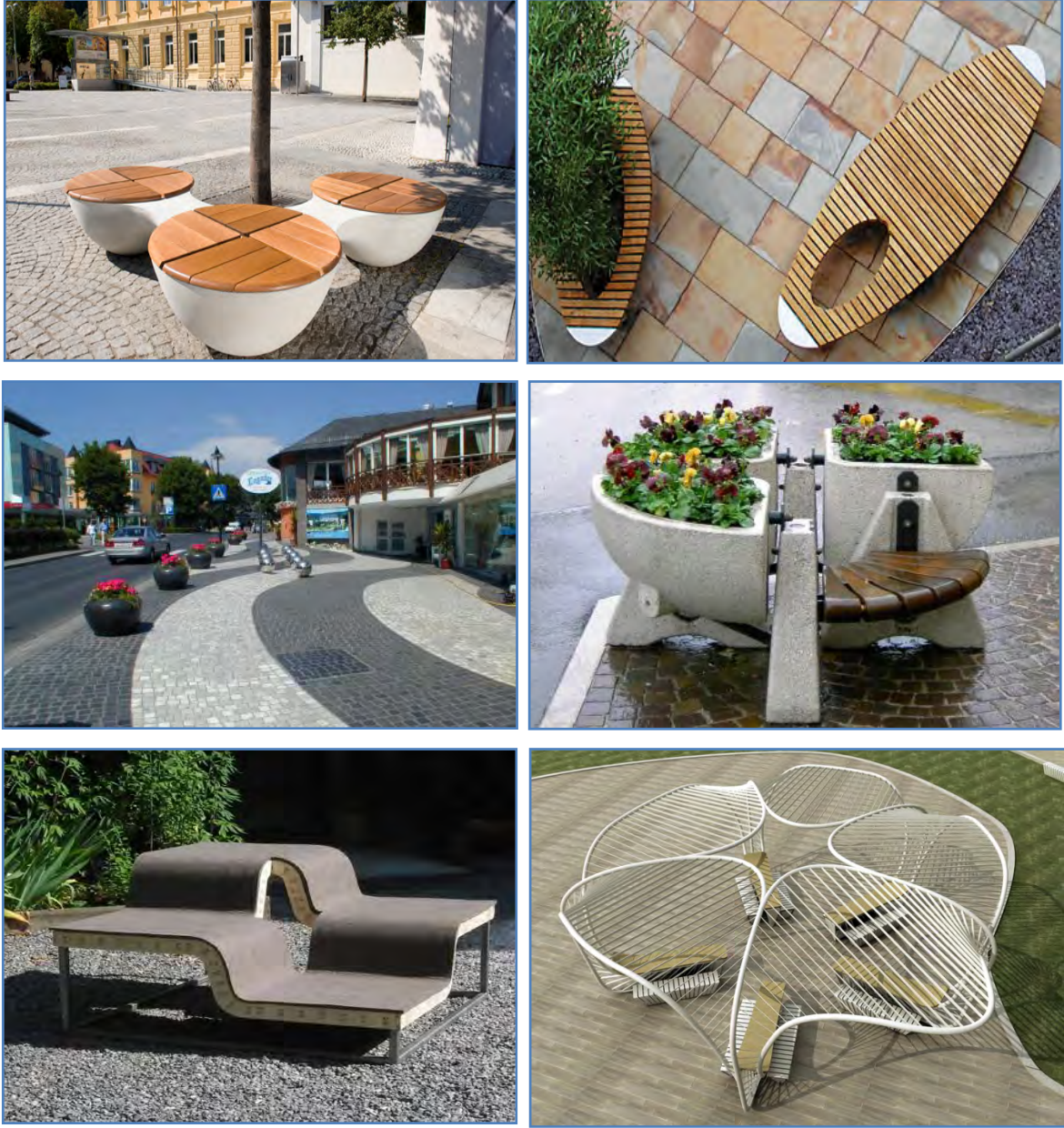
Şekil 3. Özgün geometrik biçimlerde tasarlanmış kent mobilyalarına örnekler (URL-4, 2012; URL-5, 2012; URL-6, 2012).