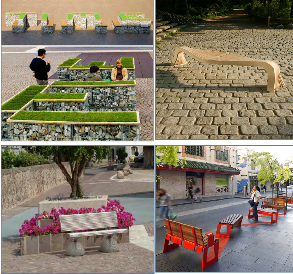
Şekil 4. Metal, ahşap, taş ve bitki vb. yapay ve doğal elemanların bir arada kullanıldığı kent mobilyalarına örnekler (URL-7, 2012; URL-8, 2012; URL-9, 2012).

Kent mobilyaları tasarımında kullanılan doğal ve yapay malzemeler insan psikolojisi üzerinde etkili olabilmektedirler. Örneğin doğal malzemelerden; ahşap, huzur ve dinlenme hissi verirken, seramik yaratıcılık ve hayal gücünü canlandırır, beton uyarır ve güvenlik hissi verir. Yapay malzemelerden plastik ise, bulunduğu ortama modernlik katar (Dascalu, 2011).