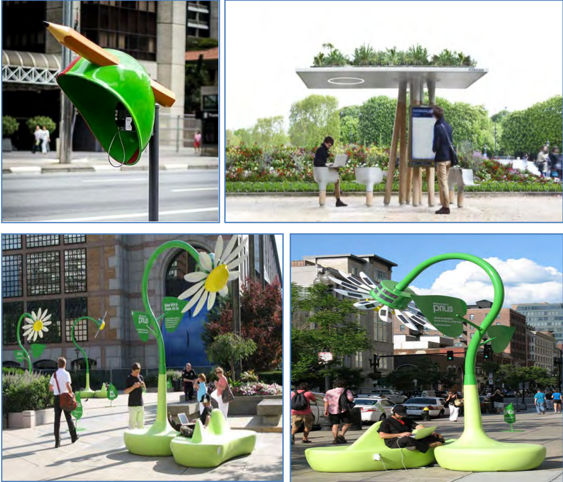
Şekil 10. Telefon kulübesi ve bilgisayar kullanımları için tasarlanan özgün ve yeni kent mobilyaları örnekleri (URL-21, 2012; URL-22, 2012; URL-23, 2012).

Gelişen teknoloji, yaşam koşullarını da değiştirmektedir. Cep telefonlarının yaygınlaşmadığı dönemlerde, kentsel açık alanlarda yer alan ve iletişim amaçlı kullanılan telefon kulübe­lerinin yerini, günümüzde bilgisayar ve internet kullanımları için tasarlanan yeni kent mobilyaları almaktadır (Şekil 10).