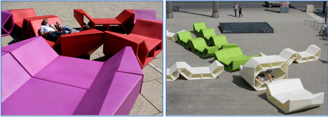
Şekil 6. Biçim, malzeme, renk ve dokusal özelliklerin özgünlük yaratmada etkili olabileceğini gösteren oturma elemanlarına örnekler (URL-12, 2012).

Tasarımların biçimlerinin yanı sıra yüzeylerini değiştiren dokuları vardır. Nesnelerin algılanışı elle yoklayarak veya ışık etkisi yoluyla olur. Elle dokunarak o nesnenin dokusal olarak algılanan dokusu algılanmaktadır. Dokunun göz yoluyla zihinde bıraktığı etki ise nesnelerin görsel dokusudur. Nitekim ıslak, kuru, pürüzlü veya düzgün cilalı gibi değişik dokusal özellikler tasarıma farklı değerler katabilmektedir (Şekil 6, Şekil 7) (Ertaş, 2007).