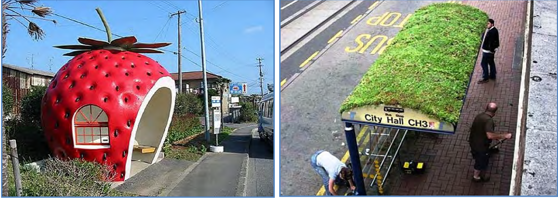
Şekil 9. Özgün otobüs durakları tasarımları (URL-20, 2012).

Gelişen teknoloji, yaşam koşullarını da değiştirmektedir. Cep telefonlarının yaygınlaşmadığı dönemlerde, kentsel açık alanlarda yer alan ve iletişim amaçlı kullanılan telefon kulübe­lerinin yerini, günümüzde bilgisayar ve internet kullanımları için tasarlanan yeni kent mobilyaları almaktadır (Şekil 10).