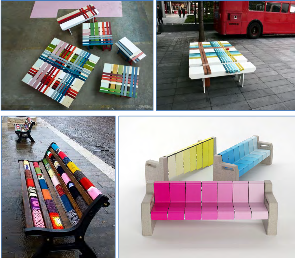
Şekil 5. Yatay ve düşey formda çeşitli renkler kullanılarak tasarlanan oturma elemanlarına örnekler (URL-10, 2012; URL-11, 2012).

Görsel algılamayı etkileyen en önemli faktörlerden bir diğeri de renktir. Estetik amaçlara hizmet eden, mekânın niteliğini belirleyen ve algılama sisteminin bir parçası olan renk, kentsel mekânlarda yapılan düzenlemelerde, malzemeyi, tasarımı, kullanılan donatı elemanlarını ortaya çıkararak mekâna ayrı bir derinlik ve boyut katmaktadır (Şekil 5) (Kıran, 1986).