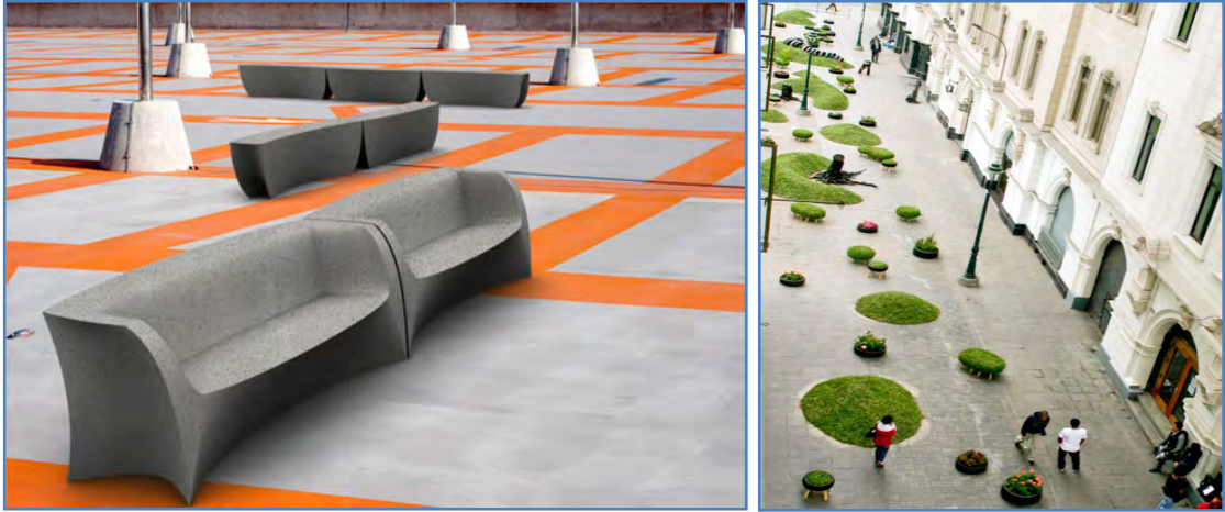
Şekil 7. Yapay ve doğal malzemelerin oluşturduğu dokusal yüzeylere örnekler (URL -13, 2012; URL-14, 2012).