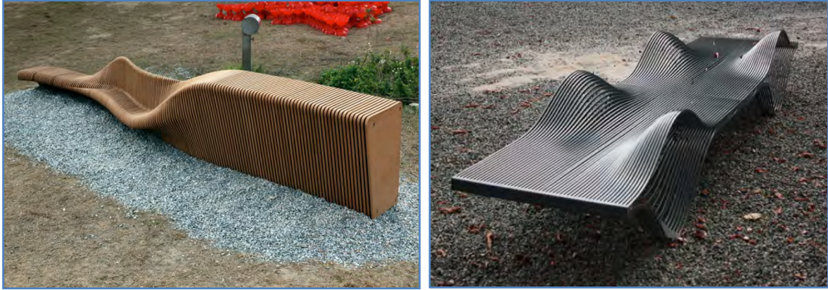
Şekil 1. Özgün ancak işlevselliği tartışılabilir oturma elemanları örneği (URL-1, 2012, URL-2, 2012).

Bir kent mobilyası tasarımında, işlevsellik ön planda tutulmalıdır. Özgün bir kent mobilyası tasarımı işlevsellik taşııyorsa, bulunduğu mekân için sorun oluşturabilir (Şekil 1). Kent mobilyası tasarımında işlevsel yönden, amaca uygun formlar seçilmelidir.