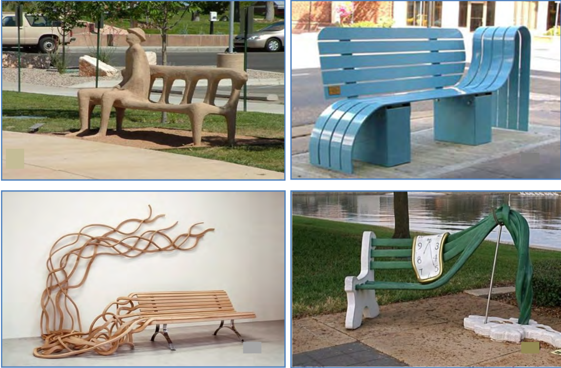
Şekil 2. Estetik ve özgün oturma elemanlarına örnekler (URL-3, 2012).

Ürünlerin işlevselliğinin yanı sıra estetik yönünü tasarımcılar ele almakta, yeni ve yaratıcı fikirlerle ürünleri daha arzulanır bir hale getirmektedirler (Şekil 2) (Kın, 2007).