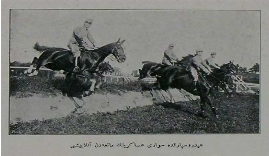
هيدروسپارقه سواری عساکرتك مانعەدن آتلايشى

“Hydrosparkda Dâr’ül-fünûn talebesinin yarışı” Şehbâl, No: 8, 15 Temmuz 1325, p. 157