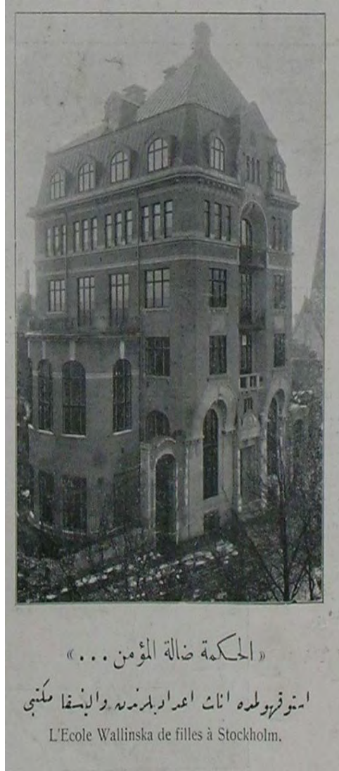
“İstokholmde inâs i‘dâdîlerinden Wallinska Mektebi” Şehbâl, No: 18, 1 Kânun-i sâni 1325, p. 359