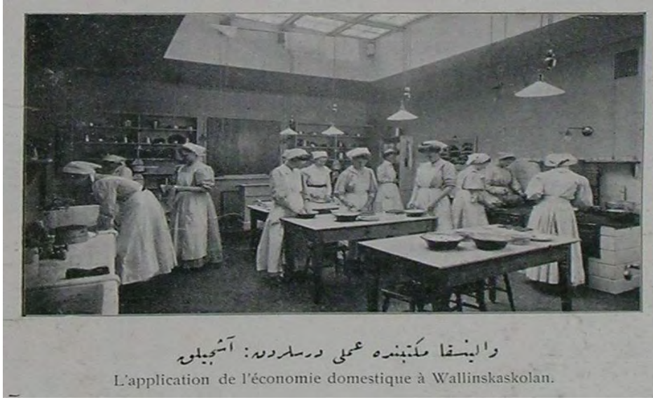
“Wallinska mektebinde ‘amelî derslerden: Aşçılık” Şehbâl, No: 18, 1 Kânun-i sâni 1325, p. 360