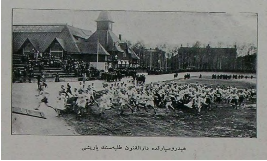
هيدروسپارقه دارالفنون طلبه‌سنك ياريشى

“Hydrosparkda Dâr’ül-fünûn talebesinin yarışı” Şehbâl, No: 8, 15 Temmuz 1325, p. 157