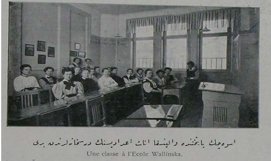
“İsveçin pâyitahtında Wallinska inâs i‘dâdisinin dershânelerinden biri” Şehbâl, No: 18, 1 Kânun-i sânî 1325, p. 360