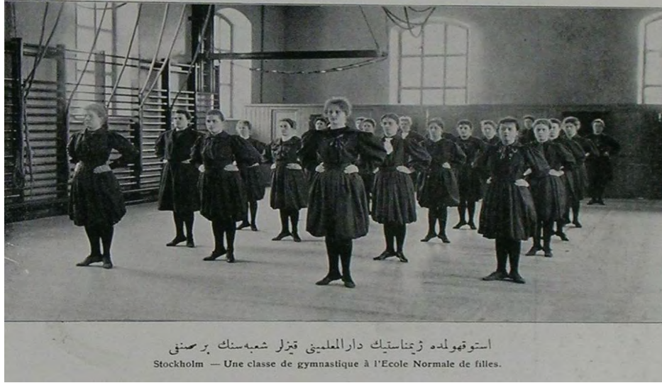
“İstokholmdede jimnastik dâr’ül-mu’allimîni kızlar şuşesinin bir sınıfı” Şehbâl, No: 11, 1 Eylül 1325, p. 216