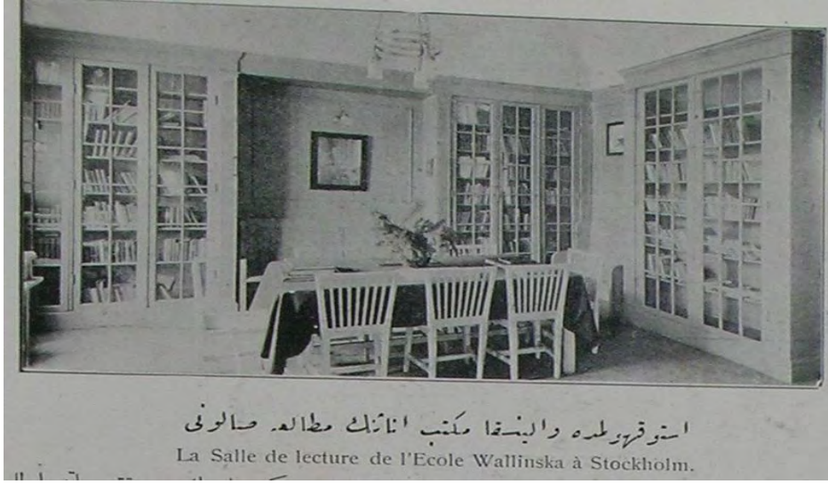
“Istokholmde Wallinska mekteb-i inâsınm mütâla‘a salonu” Şehbâl, No: 18, 1 Kânun-i sânî 1325, p. 360