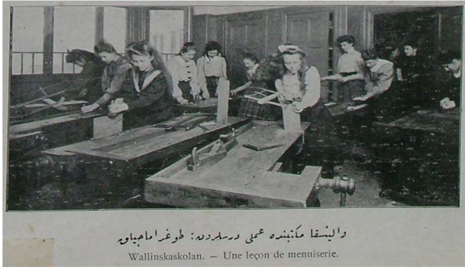
“Wallinska mektebinde ‘amelî derslerden: Doğramacılık” Şehbâl, No: 18, 1 Kânun-i sâni 1325, p. 360