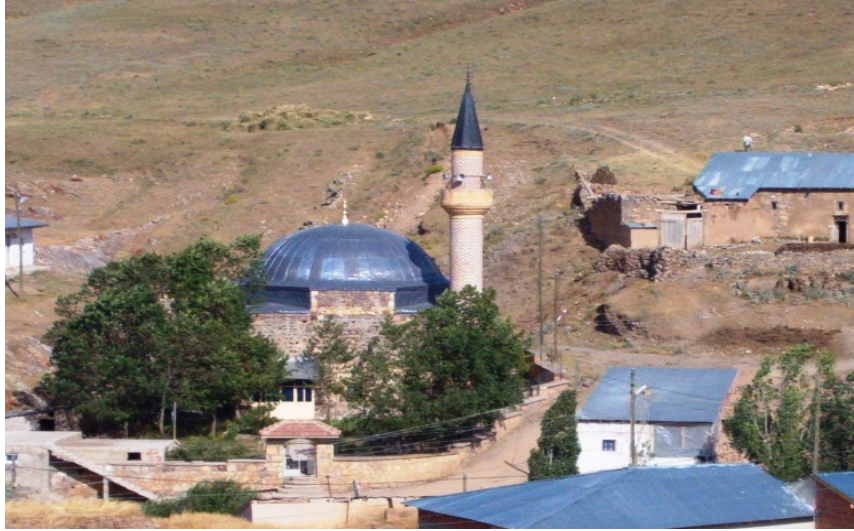
Resim:2- Hınzeverek Köyü Camii'nin uzaktan görünüşü