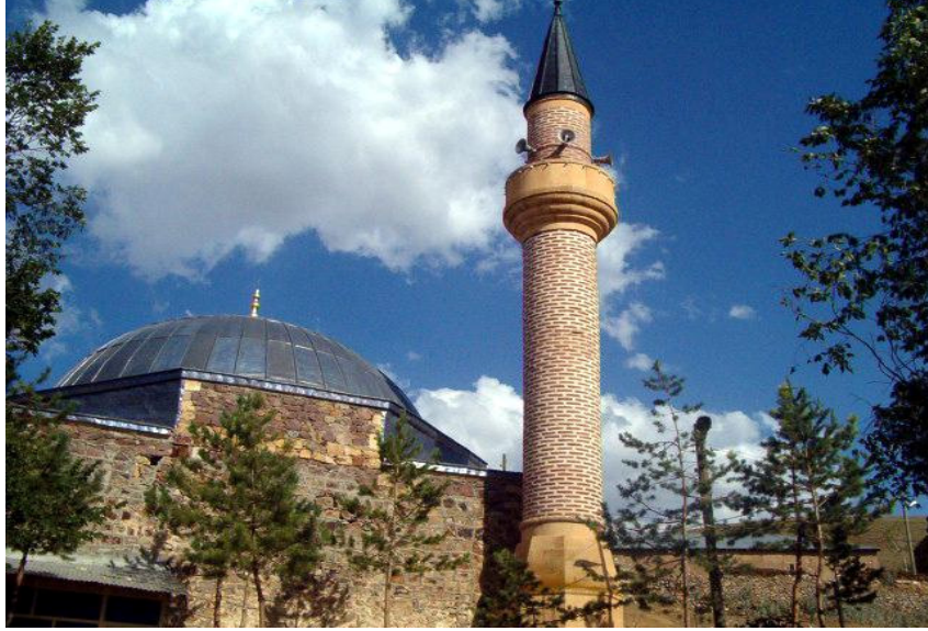
Resim:1- Hınzeverek Köyü Camii'nin dıştan görünüşü