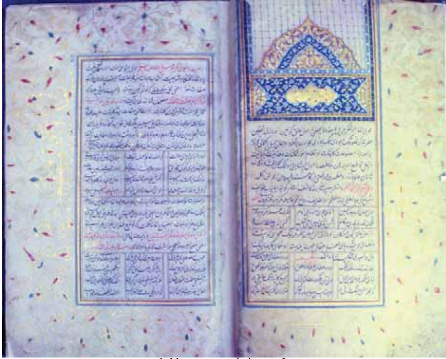
1. Yazmanın zahriye sayfası