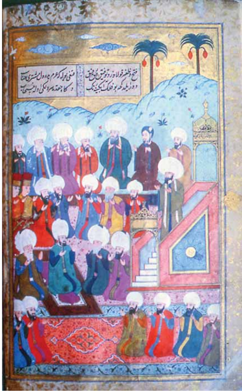
11- Malkoç Ali Paşa'nın Dua Edişi