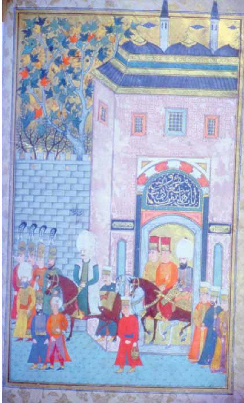
7- Malkoç Ali Paşa'nın Topkapı Sarayı'ndan Yola Çıkışı