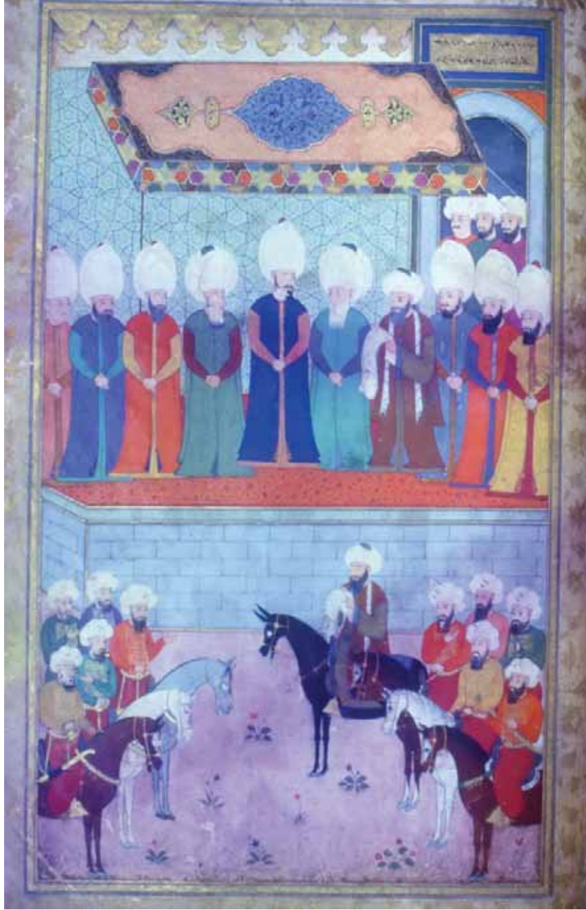
6- Kara Meydanında, Padişahın Emirleri Okuması