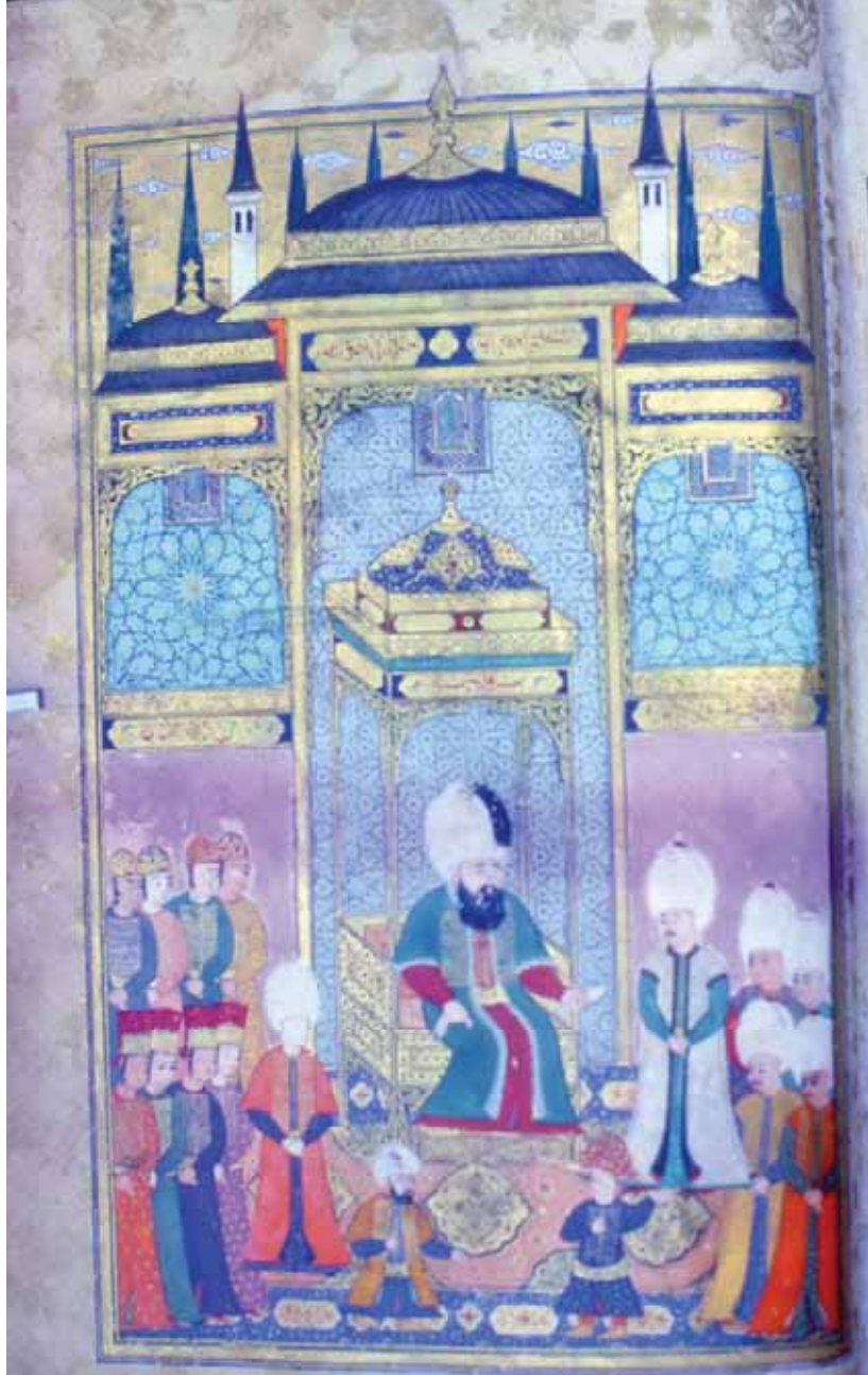
5- Malkoç Ali Paşa'nın, III. Mehmed'in Huzuruna Çıkışı