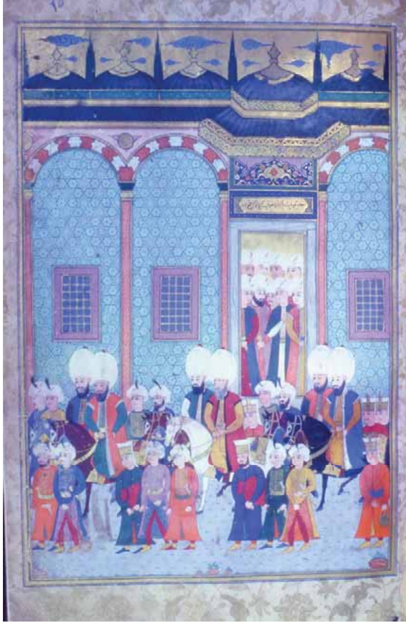
8- Malkoç Ali Paşa'nın Saray Erkânı Tarafından Uğurlanışı