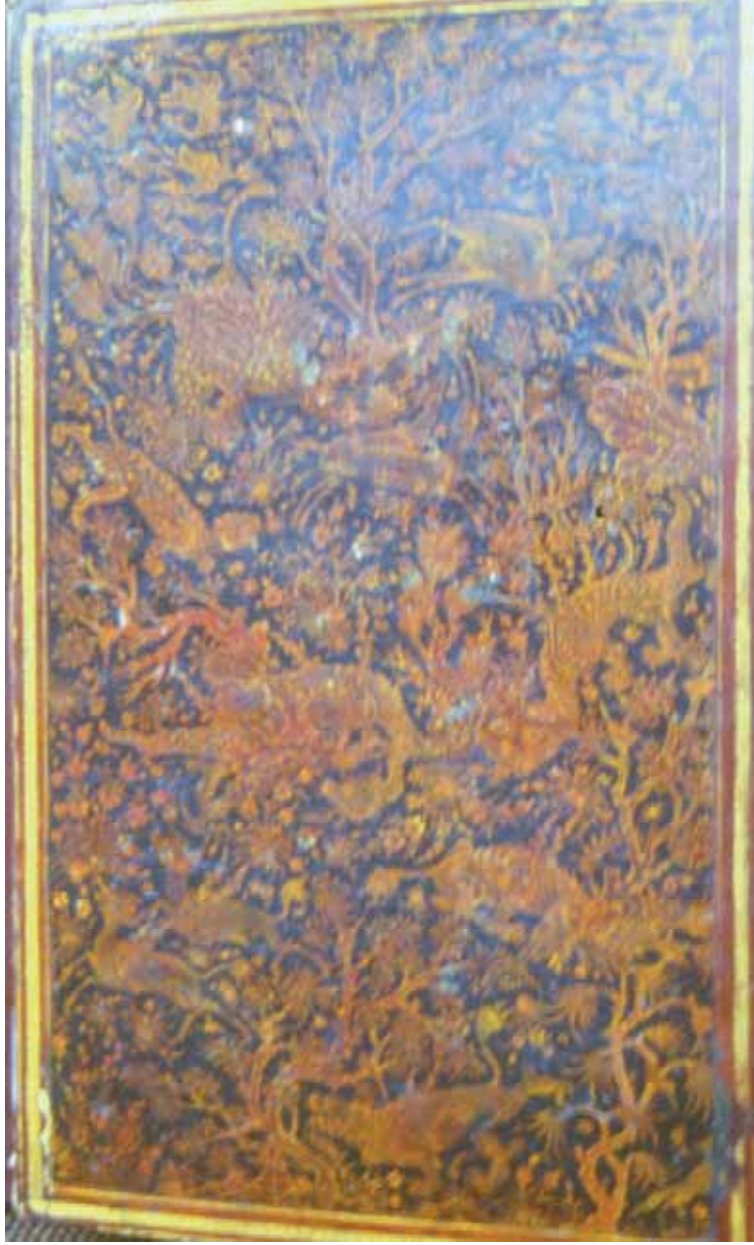
3- Yazmanın cildi