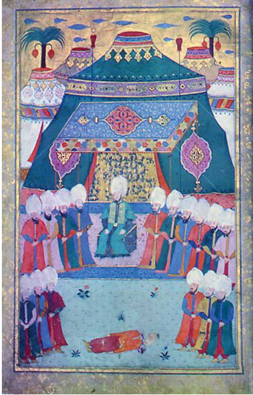
10- Malkoç Ali Paşa'nın İskenderiye'deki Otağı