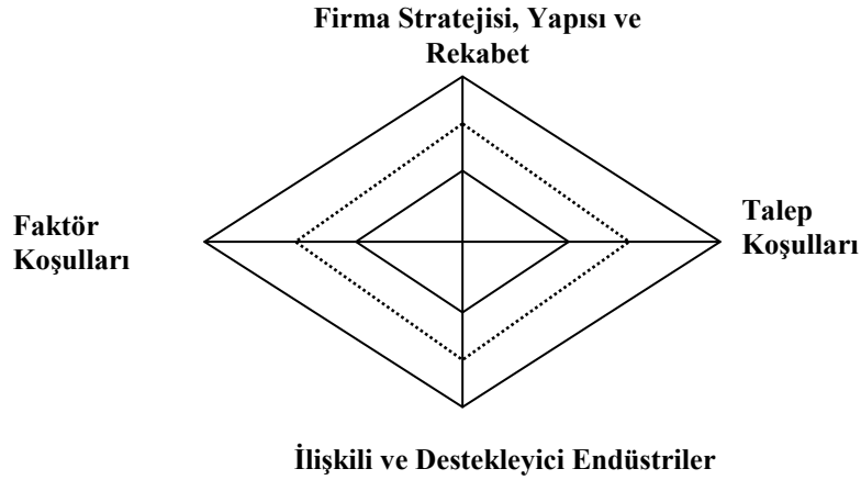
Şekil 3. Genellenmiş Çifte Elmas Modeli.

dışsal parametre olarak kabul etmekten ziyade Elmas modelinin dört belirleyicisi üzerinde önemli bir etkiye sahip değişken olarak görmesidir. 72