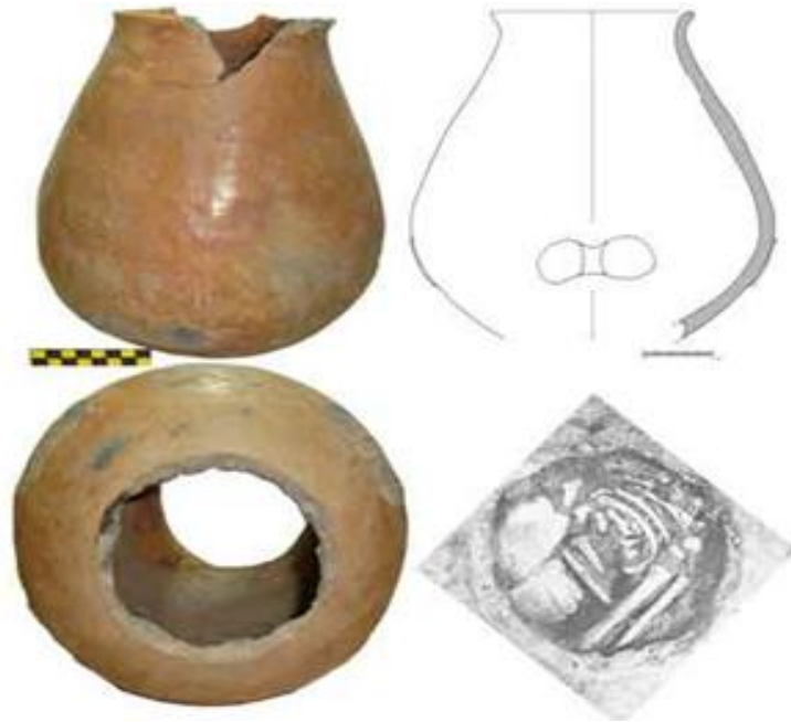
Şekil 2. Orta Tunc devrine ait kırmızı rengli keramik (milattan önce II. Bin).