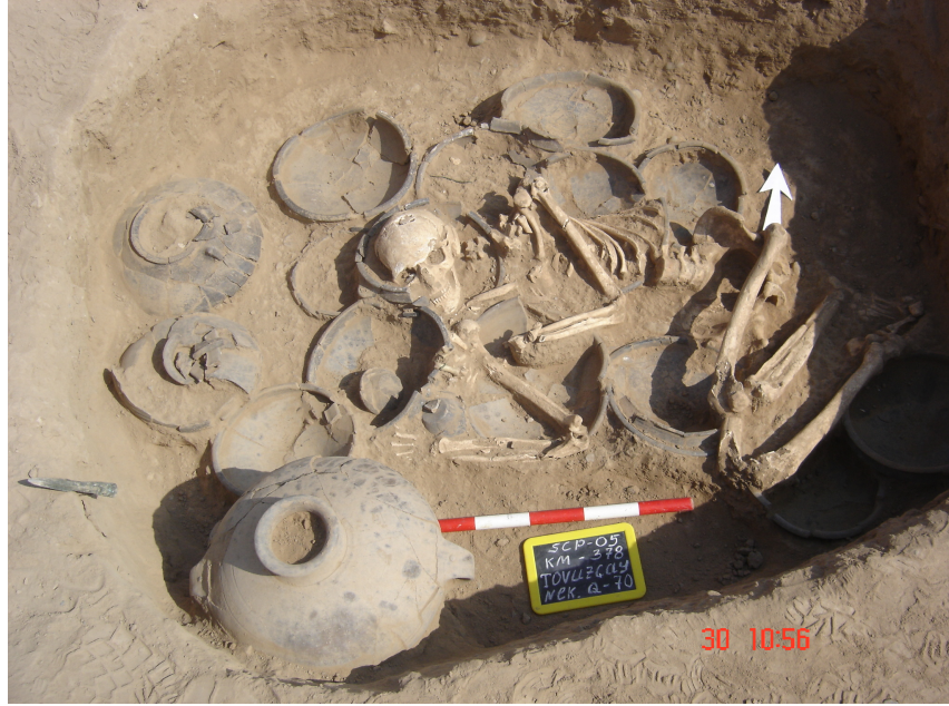
Şekil 1. Orta Tunc devrine ait siyah astarlı keramik (milattan önce II. Bin).