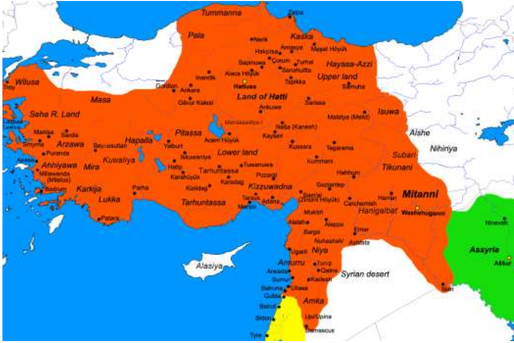
Harita 5 – Hitit Krallığı.