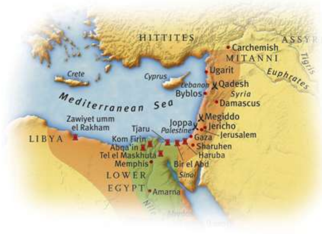
Harita 1 – Hitit ve Mısır Krallıkları