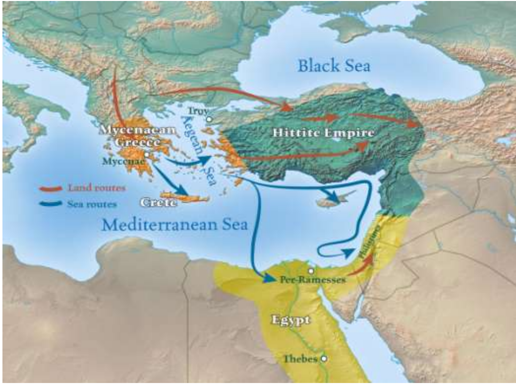
Harita 3 Ege Göçleri