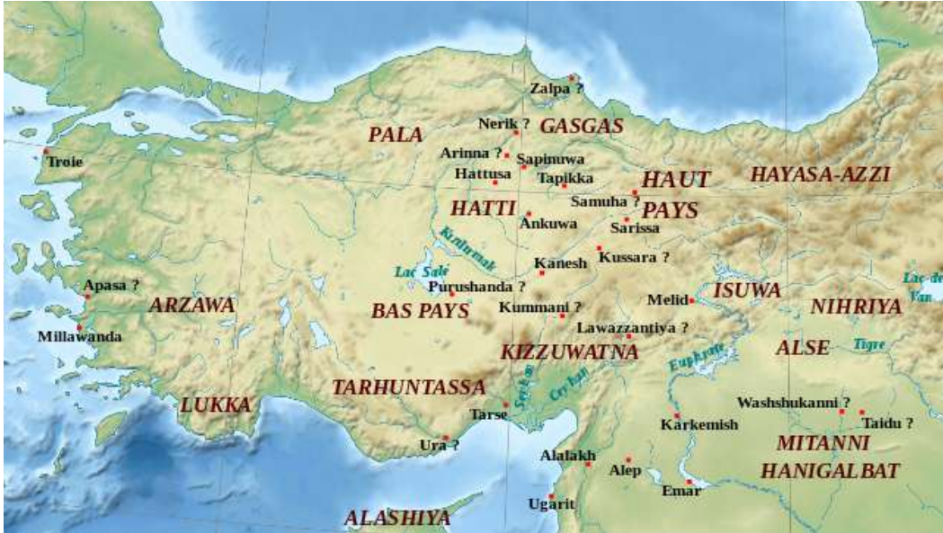
Harita 4 – Hitit Krallığı