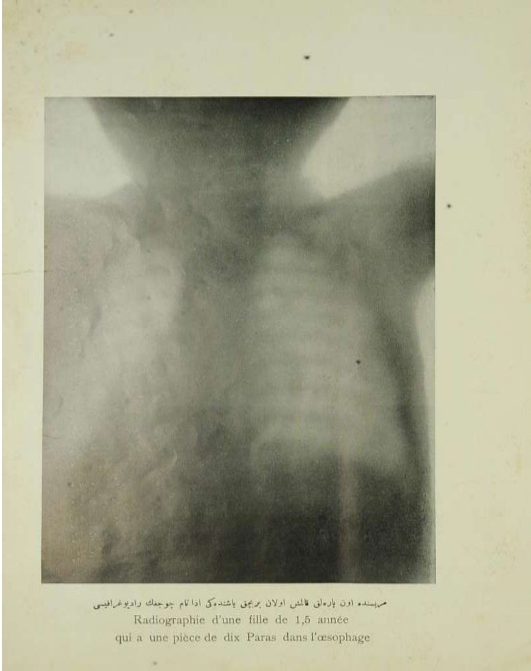
Ek 2; Bir buçuk yaşındaki bir çocuğun radyografisi.