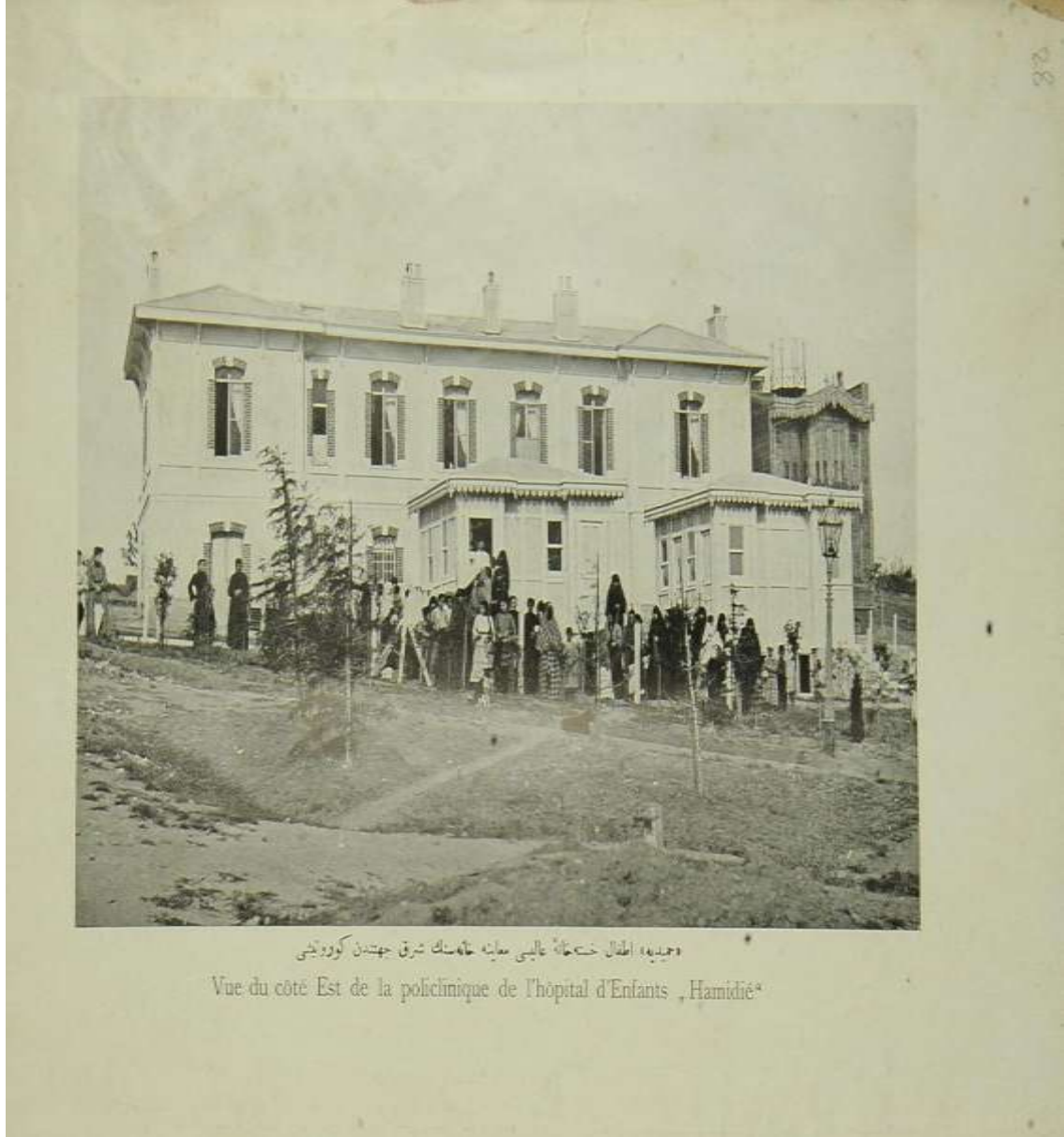
Ek 5; Hamidiye Etfal Hastahane-i Alisi muayenehanesinin şark cihetinden görüntüsü