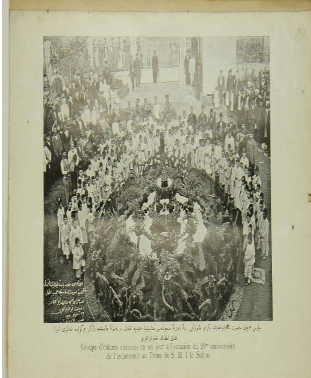
Ek 9; Cülusu Humayun Hazret-i Hilafet Penahi'nin yirmi dokuzuncu sene-i devriye-i mesudesi münasebetiyle Hamidiye Etfal Hastane-i Alisinde yalnız bir günde hitanları(sünnetleri) icra kılınan etfalın fotoğrafları.