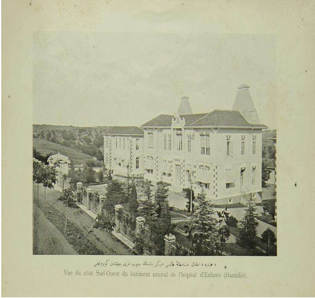
Ek 6; Hamidiye Etfal Hastane-i Alisi merkez binasının cenubu garbi cihetinden görüntüsü