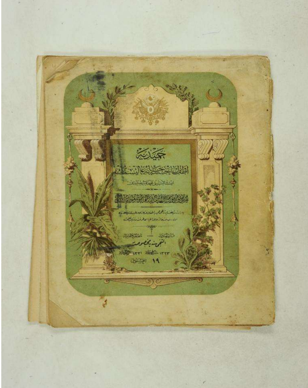
Ek 1; Hamidiye Etfal Hastane-i Alisi İstatistik Mecmua-i Tıbbiyesi kapak sayfası.