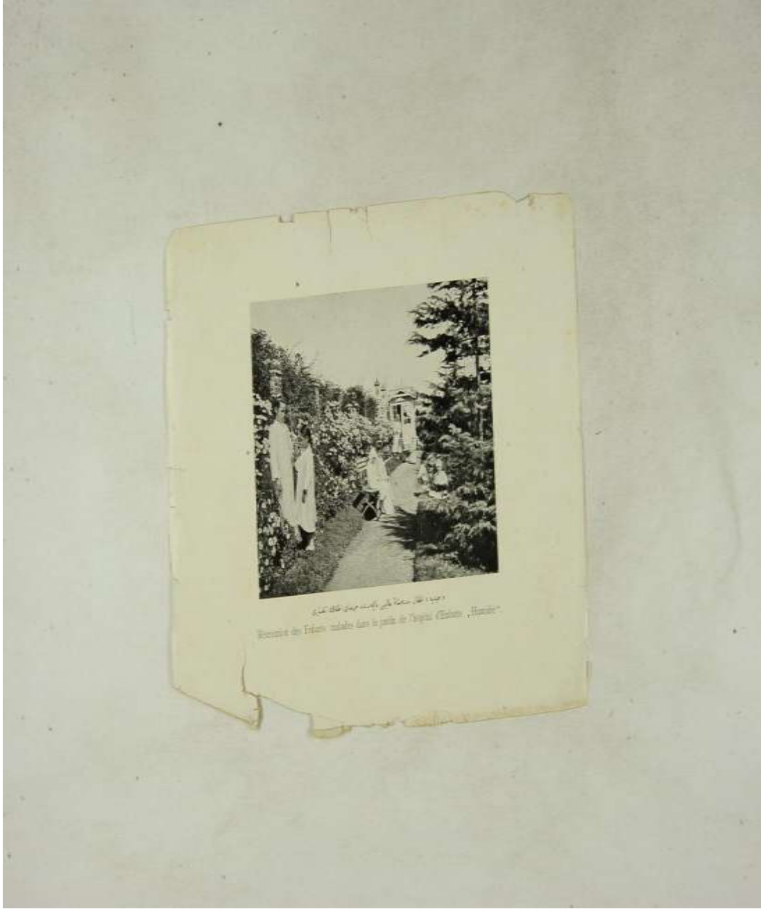
EK 4; Hamidiye Etfal Hastahane-i Alisi bahçesinde merza-i etfalın teneffüsü