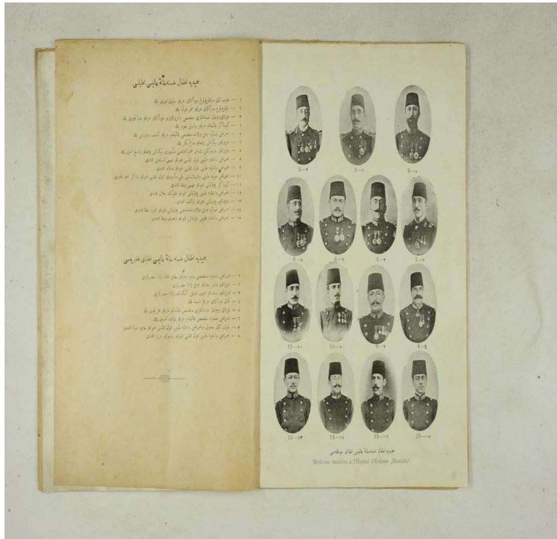
Ek 8; Hamidiye Etfal Hastanesi doktorlarının resimleri