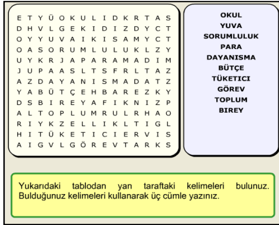
Şekil 5. Etkinlik 4: Sözel-dilsel zeka etkinliği

Etkinlik 4: Bu etkinlikte Şekil 5'deki gibi çocuk vergi bilinci ile alakalı olan 10 adet kelimeyi karışık bir şekilde dizilmiş olan harfler arasından bulmaya çalışmakta ve bulduğu kelimelerden üç adet cümle kurması istenmektedir.