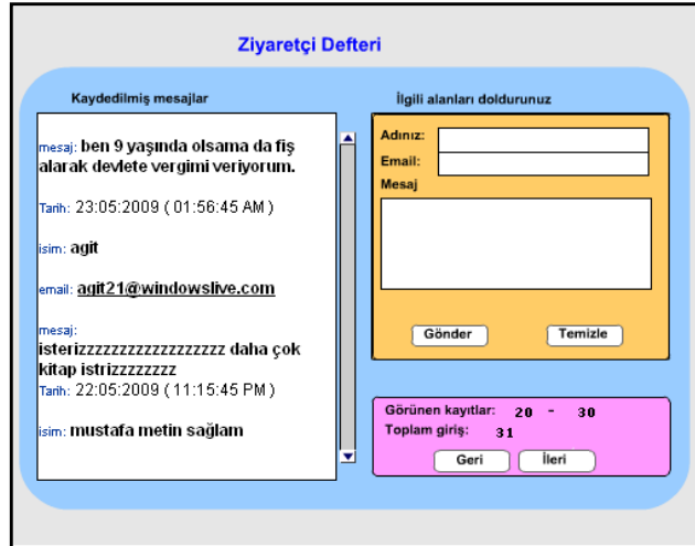
Şekil 14. Ziyaretçi Defteri