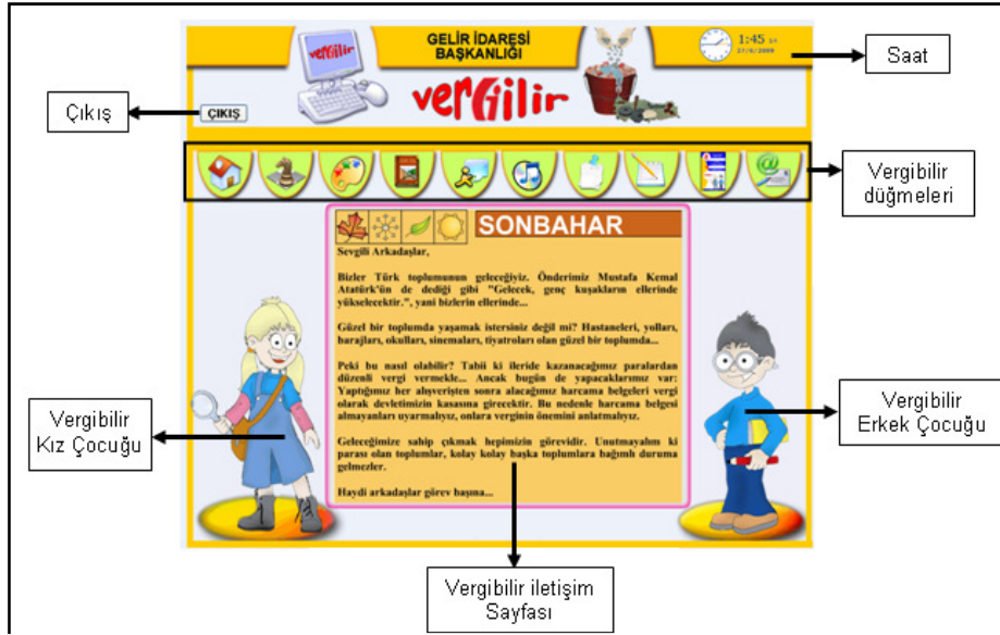
Şekil 1. İnternet Ana sayfası