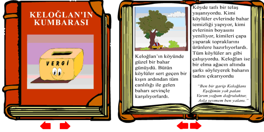
Şekil 13. Keloğlan'ın Kumbarası kitabı