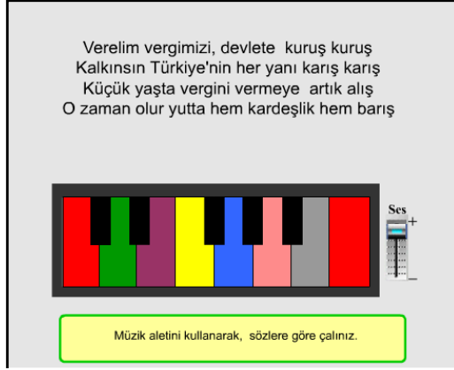
Şekil 4. Etkinlik 3: Müziksel-ritmik zeka etkinliği

Etkinlik 4: Bu etkinlikte Şekil 5'deki gibi çocuk vergi bilinci ile alakalı olan 10 adet kelimeyi karışık bir şekilde dizilmiş olan harfler arasından bulmaya çalışmakta ve bulduğu kelimelerden üç adet cümle kurması istenmektedir.