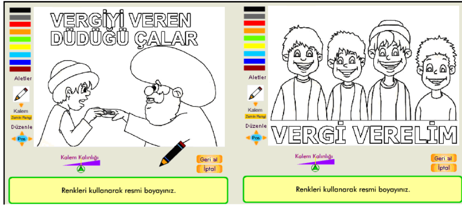
Şekil 6. Etkinlik 5 ve 6: Görsel-uzamsal zeka etkinliği

Etkinlik 7: Bu etkinlikte çocuklara bir soru sorulmakta ve bu soruya bir cevap vermeleri istenmektedir. Şekil 7'deki gibi, çocuklardan verginin önemi ile ilgili kendi fikirlerini ifade etmelerini istemektedir. Bu etkinliğin çocuklara vergi bilinci kazandırılma aşamasında çok önemli olduğu açıktır.