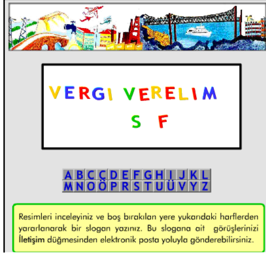
Şekil 12. Etkinlik12: Sözel-dilsel zeka etkinliği