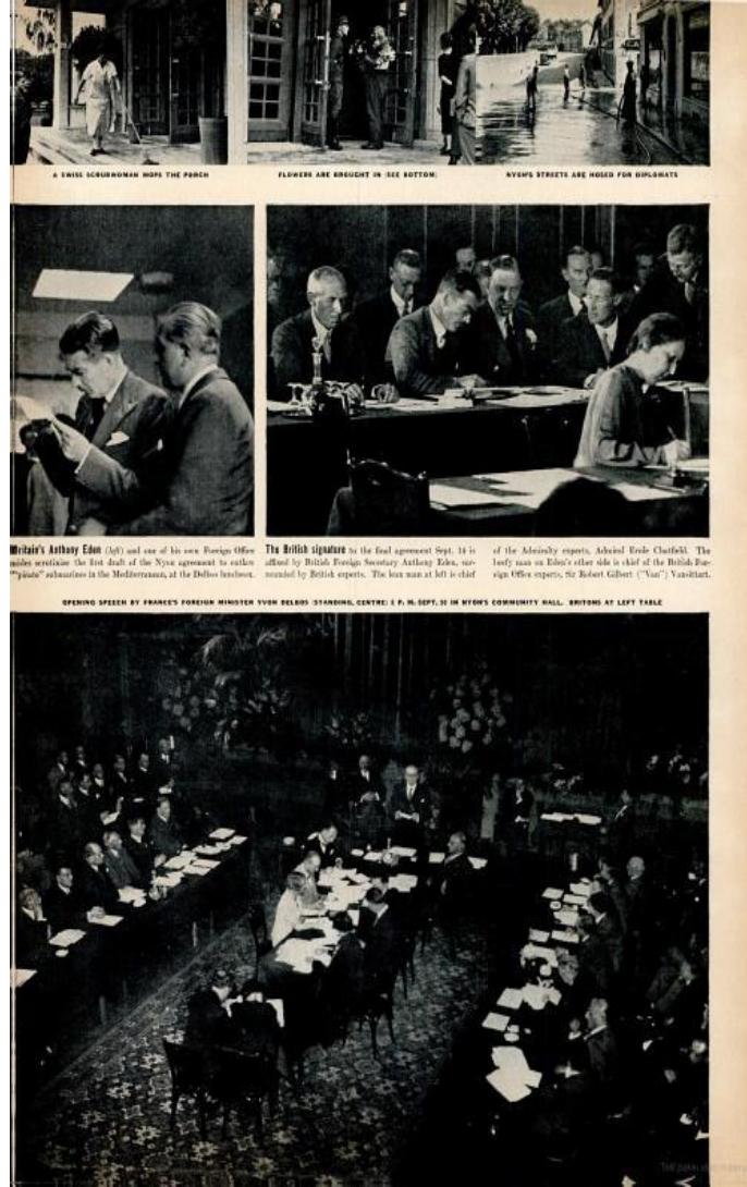
Nyon Konferansı Toplantıları Life Dergisi, October 4 1937, s.99.