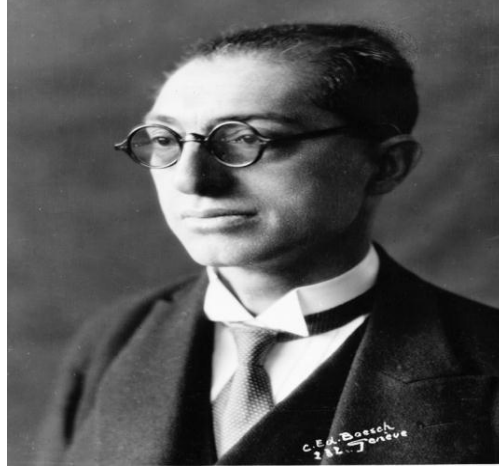
Dışışleri Bakanı Tefik Rüştü Aras Bey