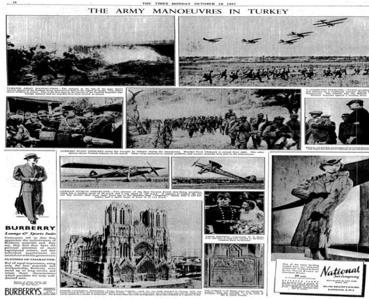
18 Ekim 1937 tarihli The Times Gazetesi (Türkiye’deki Askeri Tatbikatlar)