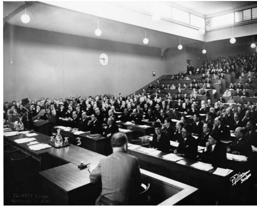
Milletler Cemiyeti'nin 26-27 Mayıs 1937 tarihli Cenevre toplantısı