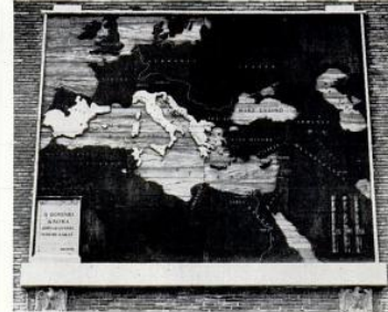
The Empire 146 B.C. shows that ancient Rome has begun to expand, has already conquered all Italy, Greece, most of Spain and got a foothold on Africa with the defeat of Carthage. The Mediterranean was Roman. Soon Caesar will take care of Gaul and southern Britain.