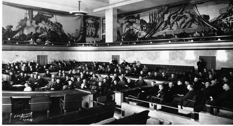
Milletler Cemiyeti’nin 26-27 Mayıs 1937 tarihli Cenevre toplantısı