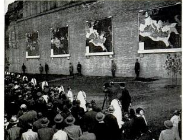
Italian Empire wall maps have been mounted (above) by Mussolini on a basilica wall near Rome's Colosseum. First in the series, the plaque (at extreme left) is entirely grey except for a tiny white circle marking the 8th Century a. c. city of Rome, without possessions.

There the "piracy" temporarily stopped and the anti-piracy conference outlawed the mystery submarines, as well as mystery planes and warships. On Sept. 18, an unofficial report asserted that a "pirate" submarine had attacked the British aircraft carrier Glorious near Malta. And off the north coast of Spain a plane dropped six bombs, all misses, at the British destroyer Fouries .