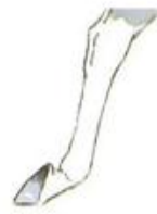
ÇİZME SEKİ(BEYAZ BACAK)

seki bk. seki (II) [DS c:10] Yukarı Dinek *Karaağaç -Isparta; İrişli, Bayburt *Sarıkamış -Kars; Erkinis *Yusufeli -Artvin; *Antakya -Hatay; *Pınarbaşı -Kayseri; -Konya; *Mut köyleri -İçel; Apturrahmanlar *Serik -Antalya