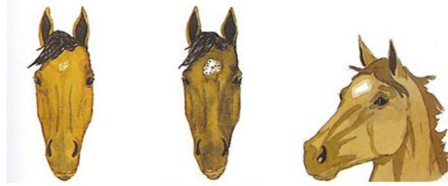
ALINDA BİRKAÇ BEYAZ KIL

ahutma bk. ahıtma [DS c:1] *Reyhanlı -Hatay