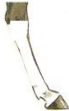
ÇOK YÜKSEK SEKİ