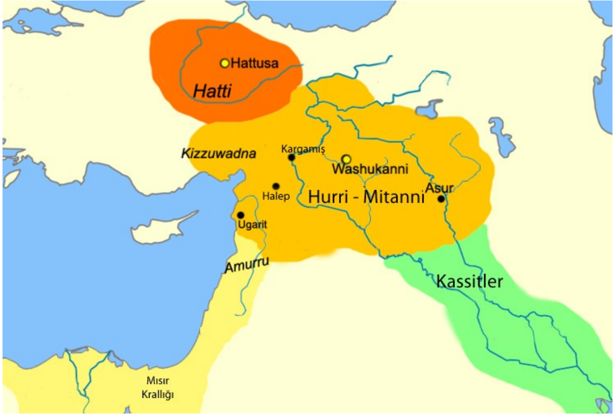
Harita – 2 Ege Göçleri'nden önce Anadolu ve Kuzey Suriye