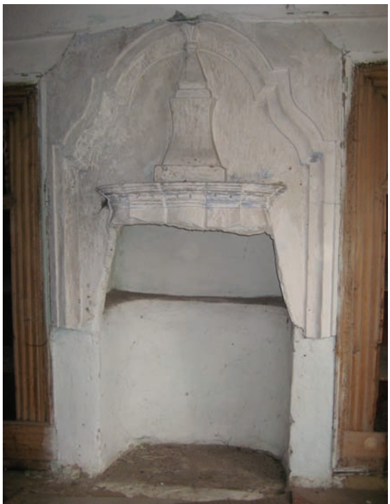
Fotograf 8. Zemin kat büyük oda ocak