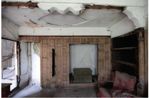
Fotograf 6. Büyük oda ahşap dolap