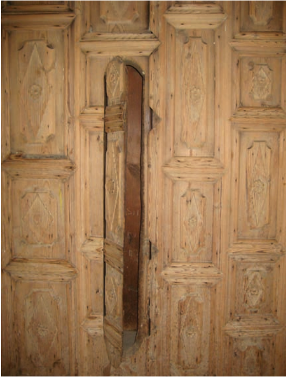
Fotograf 7. Ahşap dolap detay (silahlık)