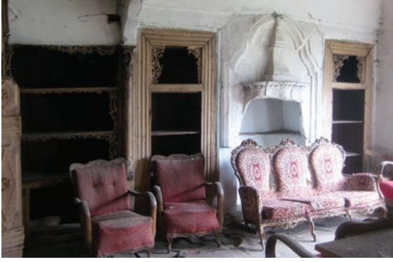
Fotograf 5. Zemin kat büyük oda