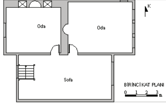
Şekil 4. Konut birinci kat planı (Çizim: Emine SAKA AKIN)