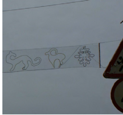
Fotoğraf 5-6: Keçi / Elik Heykeli ve Şehir Süsleme Figürü (Calalabat-Kırgızistan)

Kaya üzerine nakşedilmiş dağ keçisi / elik örneklerinden bir tanesi de Azerbaycan'da Bakü'nün 50-60 km güney batısında yer alan Kubistan'dadır. Kubistan'da kaya üzerinde bulunan dağ keçisi / elik resimlerinin 6-7 bin yıl önce çizildiği tahmin edilmektedir 18 .