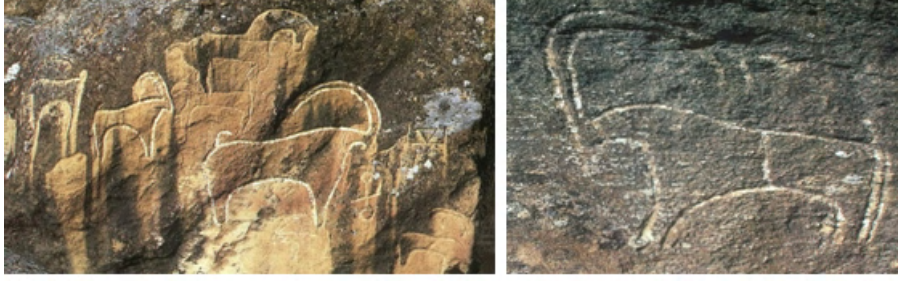
Fotoğraf 7-8: Azerbaycan-Kubistan Kaya Üstü Resimleri (İ.M. Caferzade, Kubistan- Kayaüstü Resimler , Bakı 1999, s. 114-123.)

The Ibex/Chamois as a Petroglyphical Image (Rock Art) and its Historical Background