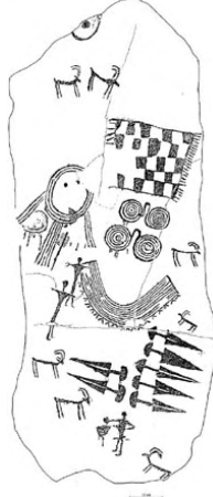
Fotoğraf 15: Italia – Valcamonica (İtalya: http://www.euopreart.net/slide.htm )

ülkeleri ve Alp Dağları üzerinde, rastlamamız gerçekten ilgi çekicidir. Konuyu dağıtmamak açısından Avrupa kıtasından birkaç örnek vermekle yetinmenin doğru olacağı düşüncesindeyiz.