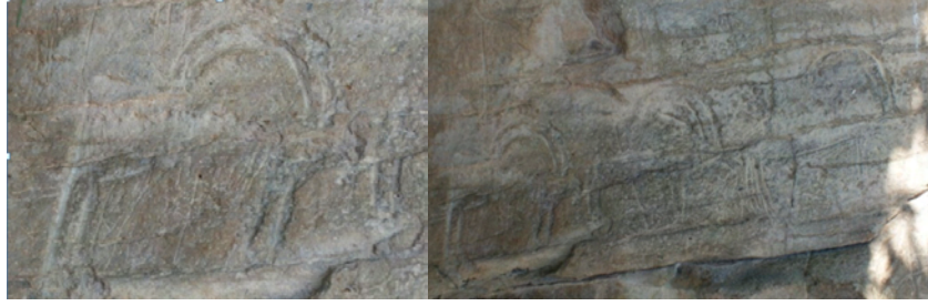
Fotoğraf 13-14: Ankara – Güdül İlçesi Salihler Köyü Keçi / Elik Figürleri

Ankara'nın Güdül ilçesi Salihler köyünde ise toplu olarak kaya üzerine kazınmış keçi / elik 24 figürleri bulunmaktadır: