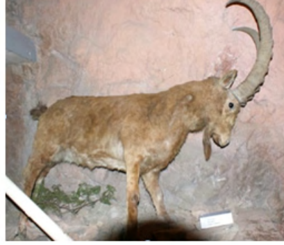
Fotoğraf 3-4: Kaya Üstü Dağ Keçisi / Elik Figürü ve Dondurulmuş Olarak Dağ Keçisi / Elik Heykeli (Oş Müzesi-Kırgızistan)

Kırgızistan'ın Calalabat şehrinde dağ keçisi / elik'in ilginç iki heykeli bulunmaktadır. Ayrıca şehir ışıklandırmasında da dağ keçisi / elik figürü kullanılmıştır: