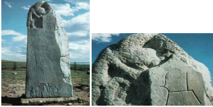
Fotoğraf 1-2: Kültiğin Yazıtı'nın Doğu Yüzünde Dağ Keçisi / Elik Damgası (Fotoğraf: C. Alyılmaz, Orhun Yazıtlarının Bugünkü Durumu , Ankara 2005, s. 32-33)

The Ibex/Chamois as a Petroglyphical Image (Rock Art) and its Historical Background