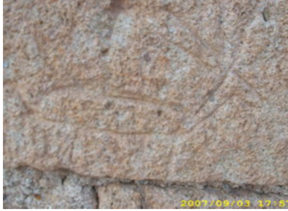
Fotoğraf 12: Eskişehir-Seyitgazi Kümbet Köyü Keçi / Elik Figürü

Ankara'nın Güdül ilçesi Salihler köyünde ise toplu olarak kaya üzerine kazınmış keçi / elik 24 figürleri bulunmaktadır: