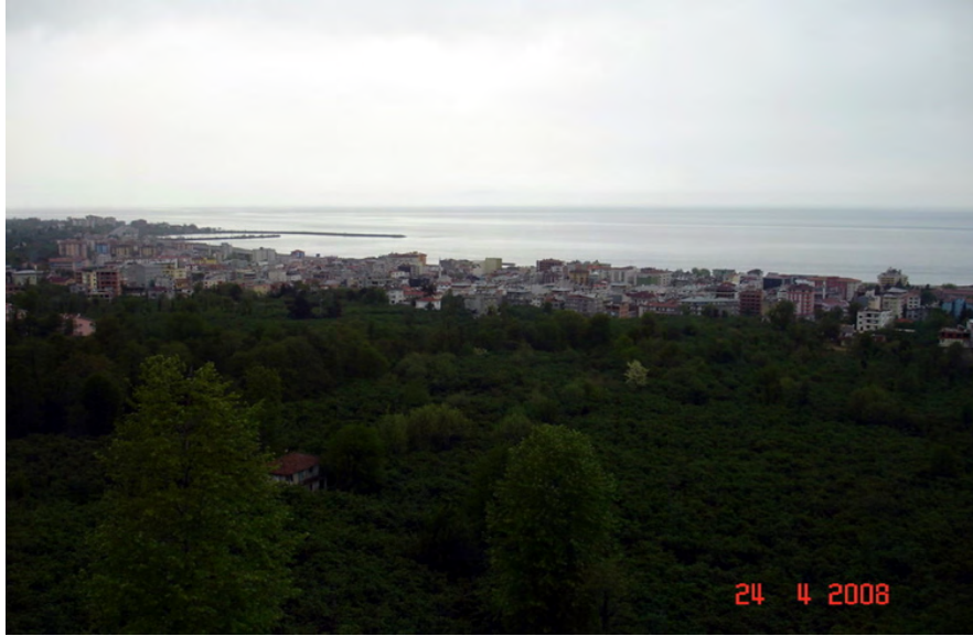
Fotoğraf 20: Beşikdüzü İlçesinin Beşikdağı'ndan Görünüşü

Yakın zamanlarda Beşikdağı'nın eteklerinde yerleşim yeri kurulur. Beşikdağı'nın eteklerinde olduğu için buraya “ Beşikdüzü ” ismi verilir. Yani Trabzon'a bağlı Beşikdüzü ilçemizin isminin kaynağı bu efsaneye dayanmaktadır.