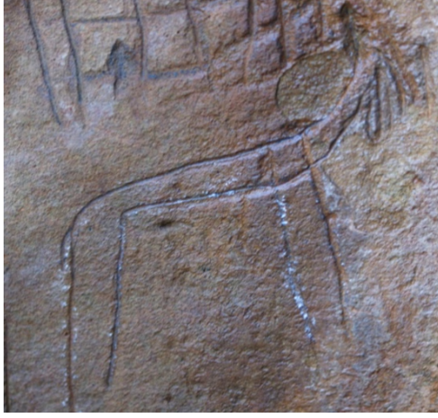
Fotoğraf 9: Ordu İli Mesudiye İlçesi Esatlı Köyünde Dağ Keçisi / Elik Figürü

Üç adet dağ keçisi / elik figürü de Adıyaman ili merkez Palanlı köyü sınırları içerisinde Pirin çayına bakan doğal bir mağara içerisinde bulunmaktadır. Palanlı köyü, Adıyaman'ın kuzeyinde kalmakta olup şehir merkezine yaklaşık 10 km uzaklıktadır. Palanlı mağarası ise yaklaşık 15 km'dir. Resimlerin bazı kısımları kazınmak suretiyle tahrip edilmiştir. Adıyaman-Merkez Palanlı köyü mağarasında bulunan dağ keçisi figürleri şunlardır: