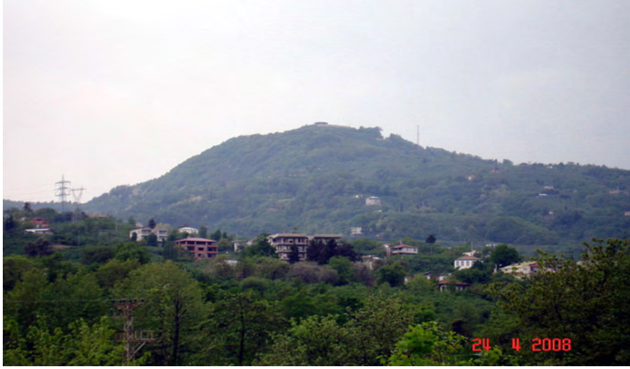
Fotoğraf 19: Beşikdağı'nın Beşikdüzü İlçesinden Görünüşü

Yakın zamanlarda Beşikdağı'nın eteklerinde yerleşim yeri kurulur. Beşikdağı'nın eteklerinde olduğu için buraya “ Beşikdüzü ” ismi verilir. Yani Trabzon'a bağlı Beşikdüzü ilçemizin isminin kaynağı bu efsaneye dayanmaktadır.