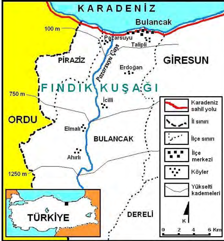
Şekil 1: Araştırma sahası.

burada bulunan Erdoğan ve İcilli köylerini, üçüncü kademe ise 750-1250 m'ler arasını ve burada bulunan Elmalı ve Ahırlı köylerini kapsamaktadır (Şekil 1).