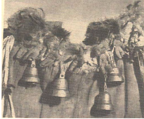
Fotoğraf 4: Şaman Cübbesi Üzerindeki Askılar, Kuklalar, Çanlar, Puhu Kuşu Telekleri- Altaylar. (AEM Kol. No:5064-2)

Onun kostümü “hamton” ya da “manyak”tır 37 . Altaylarda giysinin üzerinde gök kızlarını temsil eden içleri kürkle doldurulmuş kuklalar bulunmaktadır.