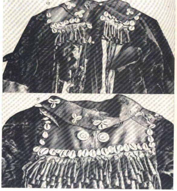
Fotoğraf 2 : Hakas Şaman kostümünün önden ve arkadan görünüşü. (Akademia Nauk Soyuzu Sovetskix Socialističeskih Respublik, İnstitut Etnografi İmeni N. N. Mikluho Malaya, s. 70,71)

Hakaslara ait ünik bir örnekte dikiş tarzı ve tasarım bakımından farklılık görülmektedir. Giysi düz sırt kesimlidir. Ayrıca Altay ve Hakas kostümlerinde diğer kostümlerden ayırt edici bir özellik olan göğüslük bulunmadığı hâlde bu giyside göğüs levhası bulunmaktadır. Bu özellik kostümü Tofalar ve Tuvaların kostümlerine yaklaştırmaktadır. Giysinin sırtında bulunan askıda kanatları kapalı bir kuşun metalik tasviri vardır. Bu tasvire sık rastlanmayıp Ketlerin çelenklerinde olan kuş tasvirlerine benzemektedir. İşlev ve mana bakımından fazla bir önemi olmamakla birlikte giyside metalik askılar ve yakaya dikilmiş kürk parçaları da mevcuttur 23 .