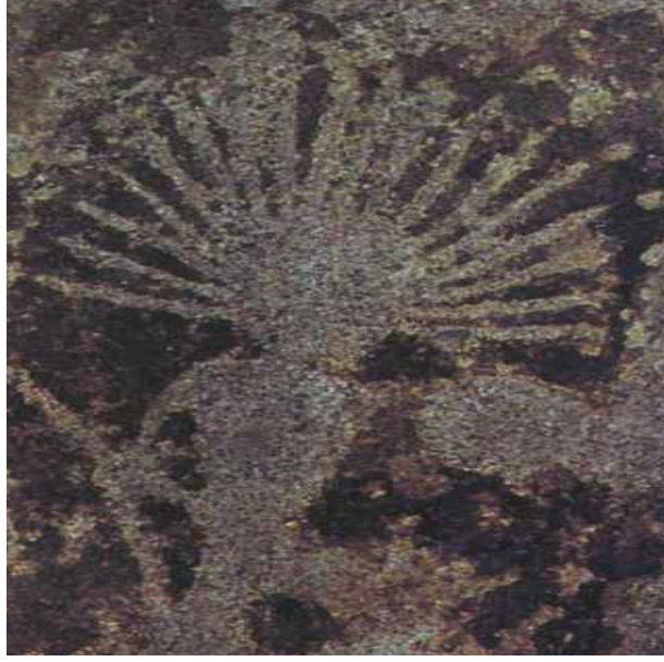
Fotoğraf 1: Altaylar, Karakol'da bulunan mezar levhası üzerinde Şaman tasviri, MÖ 2000.

Eski Sovyet şimdiki Rusya sınırları içerisinde olan Sibirya bölgesi geçmişten günümüze önemli Şamanlık (Kamlık) verilerini barındırmaktadır. Türk Şamanlığı konusunda klasik literatür çoğunlukla Sibirya üzerinde odaklanmıştır. Dünyanın birçok ülkesinde varlık gösteren Şamanların ayrıca; Kuzey ve Güney Amerika, Avustralya, Endonezya, Güney-Doğu Asya, Çin, Tibet ve Japonya'da yoğunlaştığı bilinmektedir. Şamanlık sisteminin ülkeler ve bölgeler arası farklılıklarının yanı sıra aynı bölgenin değişik halkları arasında da farklılıklar görülmektedir. Konumuzun sınırlarını çizen Sibirya bölgesi Türk Şamanlarının farklı topluluklarında olduğu gibi kostüm biçimleri ve eklerinin semantik yorumlarında bazı ayrılıklar söz konusu olmaktadır 3 .