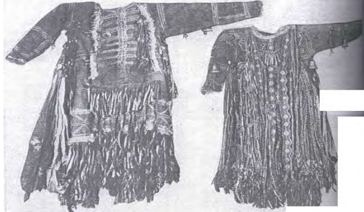
Fotoğraf 3: Şaman Giysilerinde İskelet Simgeciliği, Tofalar

Tüm Şaman topluluklarında olduğu gibi Sibiry Türk Şaman topluluklarında da en çok görülen simgecilik türlerinden birisi kuş simgeciliği diğeri ise iskelet simgeciliğidir.