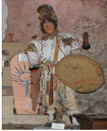
Fotoğraf 2: Oş Şehri Müzesi Şaman Seksiyonu, Kırgızistan

Şaman'ın bedenini reel dünyadan koparıp kozmik ve sınır ötesi âleme götüren vasıta içinde ruhların yerleştiği elbisesidir. Yardımcı ruhların çoğu giyside yaşadıklarından kötü ruhlardan hem fiziksel olarak hem de manevi olarak giysiler ve üzerlerindeki ekler sayesinde korunurlar. Bu nedenle Şamanlar ruhlardan ilk olarak “manyak” yapmak için izin almışlardır. Her ne kadar özel kostüm giyilmeden giysi kadar önemli olan yalnızca davul ile de ayin yapılabilindiği gibi asıl kamlık giysi ile yapılandır 27 .